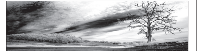
10. Mực nước tại các hồ chứa, giống như hồ nước này tại khu vực Gers (Pháp) đã xuống thấp một cách đáng báo động ở nhiều khu vực trên thế giới do ảnh hưởng bởi khô hạn. Điều này buộc các nhà chức trách phải đưa ra các bộ luật về sử dụng nước tiết kiệm.