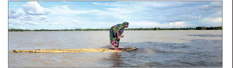
2. Trong một trận lũ lụt tại khu vực Islampur, Jamalpur của Bangladesh, một người phụ nữ đang dùng chiếc bè tự chế tìm đến nơi khô ráo để trú ẩn. Bangladesh là một trong những quốc gia dễ bị "tổn thương" nhất trên thế giới khi mực nước biển dâng cao. Theo dự báo, khoảng 10 triệu người dân nước này sẽ trở thành những người "vô gia cư" vào năm 2050 do nước biển dâng.