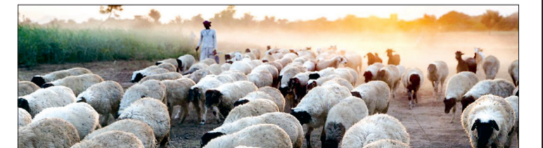
8. Một người chăn cừu đang lùa đàn cừu của mình tìm đến nơi có đồng cỏ xanh tại ngôi làng Sirohi thuộc bang Rajasthan, phía bắc Ấn Độ. Khu vực này chịu ảnh hưởng nặng nề bởi những đợt nắng nóng và khô hạn kéo dài. Người dân sinh sống tại đây đều lo lắng trước dự báo nhiệt độ sẽ còn tiếp tục tăng cao.