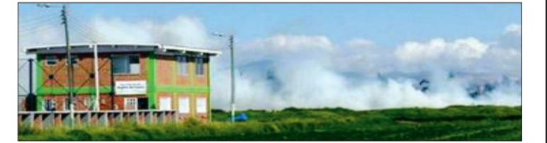
5. Những làn khói trắng chứa đầy khí carbon - một trong những nguyên nhân gây nên tình trạng biến đổi khí hậu, bao phủ trên một cảnh đồng tại Colombia.