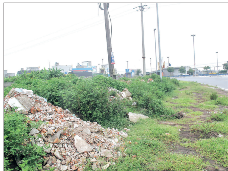
Rác thải xây dựng tràn lan trên đường tránh 39B, đoạn xã An Bối.