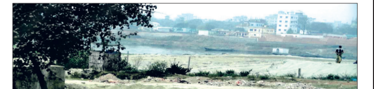
6. Nơi đây từng là một dòng sông hiếm hoi chảy qua một trong những khu vực khô hạn nhất trên trái đất thuộc địa phận Bangladesh. Dòng sông đã "bốc hơi" hoàn toàn, hệ quả của nhiệt độ tăng cao.