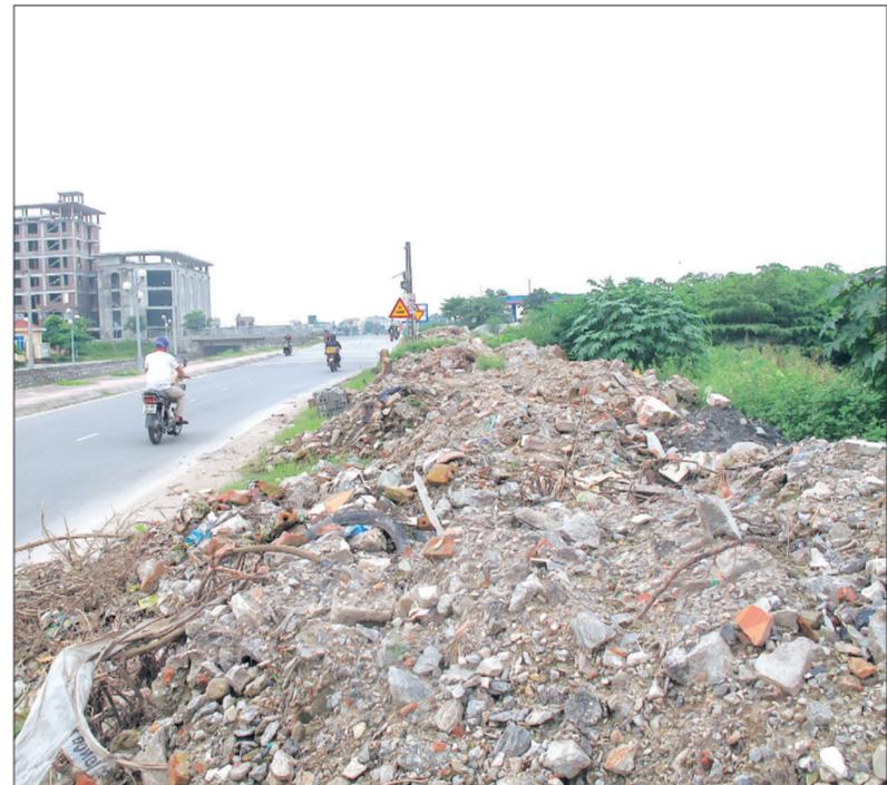
Ngay đối diện trụ sở Huyện ủy, HĐND, UBND huyện, rác thải xây dựng chất thành đống.