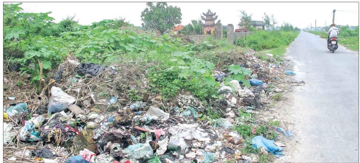
Rác thải sinh hoạt tràn cả đường đi tại xã Vũ Ninh.