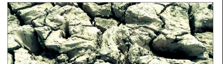
7. Tỉnh Sindh, Pakistan chịu ảnh hưởng kép của biến đổi khí hậu. Nhiều nơi chịu ảnh hưởng của lũ lụt trong khi nhiều nơi chịu khô hạn kéo dài. Tình trạng thiếu nước trầm trọng diễn ra ở nhiều nơi, không đủ để trồng trọt hoặc chăn nuôi. Mặt đất nứt toác vì khô hạn.