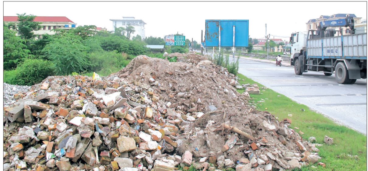
Rác thải xây dựng tràn lan tại khu vực đối diện Đài TTTT huyện.