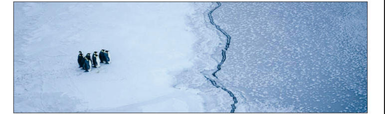
1. Những chú chim cánh cụt đứng trước một vết nứt trên biển băng gần khu vực trạm dự báo thời tiết McMurdo tại Nam Cực.

(nhandan.com.vn) Theo Tổ chức Khí tượng thế giới (WMO), tình trạng biến đổi khí hậu đang là mối đe dọa gây nên những thảm họa thiên nhiên với cùng khốc liệt, dẫn tới những tác động trên diện rộng đối với sức khỏe con người, các hệ sinh thái; đồng thời, gây thiệt hại nặng cho ngành Nông nghiệp và lâm nghiệp cơ sở hạ tầng.