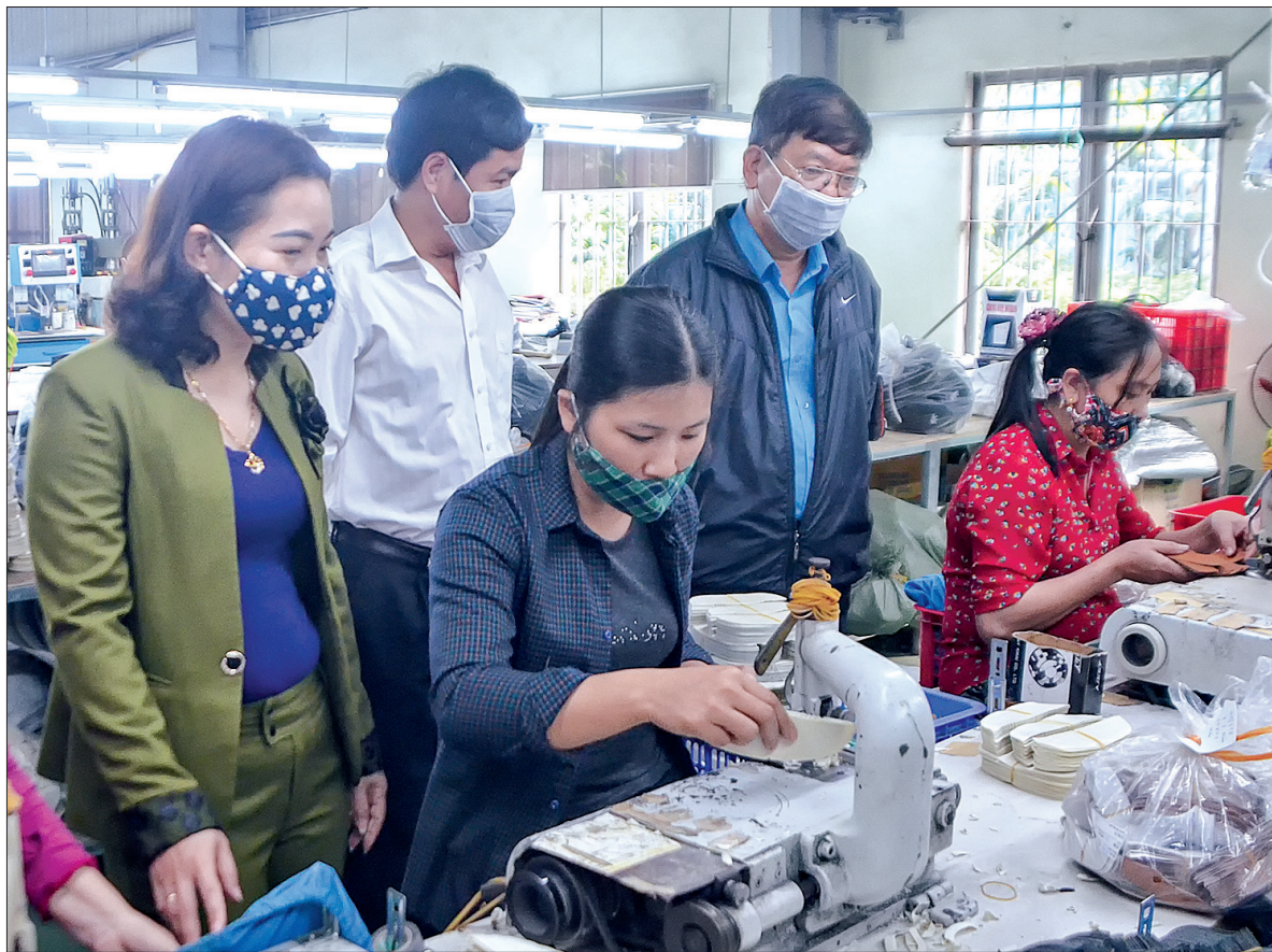
Liên đoàn Lao động thành phố Thái Bình kiểm tra hoạt động sản xuất và công tác phòng, chống dịch bệnh tại Công ty TNHH Da giấy xuất khẩu Thành Phát.

Việc hỗ trợ kinh phí mua khẩu trang thể hiện sự quan