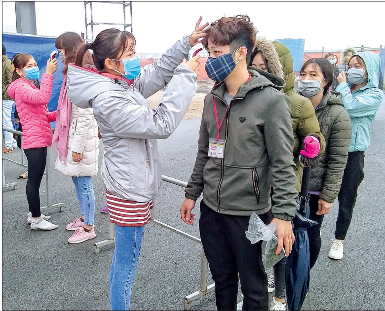
Kiểm tra thân nhiệt cho người lao động tại Công ty TNHH Creative Source, xã Minh Lăng (Vũ Thu).

khẩu trang vải để phát cho công nhân. Đối với các công đoàn cơ sở có người nước ngoài, nhất là lao động đến từ các vùng có dịch, các doanh nghiệp đã thực hiện cách ly yêu cầu theo dõi sức khỏe trong 14 ngày trước khi đi làm trở lại. Bên cạnh đó, các công đoàn cấp trên cơ sở cũng chủ động tổ chức phát tờ rơi, tuyên truyền về dịch bệnh cho công nhân lao động ngay tại doanh nghiệp.