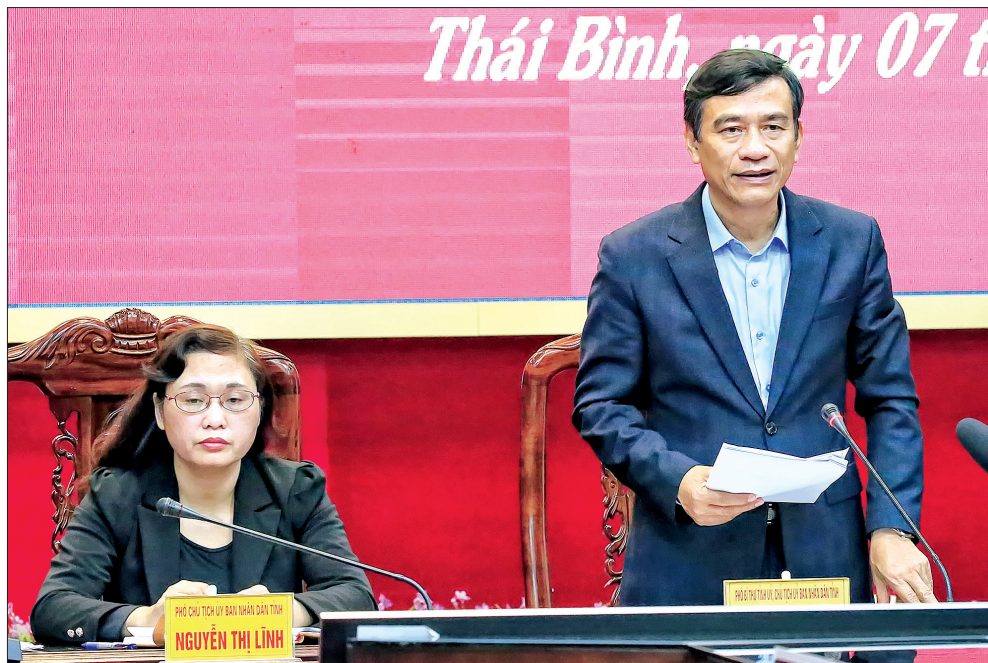
Đồng chí Đặng Trọng Thăng, Phó Bí thư Tỉnh ủy, Chủ tịch UBND tỉnh, Trưởng ban Chỉ đạo của tỉnh phòng, chống dịch Covid-19 phát biểu tại cuộc họp.

Chiều ngày 7/3, Ban Chỉ đạo của tỉnh phòng, chống dịch bệnh viêm đường hô hấp cấp do chủng mới của virus corona (Covid-19) họp triển khai nhiệm vụ trước những diễn biến mới của dịch Covid-19 tại Việt Nam. Đồng chí Đặng Trọng Thăng, Phó Bí thư Tỉnh ủy, Chủ tịch UBND tỉnh, Trưởng ban Chỉ đạo chủ trì cuộc họp. Dự họp có các đồng chí Ủy viên Ban Thường vụ Tỉnh ủy; lãnh đạo HĐND, UBND tỉnh; trưởng các đoàn kiểm tra phòng, chống dịch của tỉnh; thành viên Ban Chỉ đạo của tỉnh; lãnh đạo các sở, ngành, đơn vị, huyện, thành phố.