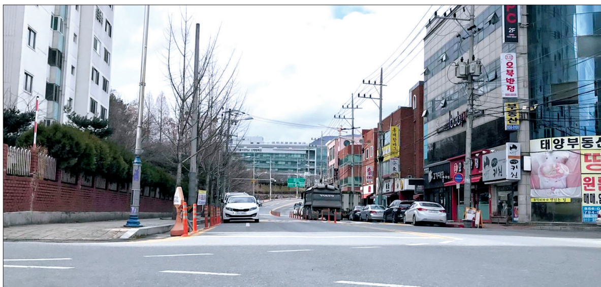
Đường phố Daegu vắng vẻ từ khi có dịch Covid-19.

Tỉnh Daegu là một trong hai tâm điểm của dịch Covid-19 tại Hàn Quốc. Sự gia tăng số người nhiễm mới khiến nhiều người Việt Nam đang học tập, lao động tại Daegu lo lắng, băn khoăn không biết về hay ở lại, trong đó có nhiều du học sinh, người lao động quê Thái Bình.