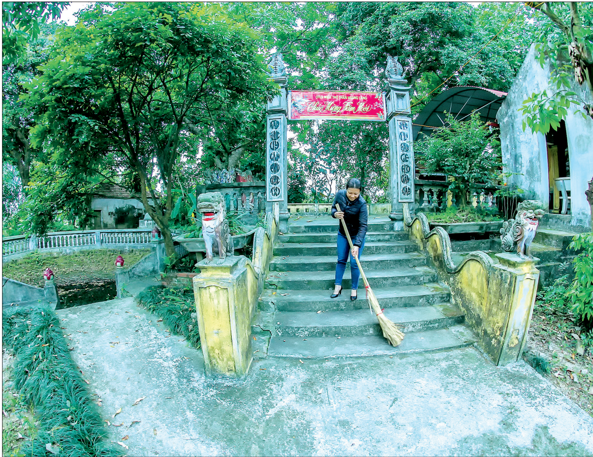
Miếu Mễ, Mỹ Xá, thị trấn Hưng Nhân - nơi thờ Hưng Nhân Đại Vương Phùng Tá Chu.