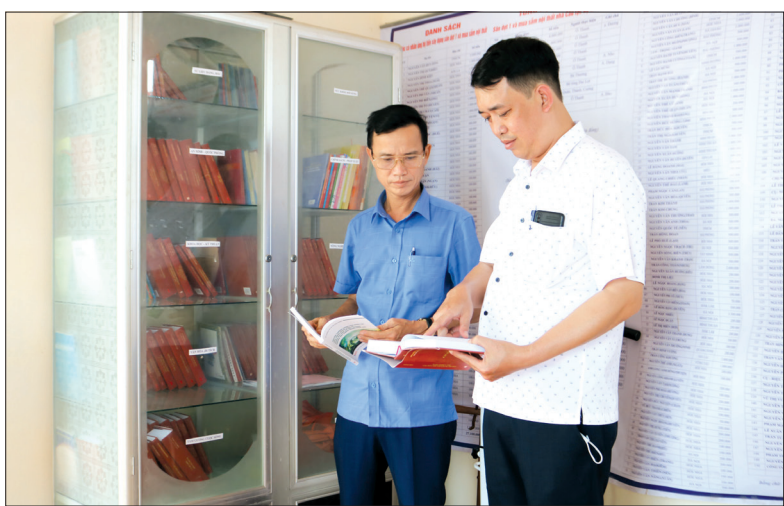
Góc học tập cộng đồng của nhân dân thôn Hòe Nha.

Giữ vững danh hiệu thôn văn hóa, những năm qua, nhân dân thôn Hòe Nha, xã Thụy Chính (Thái Thụy) luôn đoàn kết giúp nhau phát triển kinh tế, thực hiện tốt các cuộc vận động, phong trào thi đua, nhất là phong trào “Toàn dân đoàn kết xây dựng đời sống văn hóa”.