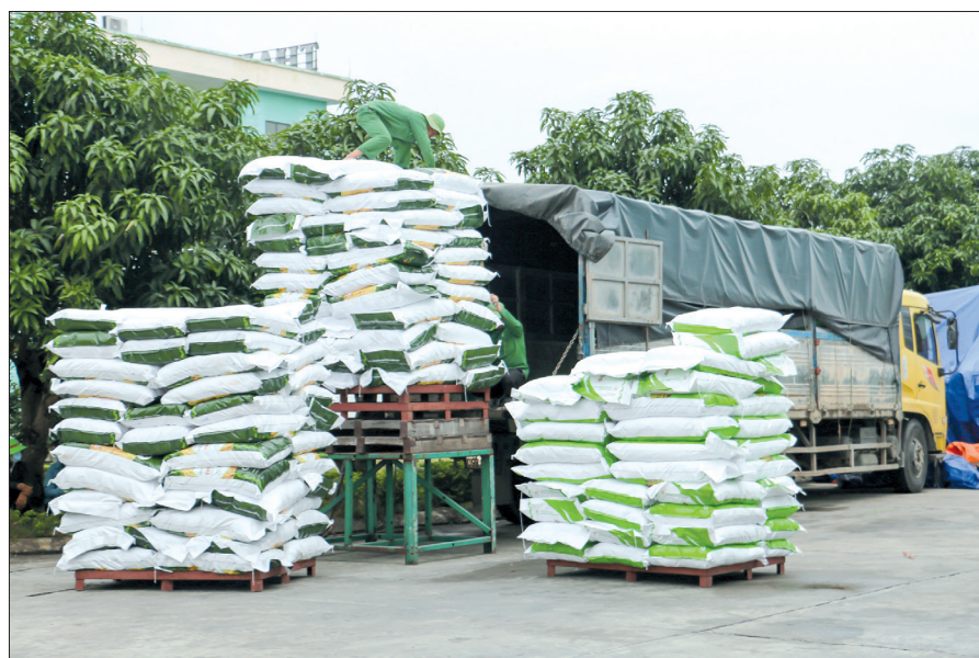
Xuất giống của Thai Binh Seed tới các chi nhánh, đại lý.

Thái Xuyên 111, Phúc Thái 168... đây đều các giống lúa có sản lượng tiêu thụ lớn trên thị trường. Hệ thống phân phối của Thai Binh Seed gồm trên 200 đại lý cấp I, hàng nghìn đại lý cấp II,