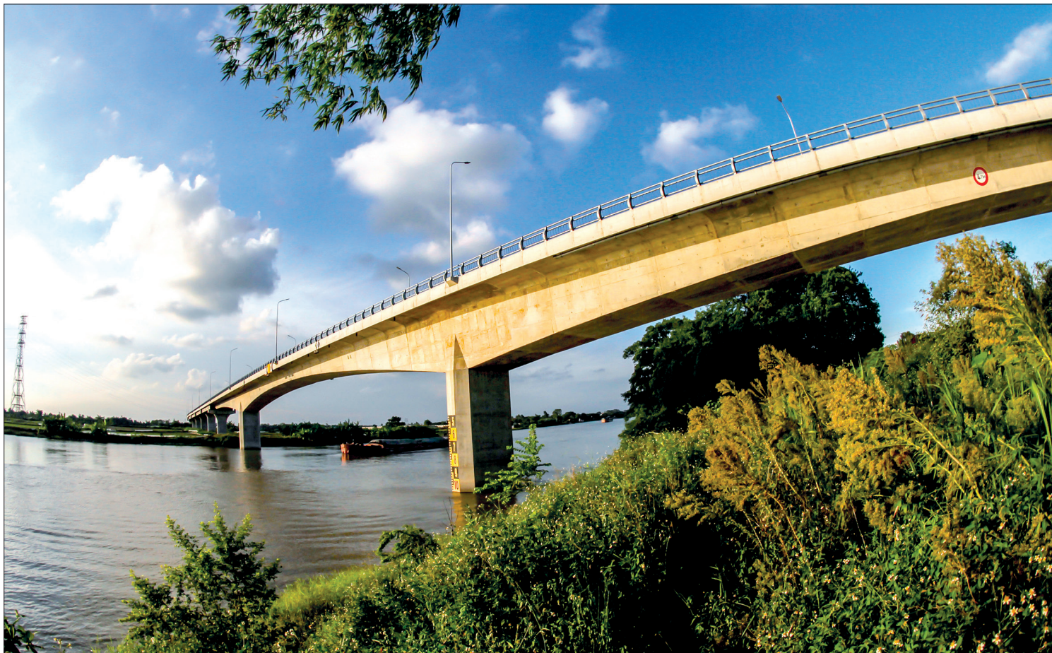
Bến đò La Tiến (nay là cầu La Tiến, địa phận xã Điệp Nông, huyện Hưng Hà) thời nhà Trần là sông Cửu Khúc, điểm tiếp nối huyết mạch phòng tuyến quân sự nhà Trần trên sông Luộc.

Trong cuộc kháng chiến chống giặc Nguyên Mông đầy cam go, khốc liệt, Yết Kiêu đã từng nhận lệnh của Hưng Đạo Vương đưa đội thủy quân lừng danh dưới trướng về “náu” ở ngã ba Nông (nay thuộc xã Tân Lễ, huyện Hưng Hà), đóng quân ở các bến bãi sông Cửu Khúc (đoạn sông Luộc chảy qua địa phận xã Điệp Nông, huyện Hưng Hà và xã Quỳnh Hoàng, huyện Quỳnh Phụ) để làm quân “thanh viện”, đồng thời chặn đánh quân tiếp viện của giặc Nguyên Mông.