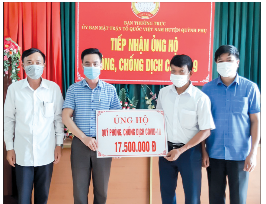
Mặt trận Tổ quốc huyện Quỳnh Phụ tiếp nhận kinh phí từ các đơn vị, cá nhân ủng hộ công tác phòng, chống dịch.

Với nhiều hoạt động thiết thực, ý nghĩa, cùng với tinh thần đoàn kết, trách nhiệm, sự sẻ chia của cả cộng đồng, MTTQ các cấp trên địa bàn huyện Quỳnh Phụ đã và đang góp phần tạo nên sức mạnh tổng hợp để các cấp, các ngành và nhân dân trong huyện có thêm động lực, quyết tâm chiến thắng dịch Covid-19.