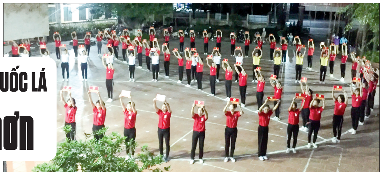
Đồng diễn thể thao không khói thuốc lá tại xã An Đông (Quỳnh Phụ).