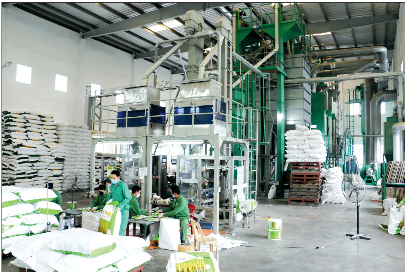
Vụ xuân năm 2022, Thai Binh Seed chuẩn bị trên 10.000 tấn lúa giống cung cấp ra thị trường.

Thời điểm này, nông dân các địa phương đang chuẩn bị các loại vật tư phục vụ sản xuất vụ xuân năm 2022. Nhằm đáp ứng nhu cầu của nông dân, Công ty Cổ phần Tập đoàn Thai Binh Seed (Thai Binh Seed) đã và đang triển khai cung ứng đầy đủ, kịp thời các loại giống lúa bảo đảm chất lượng.