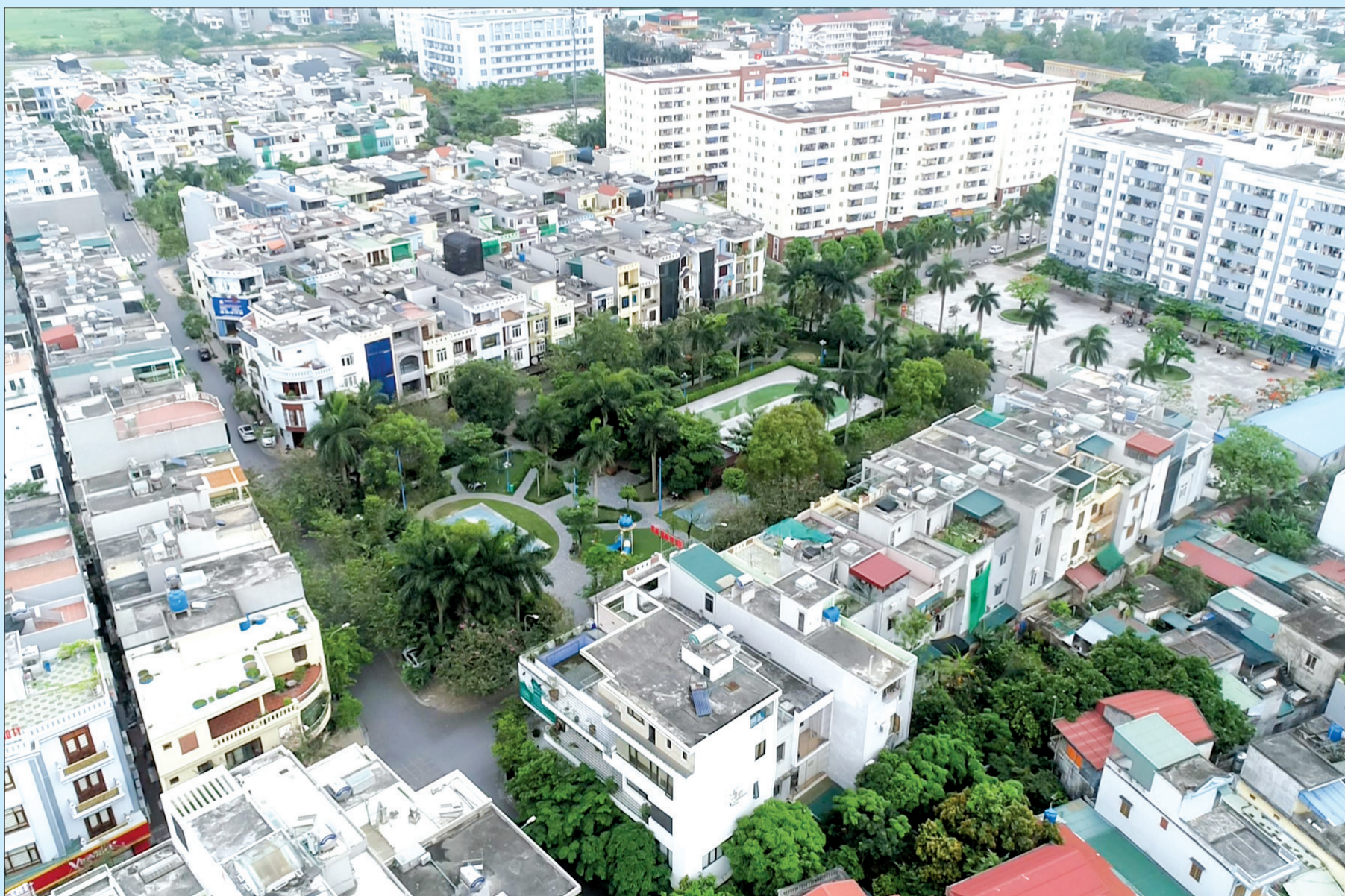
Không gian xanh trong lòng thành phố.