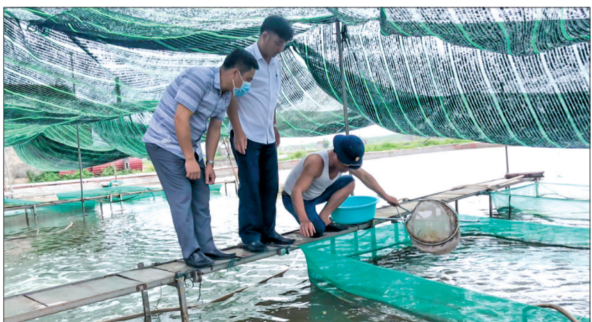
Cán bộ Chi cục Chăn nuôi và Thú y kiểm tra, lấy mẫu giám sát bệnh đốm trắng trên tôm tại xã Thụy Hải (Thái Thụy). Ảnh tư liệu

Sáng ngày 27/3, tại Tiến Hải, Sở Nông nghiệp và Phát triển nông thôn tổ chức hội nghị tổng kết công tác phòng, chống dịch bệnh động vật thủy sản năm 2022, triển khai nhiệm vụ năm 2023.