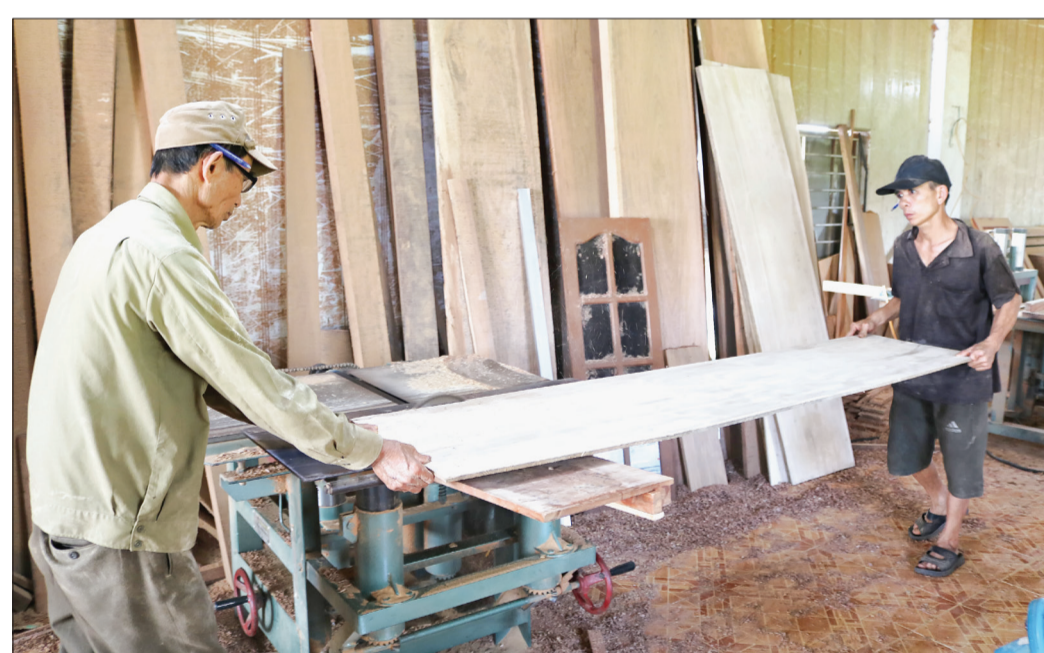
Sản xuất đồ gỗ mỹ nghệ và dân dụng phát triển mạnh tại xã Thụy Duyên (Thái Thụy).

tự nguyện ủng hộ hơn 15 tỷ đồng và hàng nghìn ngày công lao động để xây dựng kết cấu hạ tầng nông thôn, các công trình thiết chế văn hóa cộng đồng làm cho diện mạo nông thôn khởi sắc. Sự đi lên về kinh tế và đổi thay trong đời sống của nhân dân thời gian qua cũng sẽ là tiền đề thuận lợi để Thụy Duyên phấn đấu đạt xã nông thôn mới nâng cao vào năm 2022 và đạt xã nông thôn mới kiểu mẫu vào năm 2025 như Nghị quyết Đại hội Đảng bộ xã nhiệm kỳ 2020 - 2025 đề ra.