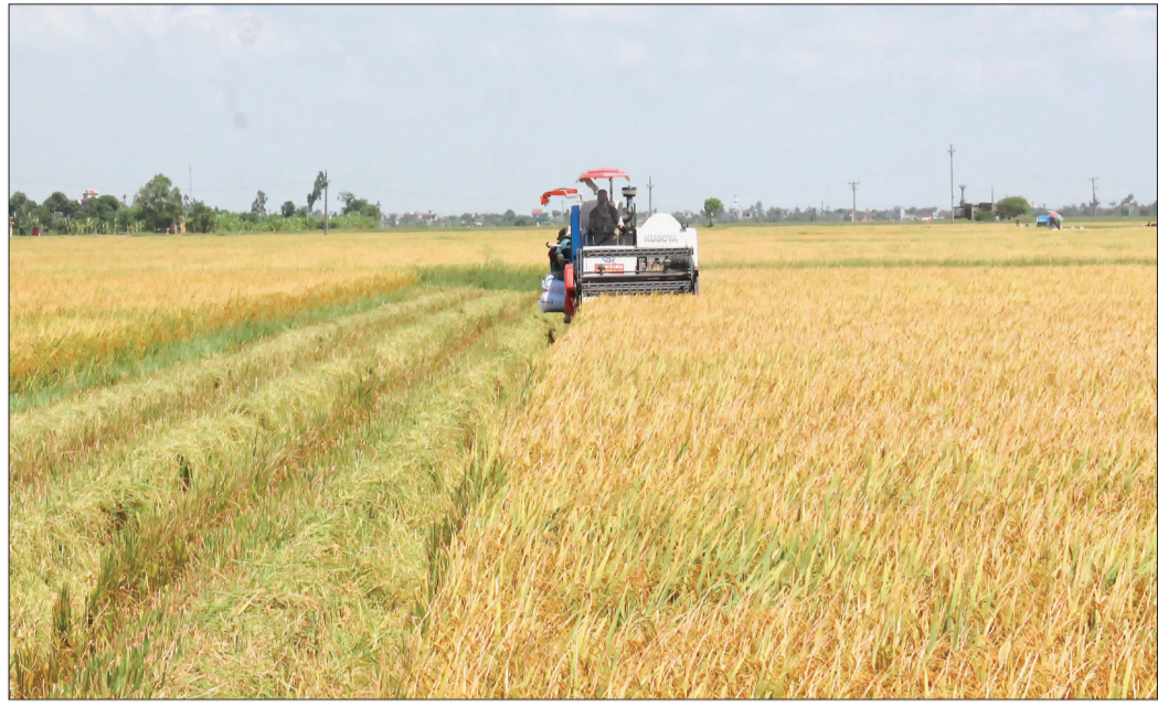
Nông dân thị trấn Tiên Hải tập trung thu hoạch lúa xuân.