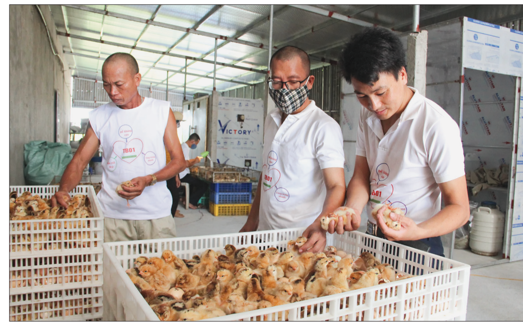
Trung bình mỗi tháng HTX Chăn nuôi xanh Thái Bình cung cấp ra thị trường 4 vạn con giống gia cầm, thủy cầm.

trách nhiệm tới cùng về sản phẩm của mình, chúng tôi hướng tới mục tiêu lâu dài: xây dựng và hình thành chuỗi liên kết khép kín, bền vững trong chăn nuôi. Dự định của HTX thời gian tới sẽ xây dựng các điểm bán hàng, cơ sở giết mổ tập trung bởi giết mổ gia súc, gia cầm tập trung có một ý nghĩa rất quan trọng trong công tác phòng, chống dịch bệnh, không những bảo vệ, giữ vững tổng đàn chăn nuôi tại địa phương mà còn bảo vệ tinh mạng và sức khỏe con người. NGÂN HUỖN