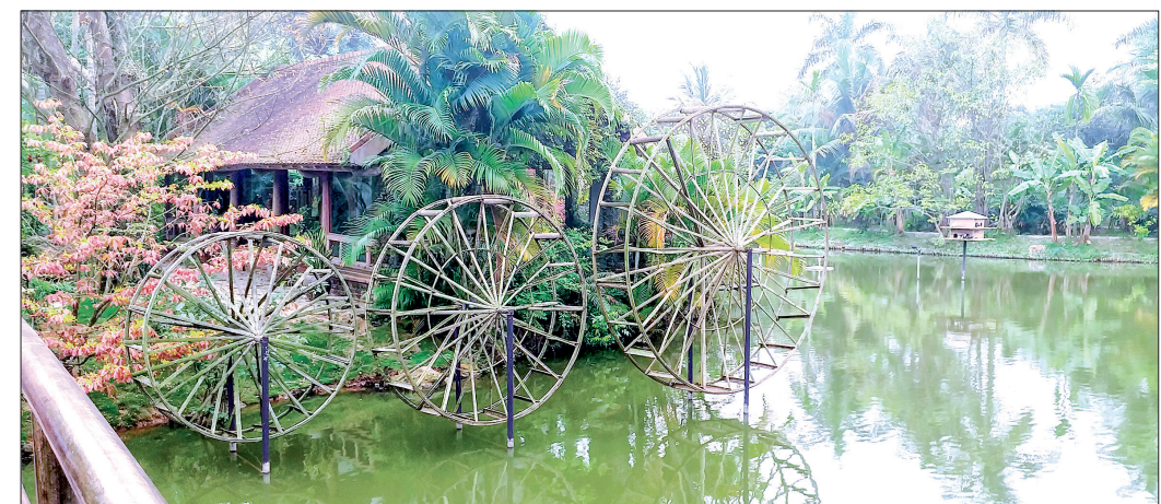
Một góc hồ nước điều hòa môi trường ở nhà máy MXP 1.