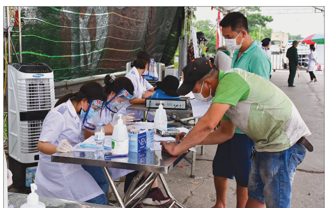
Sinh viên Trường Đại học Y Dược Thái Bình hướng dẫn người dân khai báo y tế tại chốt kiểm soát dịch cầu Tân Đệ (Vũ Thư).