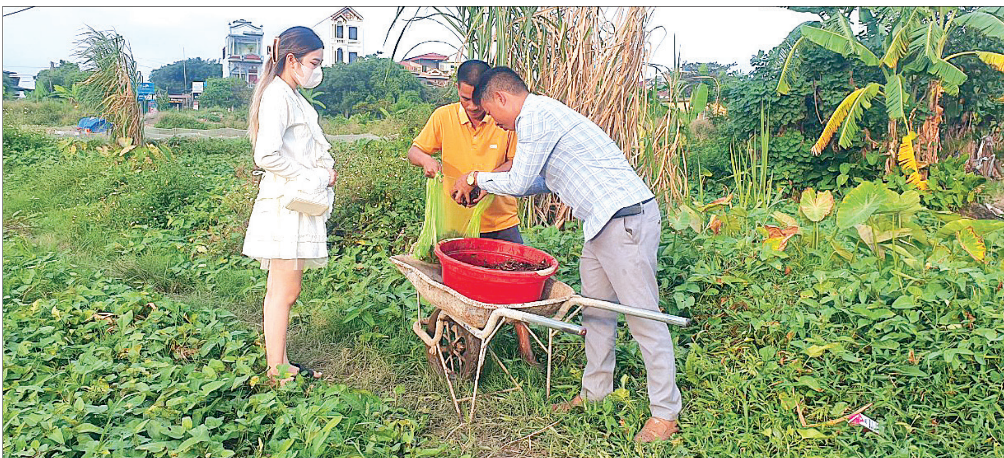
Ấu thu hoạch đến đâu khách đến tận ruộng mua đến đó.