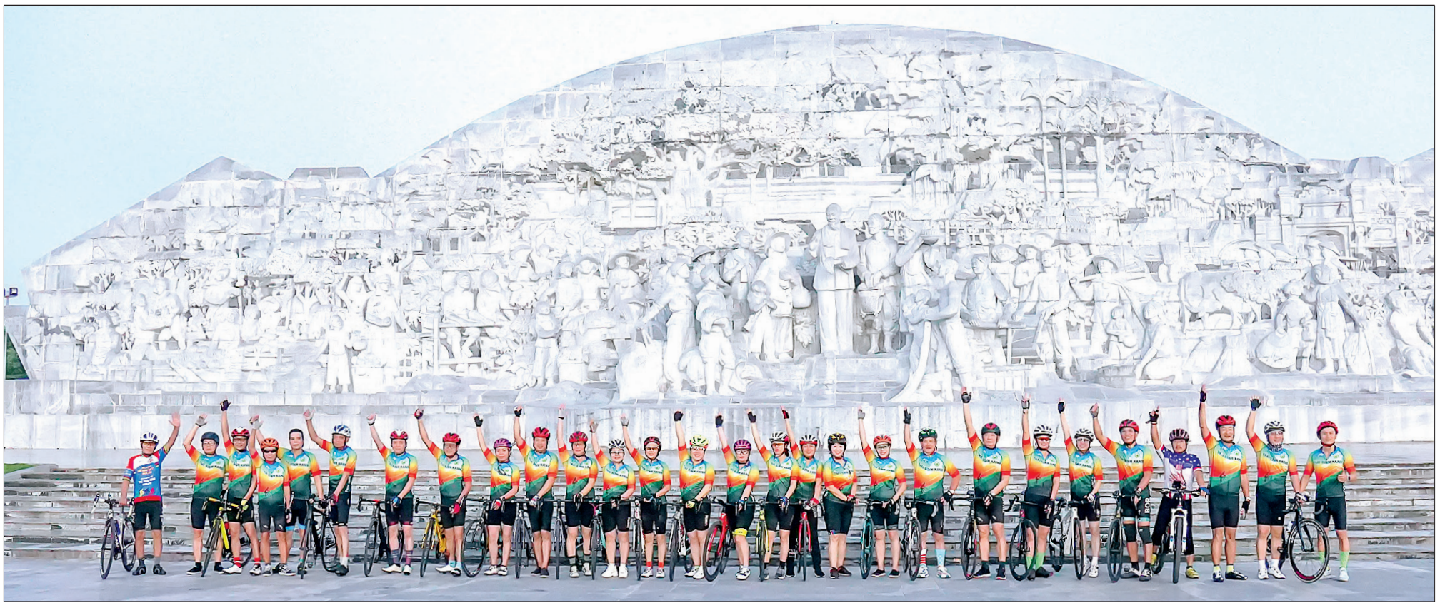
Địa điểm tập luyện của câu lạc bộ xe đạp Thái Bình xanh là Quảng trường Thái Bình và các tuyến đường xung quanh.