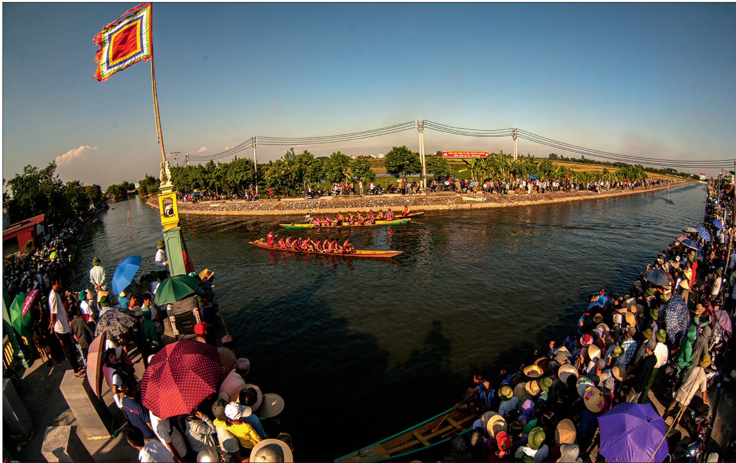
Làng Lại Trì có sông Bơi, con sông nhỏ trong đồng, vào mùa hội bao giờ cũng có bơi chải.

Làng Lại Trì (nay thuộc xã Tây Sơn, huyện Kiến Xương), xưa thuộc huyện Chân Định, trấn Sơn Nam; làng thờ Nam Hải Đại vương Thục An Dương Vương, Quốc sư Dương Không Lộ (triều Lý) và thân mẫu của người làm thành hoàng. Thân mẫu Quốc sư thờ ở chùa Am. Nơi thờ thân mẫu có hình vỏ trấu như một chiếc thuyền, có người bảo là vật dụng của cha mẹ Quốc sư. Ngoài đình, đền, chùa Am xưa làng Lại Trì còn có văn từ (thờ Khổng Tử và tạc bia ghi tên những người đỗ đạt) đàn tư võ, đàn thiên rông... Các thiết chế tín ngưỡng đó đều được xây dựng trên các gò đất cao giữa làng... Xa xưa là những ngôi nhà nhỏ, mái rạ, sau dần được tu bổ khang trang đẹp đẽ, có tường hoa bao quanh, có cây cổ thụ, có hoa viên với hồ sen tươi mát... làm phong cảnh làng đẹp thêm.