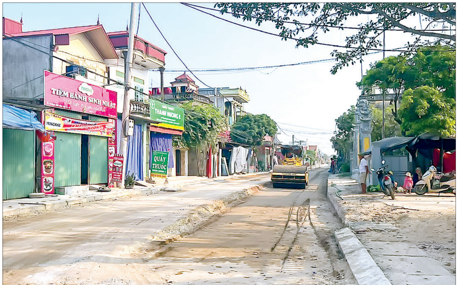
Nhân dân xã Đông Tiến (Quỳnh Phụ) đồng thuận hiến đất để thực hiện dự án cải tạo, nâng cấp đường tỉnh 455.

Những tấm gương điển hình, tiêu biểu trong học tập và làm theo tư tưởng, đạo đức, phong cách Hồ Chí Minh sẽ là những “bông hoa đẹp” tiếp tục được nhân rộng và trở thành phong trào thi đua sâu rộng trong các tầng lớp nhân dân. Thông qua đó tạo động lực mạnh mẽ trong việc huy động sự đóng góp của xã hội và toàn dân xây dựng quê hương ngày càng giàu đẹp, văn minh.