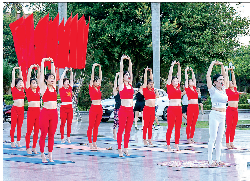
Câu lạc bộ yoga tập luyện tại Quảng trường 14/10.

Theo thống kê của Sở Văn hóa, Thể thao và Du lịch, trên địa bàn tỉnh hiện có khoảng 36% số người dân tham gia tập luyện thể thao thường xuyên. Góp phần không nhỏ vào con số ấy chắc chắn có những người đang hàng ngày phát huy hiệu quả địa điểm tập luyện tại nơi công cộng. Với tinh thần hăng say tập luyện, mỗi người dân không chỉ thiết thực nâng cao sức khỏe thể chất và tinh thần của bản thân mình mà còn góp phần thực hiện cuộc vận động "Toàn dân rèn luyện thân thể theo gương Bác Hồ vĩ đại".