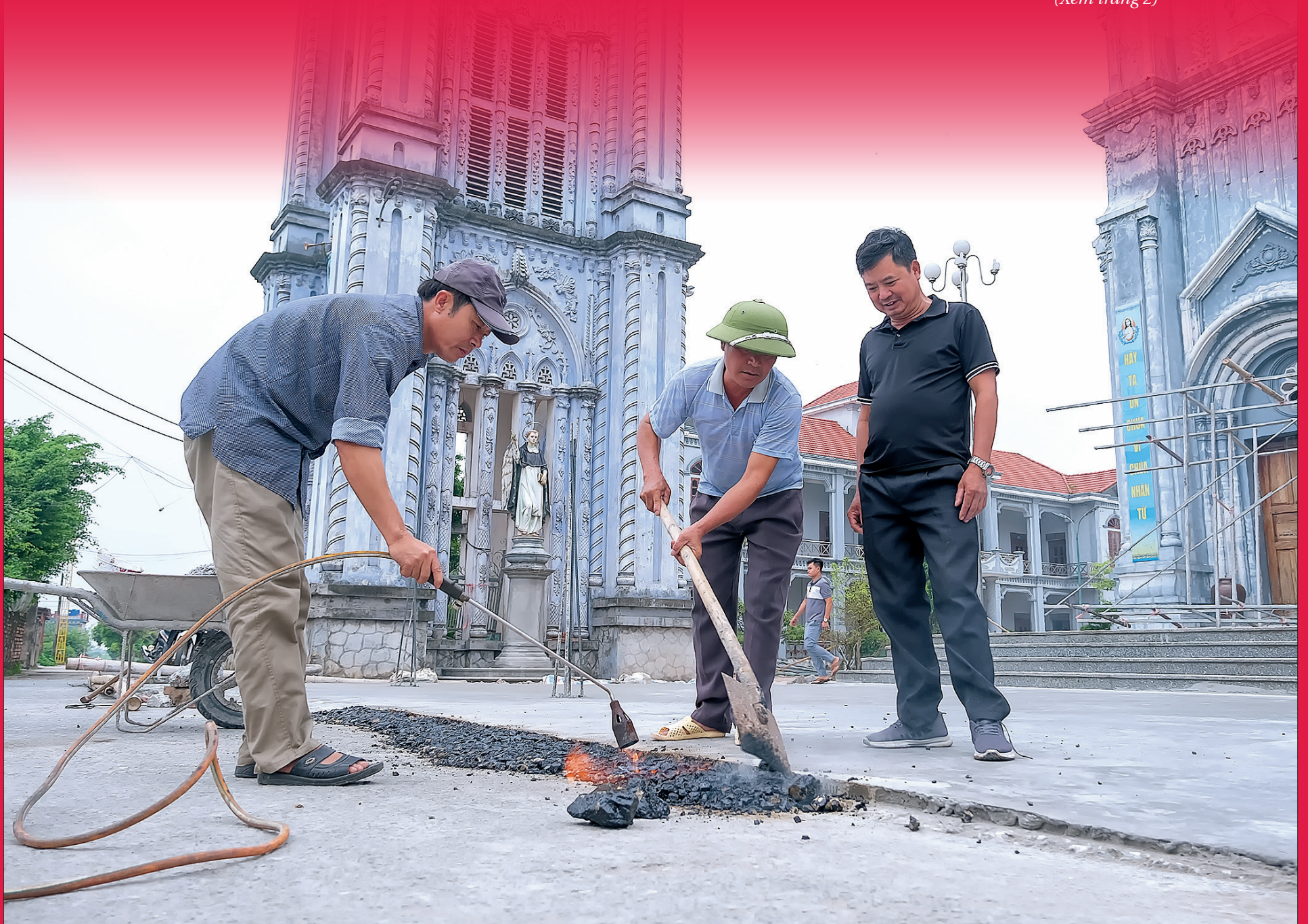
Giáo dân thôn Quan Cao, xã Vân Trường (Tiên Hải) tích cực tham gia mở rộng đường giao thông.