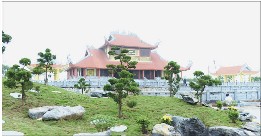
Đền thờ Chủ tịch Hồ Chí Minh được xây dựng tại quần thể di tích lịch sử văn hóa tâm linh xã Đông Lâm (Tiền Hải).

Trong những ngày tháng 3 này, cùng với nhân dân trong tỉnh hướng về kỷ niệm 60 năm ngày Bác Hồ về thăm Thái Bình lần thứ tư (26/3/1962 - 26/3/2022), người dân xã Đông Lâm (Tiền Hải) tự hào ôn lại sự kiện lịch sử, niềm vinh dự của quê hương khi Bác Hồ về nói chuyện với cán bộ và nhân dân Thái Bình, động viên nhân dân tăng gia sản xuất, xây dựng quê hương. Đối với mỗi người dân Việt Nam, vinh dự lớn nhất là được gặp Bác Hồ dù chỉ một lần trong đời nhưng với bà Phan Thị Chè, xã Đông Lâm thì niềm vui đó như được nhân đôi. Ngày 26/3/1962, Bác Hồ về thăm xã Đông Lâm, bà Chè là 1 trong 14 chiến sĩ thi đua và lao động tiên tiến có thành tích nổi bật trong toàn tỉnh được Bác Hồ tặng Huy hiệu Chiến sĩ thi đua. Nhìn lên bức ảnh Bác Hồ nói chuyện với cán bộ và nhân dân Thái Bình được treo trang trọng tại Đền thờ Chủ tịch Hồ Chí Minh, bà Chè xúc động kể: Ngày 26/3/1962, nhân dân xã Đông Lâm vô cùng vui mừng vì được tận mắt nhìn thấy Bác Hồ, được gặp Bác mà đã từ bao lâu hằng ước mong, chờ đợi. Bác Hồ về với cán bộ và nhân dân thật bình dị, Bác mặc bộ quần áo kaki màu vàng đã phai màu, chân đi dép cao su, gương mặt sáng ngời. Bác ân cần thăm hỏi cán bộ, nhân dân xã Đông Lâm,