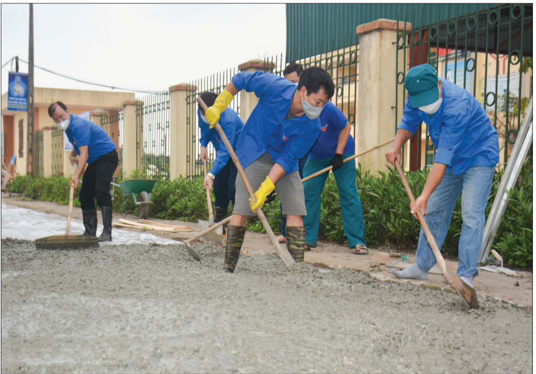
Đoàn viên, thanh niên bê tông hóa vỉa hè trước cổng Trường Tiểu học Vũ Lạc (thành phố Thái Bình).

Tháng 3 này, tuổi trẻ toàn tỉnh đang sôi nổi hưởng ứng tháng thanh niên năm 2022 với những hoạt động, công trình, phần việc cụ thể, thiết thực, phù hợp với từng địa phương, đơn vị và bảo đảm an toàn trước diễn biến của dịch Covid-19.