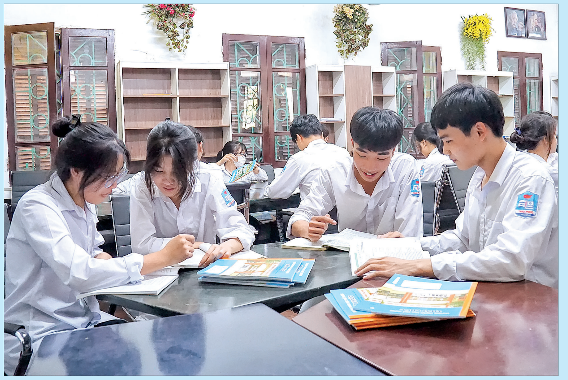
Việc thảo luận nhóm mang đến hiệu quả trong học tập của học sinh Trường THPT Thái Phúc.