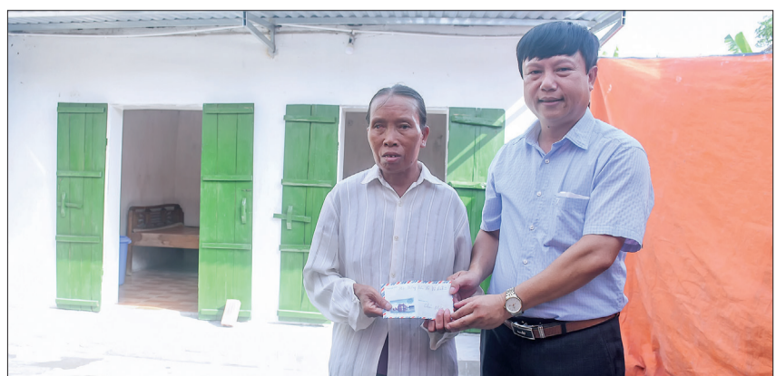
Lãnh đạo xã Vũ Bình (Kiến Xương) trao quà cho hộ nghèo.