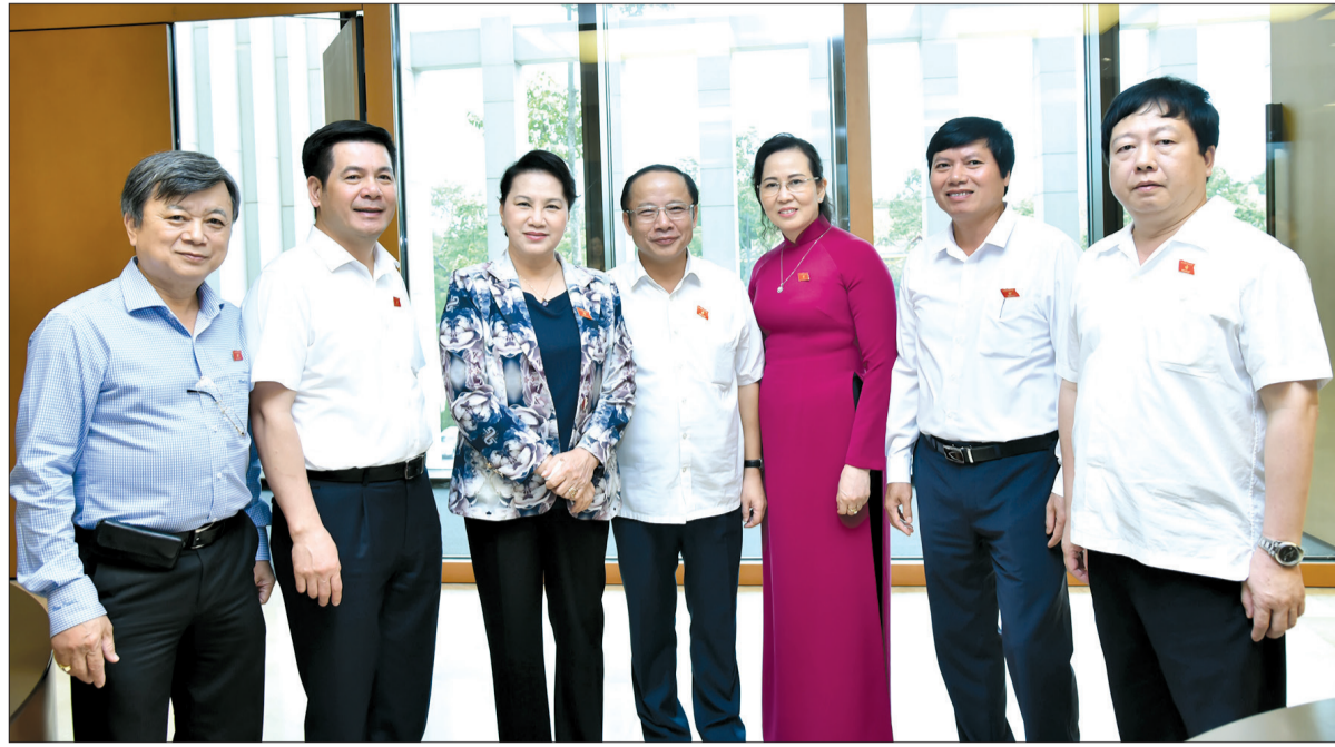
Các đại biểu chụp ảnh lưu niệm bên hành lang Quốc hội.

Nhìn chung, các dự án luật trình Quốc hội cho ý kiến đã được các cơ quan chuẩn bị chu đáo, đầy đủ hồ sơ theo quy định. Các dự đại biểu Quốc hội thảo luận kỹ lưỡng, dân chủ, thẳng thắn, tích cực tranh luận, đưa ra những ý kiến cụ thể về nhiều nội dung mới, còn ý kiến khác nhau của dự án luật. Đây sẽ là cơ sở quan trọng để các cơ quan soạn thảo, cơ quan thẩm tra tiếp tục nghiên cứu chỉnh lý, hoàn thiện dự án bảo đảm yêu cầu chất lượng, có tính khả thi, trình Quốc hội xem xét, thông qua tại kỳ họp sau.