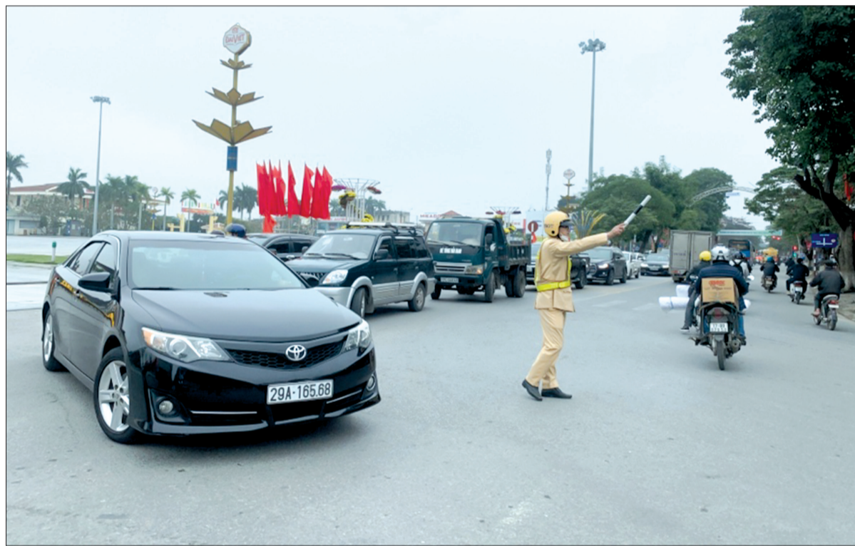
Lực lượng cảnh sát giao thông phân luồng bảo đảm an toàn giao thông dịp tết.

Theo báo cáo của Công an tỉnh, trong 9 ngày nghỉ tết Nguyên đán Nhâm Dần 2022 (từ 29/1 - 6/2), toàn tỉnh xảy ra 1 vụ tai nạn giao thông đường bộ, làm chết 1 người; 1 vụ va chạm giao thông làm bị thương 2 người. Giao thông đường thủy được bảo đảm, không có vụ tai nạn nào xảy ra. Giao thông bảo đảm thông suốt, an toàn trong dịp tết.