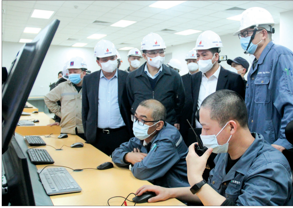
Các đồng chí lãnh đạo Bộ Công Thương và UBND tỉnh thăm phòng điều khiển trung tâm Nhà máy nhiệt điện Thái Bình 2.

nhất thiệt hại cho dự án, phát biểu chỉ đạo tại buổi làm việc, đồng chí Nguyễn Hồng Diễn, Ủy viên Ban Chấp hành Trung ương Đảng, Bộ trưởng Bộ Công Thương yêu cầu PVN chỉ đạo chủ đầu tư, Ban Quản lý dự án tiếp tục bám sát mốc tiến độ tổng thể và mốc tiến độ của từng hạng mục đã đề ra, trong đó không được để thiếu vật tư, thiết bị đối với công tác lắp đặt, chạy thử các hệ thống, đặc biệt là không để thiếu tài chính trong lúc dự án đang vào giai đoạn nước rút để phấn đấu đến ngày 19/5/2022 có thể thực hiện phát điện hòa vào lưới điện quốc gia. PVN chỉ đạo chủ đầu tư, Ban Quản lý dự án xem xét, nghiên cứu giải pháp bù tiến độ, trong đó bố trí thi công làm 3 ca, đồng thời chú trọng chăm lo động viên, hỗ trợ người lao động và cán bộ, công nhân viên trực tiếp thi công xây dựng tại nhà máy, nhất là trong thời gian nghỉ lễ, tết. Chú trọng công tác bảo đảm an toàn trong thi công, lắp đặt, chạy thử và vận hành nhà máy, thường xuyên kiểm tra các công đoạn