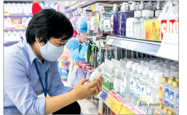
Ảnh minh họa.

Bên cạnh chính sách giảm VAT, Nghị định số 15 cũng cho phép tính khoản chi ủng hộ, tài trợ phòng, chống dịch Covid-19 vào chi phí được trừ khi xác định thuế thu nhập doanh nghiệp năm 2022. Dự kiến ngân sách nhà nước năm 2022 giảm thu 51.400 tỷ đồng, chủ yếu do giảm 49.400 tỷ đồng từ việc hạ VAT, còn lại là phần khấu trừ chi phí tính vào thuế thu nhập doanh nghiệp.