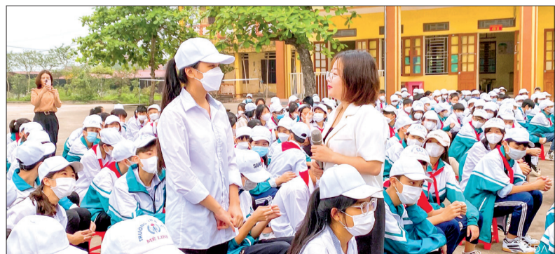
Học sinh Trường Tiểu học và THCS Mê Linh (Đông Hưng) trả lời câu hỏi về chăm sóc sức khỏe vị thành niên.

Sáng ngày 17/4, Trung tâm Y tế huyện Đông Hưng phối hợp với Trường Tiểu học và THCS Phong Châu, Trường Tiểu học và THCS Mê Linh tổ chức truyền thông chăm sóc sức khỏe vị thành niên cho học sinh của 2 trường.