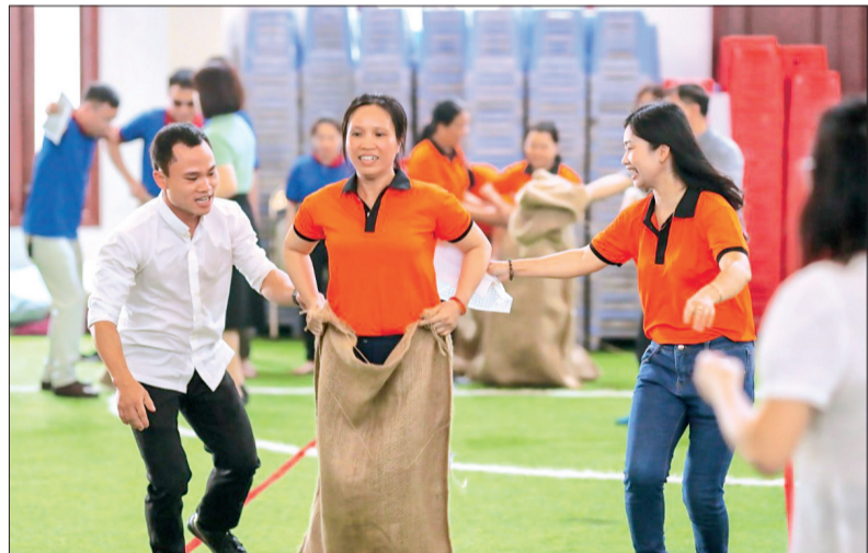
Các vận động viên tham gia thi đấu ở nội dung nhảy bao bố tiếp sức.

Tham gia ngày hội có gần 150 cán bộ, hội viên thuộc Hội Người mù tỉnh và hội người mù 8 huyện, thành phố. Đối với hoạt động thể thao, các vận động viên tranh tài ở 5 môn thi đấu gồm hít xà đơn, chống đẩy, sút bóng vào gôn, kéo co và nhảy bao bố tiếp sức. Đối với hoạt động âm nhạc, cán bộ, hội viên tham gia biểu diễn các tiết mục đơn ca, song ca, song ca, điệu vũ và nhạc cụ dân tộc.