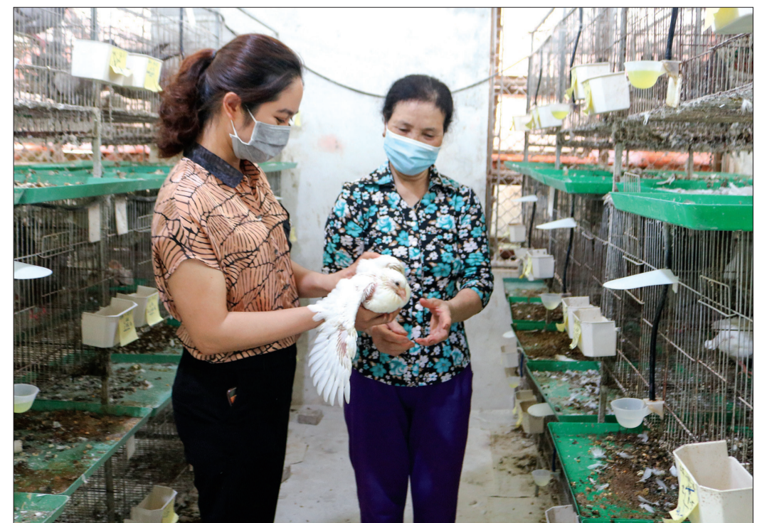
Mô hình nuôi chim bồ câu của hội viên Hội Liên hiệp Phụ nữ xã An Ấp cho hiệu quả kinh tế cao.