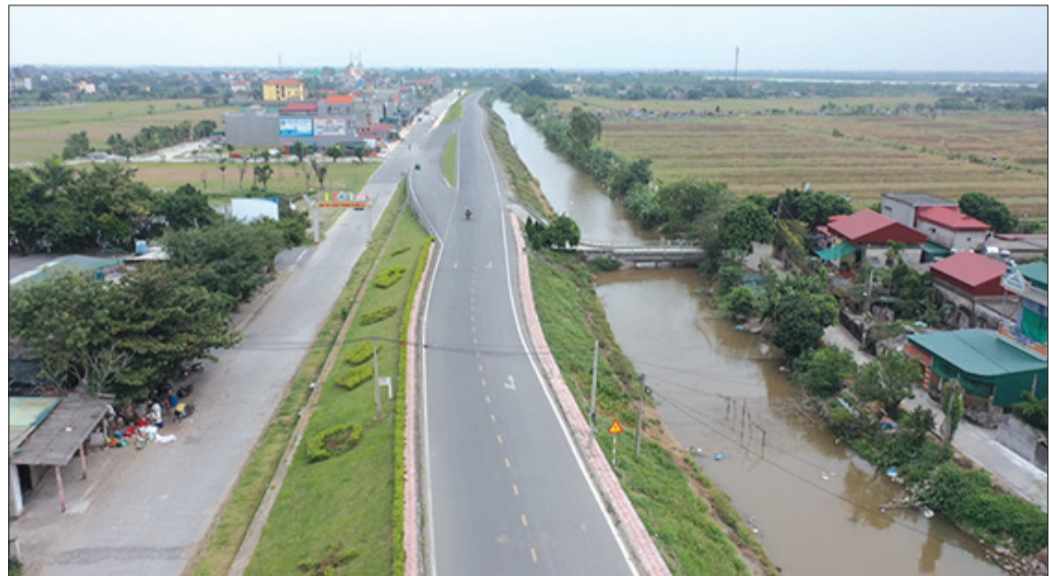
Đoạn đê kiểu mẫu xã Vũ Tiến (Vũ Thư).

Thực hiện phong trào "Xây dựng đê kiểu mẫu" do Bộ Nông nghiệp và Phát triển nông thôn phát động, trên địa bàn tỉnh đã và đang triển khai xây dựng một số tuyến đê, qua đó góp phần giảm thiểu vi phạm pháp luật về đê điều, nâng cao hiệu quả phòng, chống thiên tai.