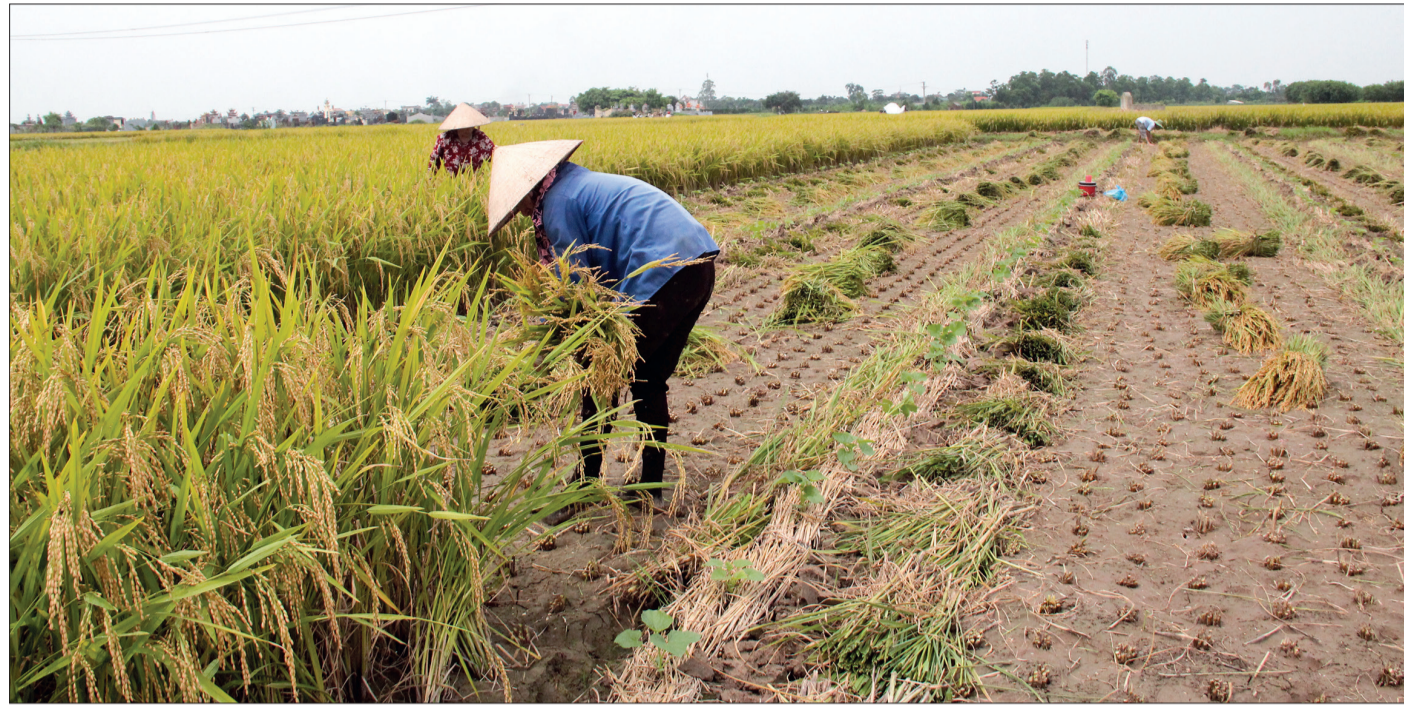
Nông dân xã Tây Đô (Hưng Hà) thu hoạch lúa xuân.

Thời điểm này, khi lúa xuân ở nhiều địa phương đang ở giai đoạn chắc xanh đến đỏ đò thì trên nhiều cánh đồng ở huyện Hưng Hà mùa gặt đã đến.