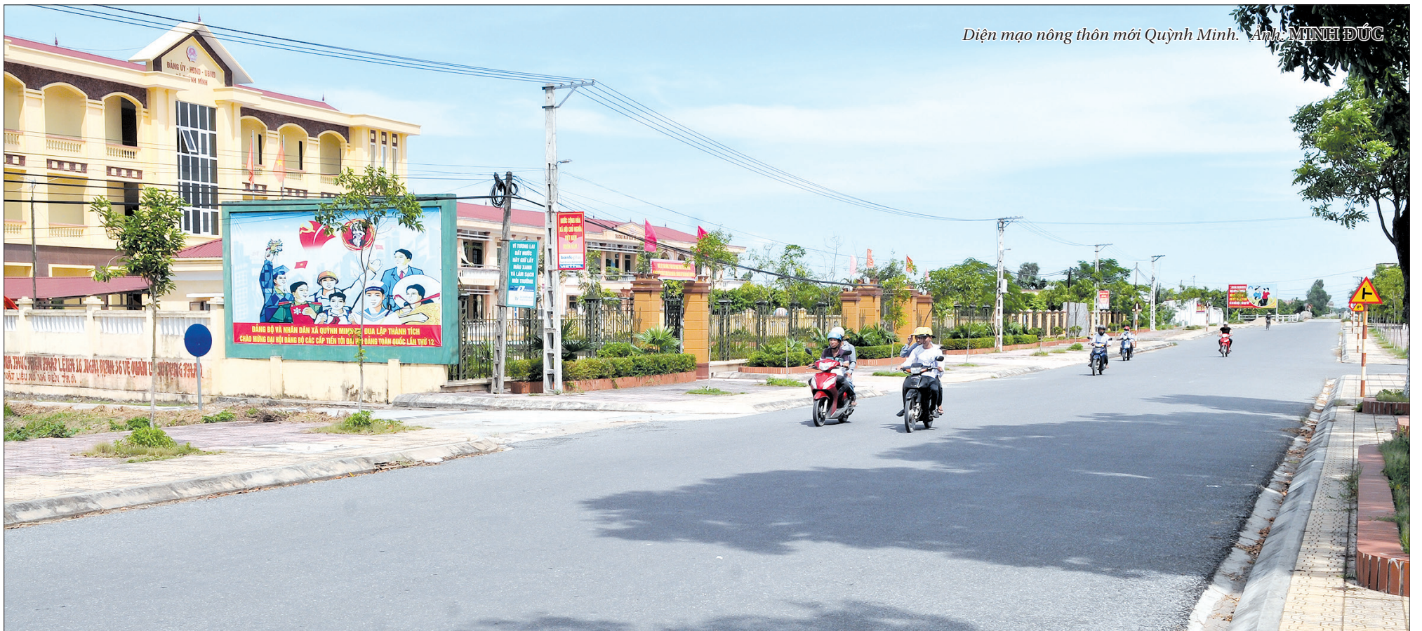
Diện mạo nông thôn mới Quỳnh Minh. Ảnh MINH ĐỨC