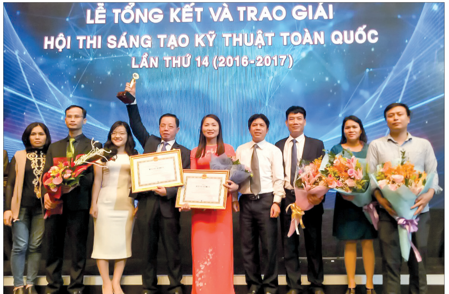
Các tác giả Thái Bình đạt giải tại hội thi sáng tạo kỹ thuật toàn quốc lần thứ 14.

Việt Nam, với sự hội nhập sâu rộng vào nền kinh tế thế giới, đã và đang