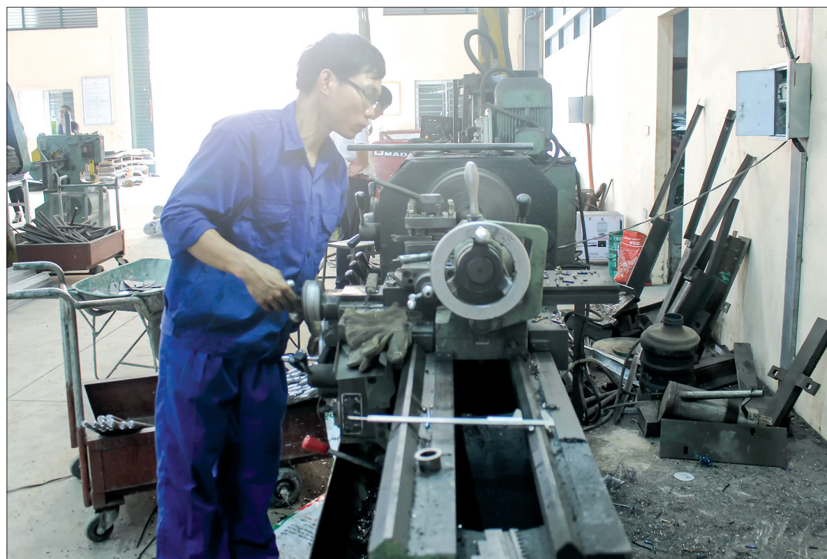
Doanh nghiệp tư nhân điện cơ Thiên Thuận sản xuất các sản phẩm phục vụ nông nghiệp.

Phát triển từ tổ hợp sản xuất nhỏ chuyên sản xuất máy nông cụ, thành công của Doanh nghiệp tư nhân điện cơ Thiên Thuận hôm nay là minh chứng rõ nét về việc mạnh dạn áp dụng thành tựu khoa học công nghệ vào sản xuất, nâng cao chất lượng sản phẩm, tăng sức cạnh tranh trên thị trường.