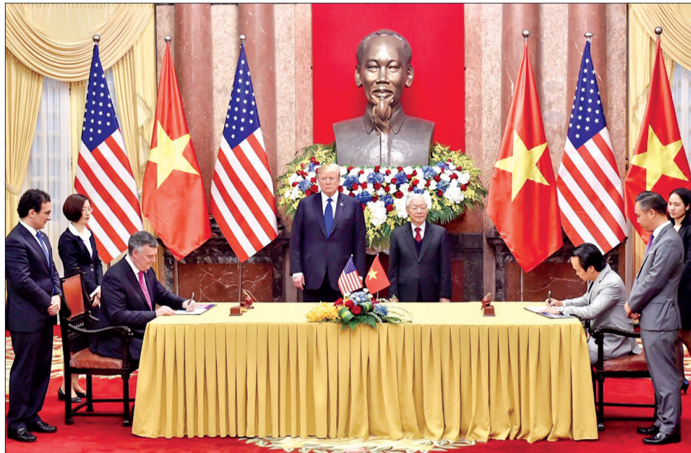
Tổng Bí thư, Chủ tịch nước Nguyễn Phú Trọng và Tổng thống Donald Trump chứng kiến lễ ký các văn bản hợp tác.

Ngày 27/2, tại Phủ Chủ tịch, Tổng Bí thư, Chủ tịch nước Nguyễn Phú Trọng đã hội đàm với Tổng thống Hoa Kỳ Donald Trump đang tham dự Hội nghị Thượng đỉnh Hoa Kỳ - Triều Tiên lần thứ 2 tại Hà Nội từ ngày 27 - 28/2. Tại hội đàm, Tổng Bí thư, Chủ tịch nước Nguyễn Phú Trọng chào mừng Tổng thống Donald Trump và Đoàn đại biểu cấp cao Hoa Kỳ thăm Việt Nam; hoan nghênh Hoa Kỳ và Triều Tiên đã chọn Việt Nam làm địa điểm diễn ra cuộc gặp Thượng đỉnh lần thứ 2. Tổng Bí thư, Chủ tịch nước Nguyễn Phú Trọng khẳng định Việt Nam nhất quán thực hiện đường lối đối ngoại độc lập, tự chủ, đa phương hóa, đa dạng hóa quan hệ đối ngoại, chủ động, tích cực hội nhập quốc tế trên nguyên tắc tôn trọng độc