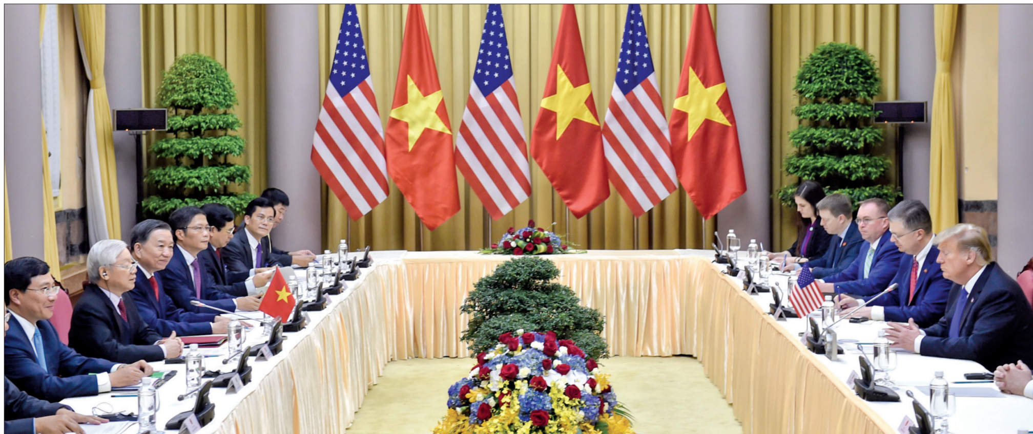
Tổng Bí thư, Chủ tịch nước Nguyễn Phú Trọng hội đàm với Tổng thống Donald Trump.

Hoa Kỳ - Triều Tiên lần thứ hai; khẳng định Hoa Kỳ sẽ tiếp tục đóng vai trò tích cực tại khu vực Ấn Độ - Thái Bình Dương nhằm duy trì trật tự dựa trên luật lệ, thúc đẩy hòa bình, ổn định, hợp tác và phát triển tại khu vực quan trọng này. Nhân dịp này, Tổng thống Donald Trump trân trọng gửi lời mời Tổng Bí thư, Chủ tịch nước Nguyễn Phú Trọng thăm chính thức Hoa Kỳ trong năm nay để cùng tiếp tục trao đổi về những biện pháp làm sâu sắc hơn quan hệ Đối tác toàn diện giữa hai nước. Sau cuộc hội đàm, Tổng Bí thư, Chủ tịch nước Nguyễn Phú Trọng và Tổng thống Donald Trump đã chứng kiến lễ ký một số thỏa thuận hợp tác kinh tế quan trọng, tổng trị giá hơn 21 tỷ USD. (theo chinphu.vn)