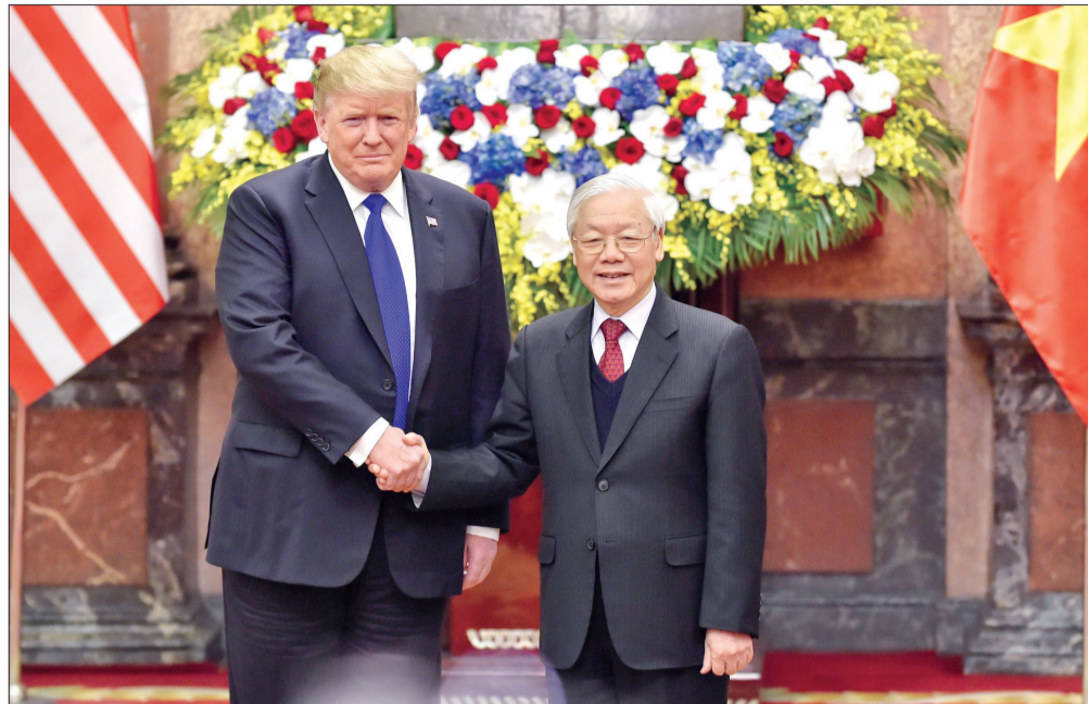
Tổng Bí thư, Chủ tịch nước Nguyễn Phú Trọng tiếp Tổng thống Hoa Kỳ Donald Trump.