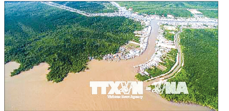
Vườn quốc gia Mũi Cà Mau là điểm cuối cùng của lãnh thổ Việt Nam, nơi du khách có thể ngắm nhìn mặt trời mọc ở biển Đông và lặn ở phía biển Tây.

Nếu được quản lý tốt, du lịch dựa vào thiên nhiên sẽ là một trong những thành phần kinh tế có đóng góp lớn nhất cho nguồn tài chính để duy trì hệ thống các khu vực được bảo tồn tại một số quốc gia. Chỉ tính riêng năm 2016, tổng mức đóng góp của du lịch và lữ hành vào GDP của Việt Nam là 18,4 tỷ USD, chiếm 9,1% tổng GDP trong năm 2016.