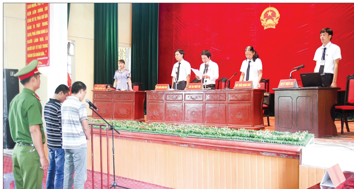
Tòa án nhân dân huyện Quỳnh Phụ xét xử lưu động các đối tượng mua bán, sử dụng trái phép chất ma túy.

Liên tiếp những vụ án ma túy được Công an huyện Thái Thụy triệt phá trong tháng 6 vừa qua cho thấy tình hình tội phạm về ma túy trên địa bàn huyện đang có chiều hướng gia tăng và diễn biến phức tạp. Đặc biệt, các đối tượng nghiện ma túy trên địa bàn đang có xu hướng trẻ hóa và chuyển dần từ các dạng ma túy truyền thống như heroin, thuốc phiện, cần sa... sang sử dụng các loại ma túy tổng hợp, trong đó phổ biến nhất vẫn là ma túy đá. Theo số liệu thống kê của Công an huyện Thái Thụy, hiện nay trên địa bàn huyện có gần 600 đối tượng nghiện có hồ sơ quản