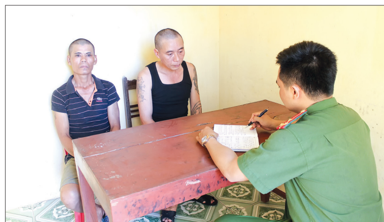
Công an huyện Thái Thụy đấu tranh với đối tượng mua bán, tàng trữ trái phép chất ma túy.

Nhờ thực hiện đồng bộ các biện pháp, trong đợt cao điểm tấn công trấn áp tội phạm ma túy, từ ngày 1 - 27/6, Công an huyện Quỳnh Phụ đã phát hiện,