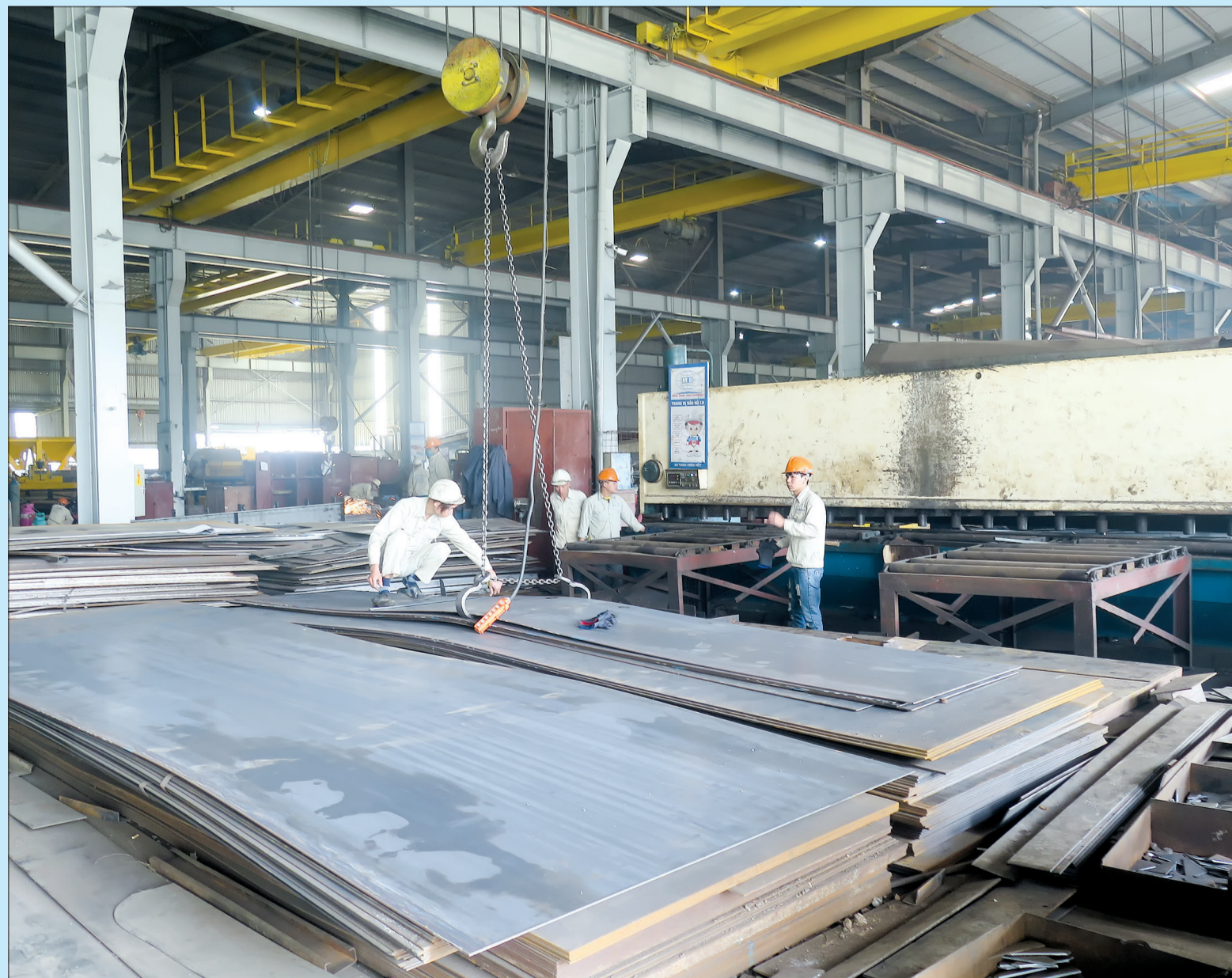
Xưởng sản xuất của Công ty TNHH Cơ khí Minh Danh.