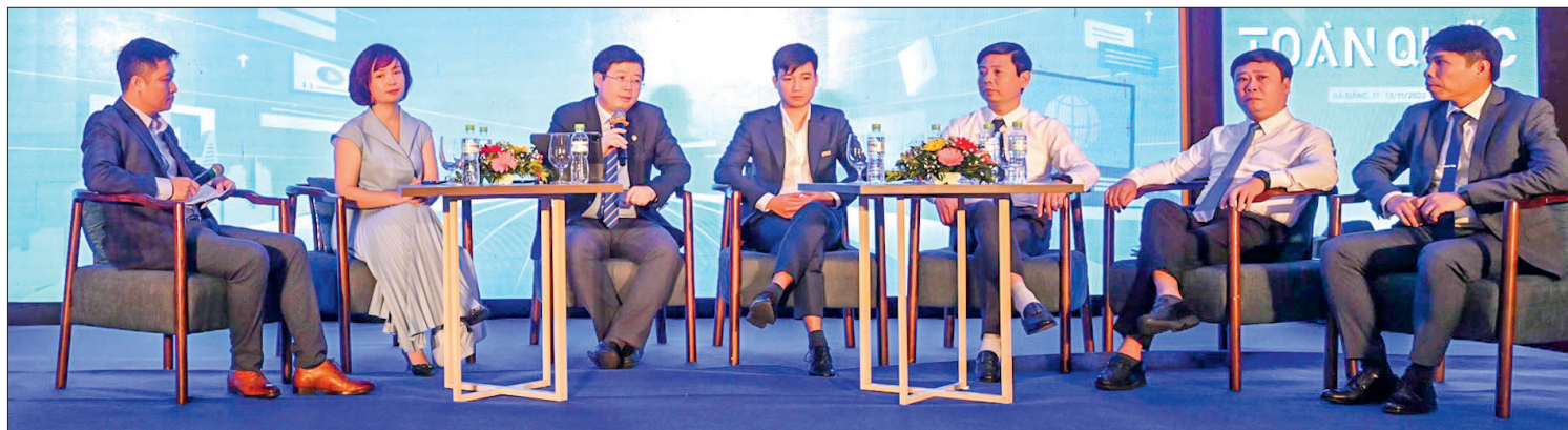
Phiên thảo luận chuyển đổi số và công nghệ làm báo hiện đại.

khó khăn, thách thức; 70 - 80% các cơ quan báo Đảng địa phương đánh giá việc phát triển đa phương tiện, đa nền tảng là khó khăn hoặc rất khó khăn cả về cơ chế, nhân lực, công nghệ và tài chính. Do đó, các cơ quan báo Đảng cần phải giữ vững giá trị cốt lõi của báo chí là tính chuyên nghiệp, phải công bằng, đa chiều, phải thẩm định thông tin, đạt chất lượng cao; phải giữ đạo đức nghề nghiệp, xây dựng môi trường báo chí văn hóa; phải theo kịp những công nghệ truyền thông mới; không ngừng đổi mới sáng tạo; hợp tác trong đưa tin, kiểm chứng thông tin, công nghệ; minh bạch với độc giả và trong chính tòa soạn, có trách nhiệm xã hội.