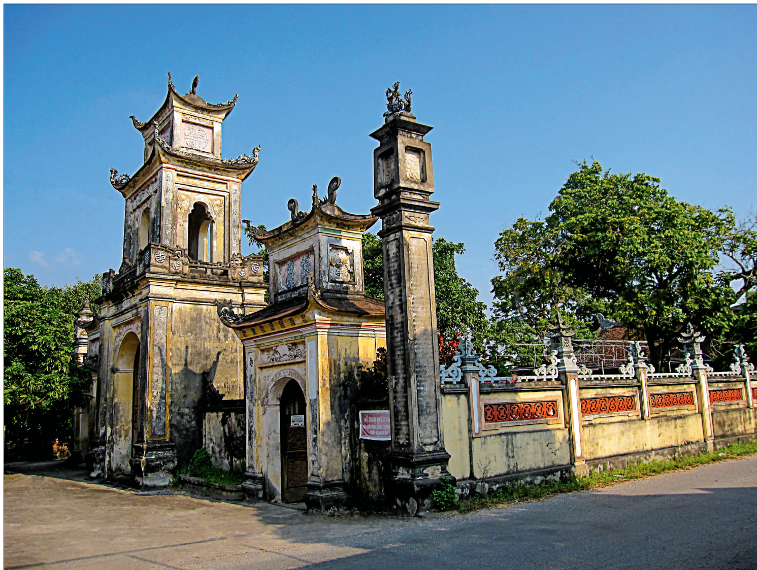
Di tích lịch sử cấp quốc gia đình Lạng, xã Thụy Chính, huyện Thái Thụy, địa danh cổ trên trục phòng tuyến quân sự Tô Đề - Cao Dương, nơi cung cấp lương thảo, quân dụng cho nhà Trần.

Sử sách và dân gian còn lưu truyền rằng: Đại bản doanh của Quốc công tiết chế Hưng Đạo Đại vương có tiền đồn ở làng Lộng Khê (xã An Khê, huyện Quỳnh Phụ) vươn ra đúng nơi gặp gỡ và gặp khúc của hai dòng sông Luộc và sông Hóa. Lui tằm mắt xuống phía Nam A Sào (xã An Thái) là căn cứ thủy bộ Đào Động (xã An Lễ), căn cứ thủy bộ khá quan trọng này được Quốc công tiết chế chọn giao cho tướng quân Phạm Ngũ Lão, vị tướng nổi tiếng quê làng Phù Ủng (Hưng Yên). Dòng sông Hóa là một thủy đạo lợi hại, Quốc công tiết chế cho xây dựng những đồn trại quân, lương dọc hai bờ sông đặc biệt ở làng Tô Đề (xã An Mỹ, huyện Quỳnh Phụ). Phía dưới nữa là làng Cao Dương (Thái Thụy), nơi đây tập trung khá lớn nghệ nhân làm nghề rèn đúc, lập tức được trưng dụng làm nơi rèn binh đao, vũ khí của nhà Trần. Chiến trận không dừng ở Cao Dương (vùng đất làng nghề mà sau này khi đại chiến quân Nguyên Mông, nhà Trần cũng đã sắc phong cho làng “Cao Dương rèn sắt nên công nhất miến” mà còn lan rộng xuống vùng đất thấp ven biển Thái Thụy.