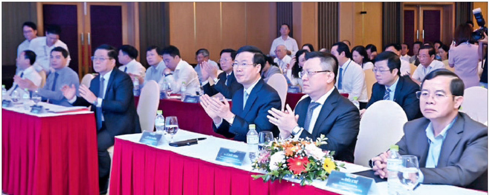
Đồng chí Võ Văn Thường, Ủy viên Bộ Chính trị, Thường trực Ban Bí thư cùng các đại biểu dự hội nghị.