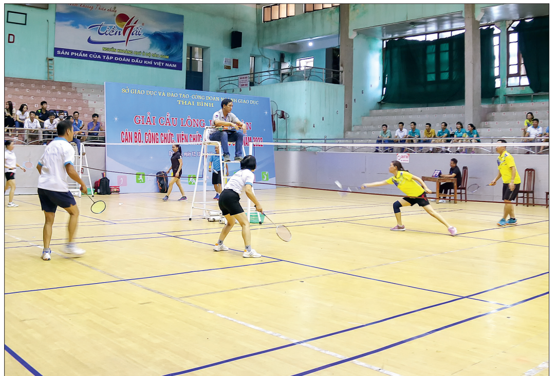
Các trận thi đấu cầu lông diễn ra kịch tính.