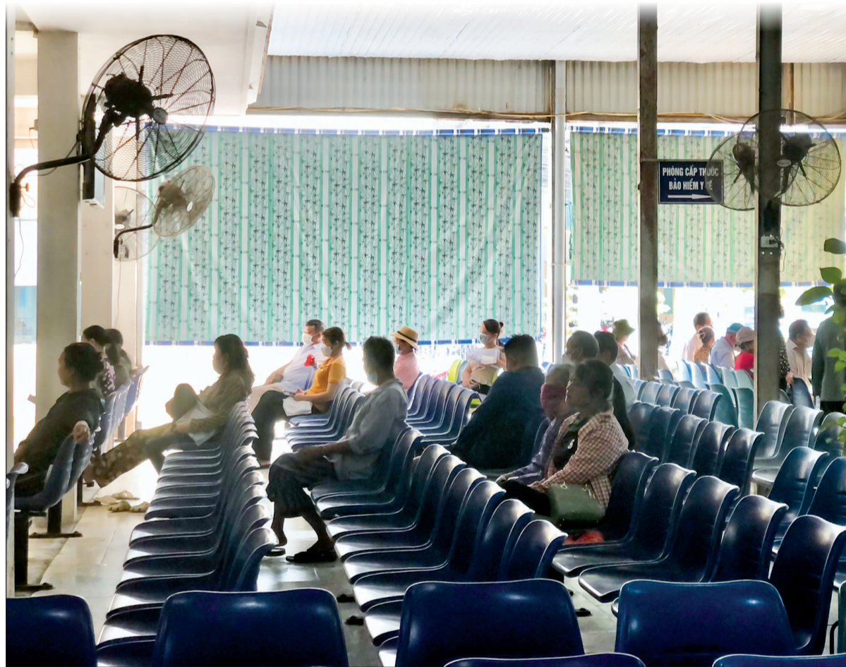
Bệnh viện Đa khoa Tiên Hải lắp đặt rèm che nắng, quạt tại khu vực chờ khám.

Nắng nóng còn tiếp diễn và sẽ xuất hiện những đợt cao điểm, người dân, nhất là người cao tuổi, người có bệnh nền cần tuân thủ khuyến cáo của ngành y tế để bảo đảm sức khỏe, tránh bị say nắng, say nóng, đợt quỵ.