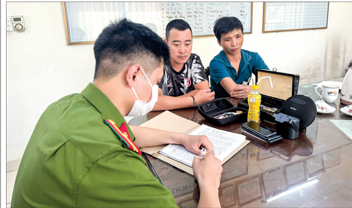
Công an huyện Thái Thụy đấu tranh với tội phạm ma túy.