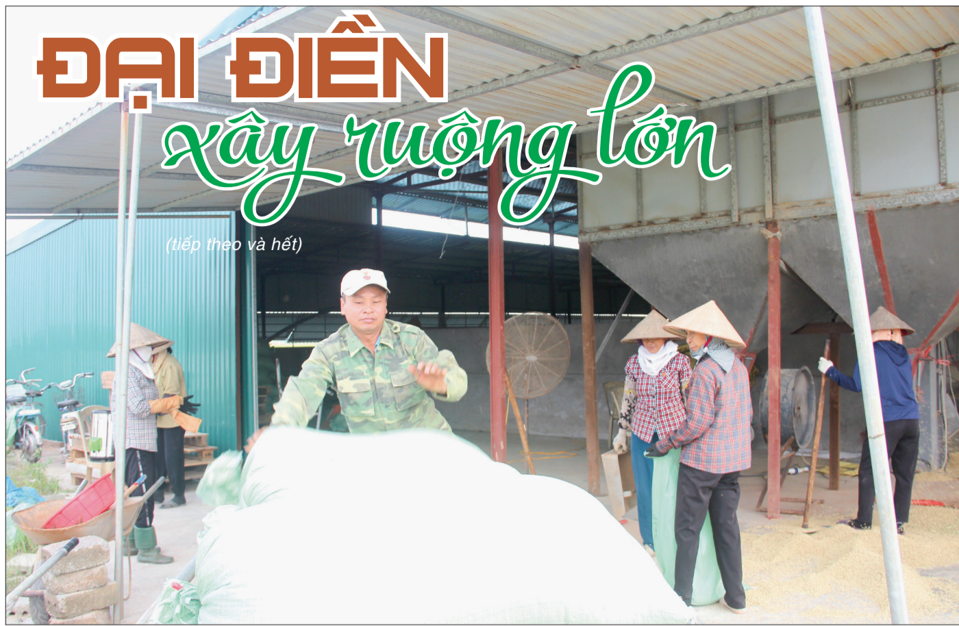
Nghị quyết số 08/2023/NQ-HĐND hỗ trợ các tổ chức, cá nhân tích tụ, tập trung đất đai được chuyển mục đích sử dụng đất để làm khu mạ khay, khu đặt máy sấy, công trình phục vụ mục đích trồng lúa.