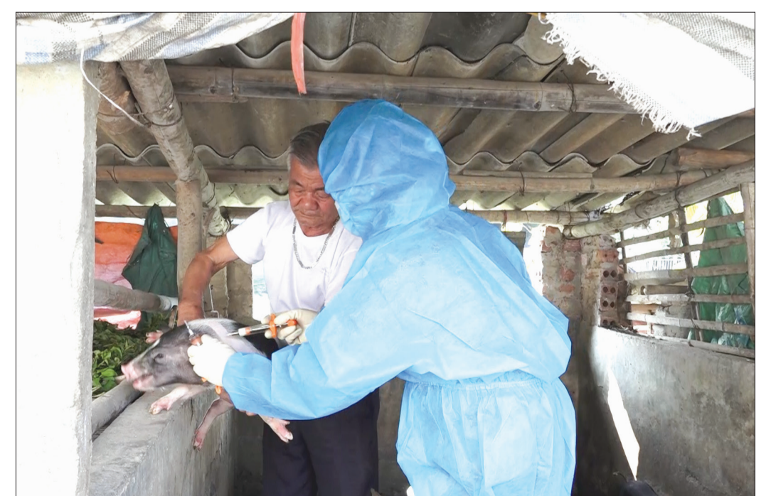
Các hộ dân huyện Quỳnh Phụ thực hiện tốt việc tiêm vắc-xin phòng, chống dịch bệnh cho gia súc, gia cầm.