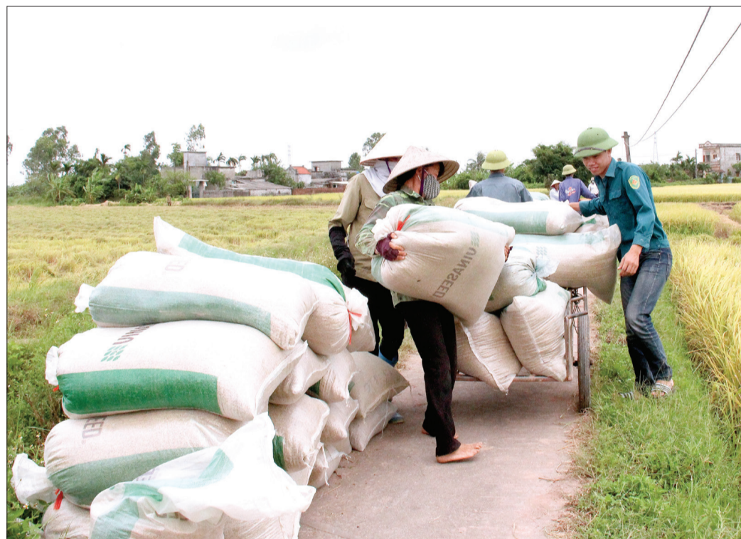
Liên kết sản xuất lúa giống tại xã Thái Thọ (Thái Thụy).

tỉnh lần thứ XX: “Phát triển nông nghiệp bền vững theo hướng nông nghiệp hữu cơ, ứng dụng công nghệ sinh học, sản xuất hàng hóa có