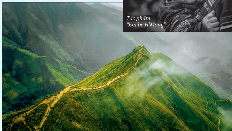
Tác phẩm “Sống lưng khủng long Tà Xùa”.