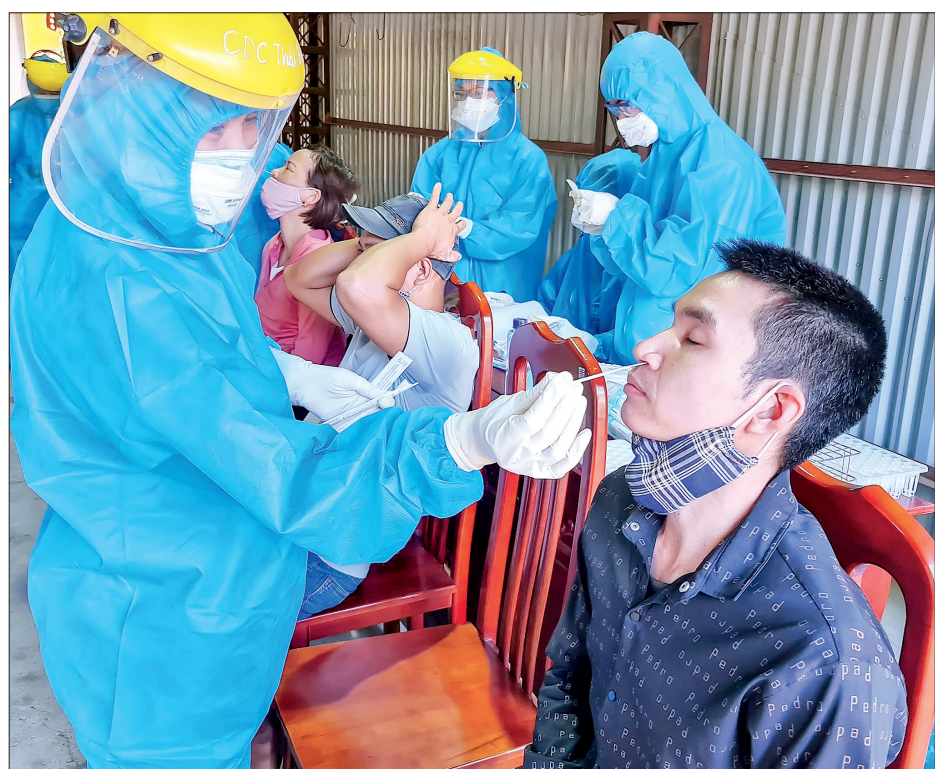
Cán bộ chuyên môn của CDC tỉnh lấy mẫu xét nghiệm sàng lọc SARS-CoV-2 cho công nhân làm việc tại khu công nghiệp Nguyễn Đức Cảnh và khu công nghiệp Phúc Khánh.

* Sáng ngày 19/6, Ban Quản lý Khu kinh tế và các khu công nghiệp tỉnh phối hợp với Trung tâm Kiểm soát bệnh tật tỉnh tổ chức lấy mẫu xét nghiệm sàng lọc SARS-CoV-2 cho 500 công nhân của 31 doanh nghiệp trong các khu công nghiệp: Nguyễn Đức Cảnh, Phúc Khánh (thành phố Thái Bình).