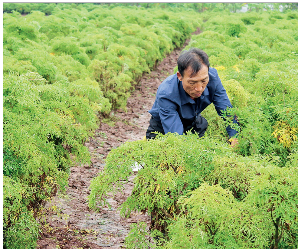
Mô hình trồng cây dược liệu của nông dân xã Nam Hồng (Tiên Hải).