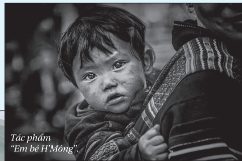
Tác phẩm “Em bé H’Mông”.

nào cũng vậy, đứa trẻ nào cũng vậy nhưng thực tế ấy vẫn khiến người lớn chạnh lòng.