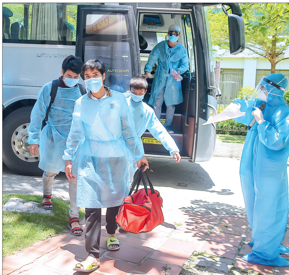
Tiếp nhận công nhân lao động là người Thái Bình đang lưu trú tại tỉnh Bắc Giang về cách ly tập trung tại Trường Đại học Thái Bình.

Trong ngày, Trung tâm Kiểm soát bệnh tật tỉnh đã xét nghiệm 241 mẫu bệnh phẩm, trong đó 9 mẫu của các trường hợp đang cách ly, điều trị tại Bệnh viện Đa khoa tỉnh (6 mẫu âm tính với SARS-CoV-2 và 3 mẫu không xác định kết quả); 30 mẫu của các trường hợp F1, F2 và 202 mẫu của các trường hợp nguy cơ, trường hợp sàng lọc khác đều có kết quả xét nghiệm âm tính với SARS-CoV-2.