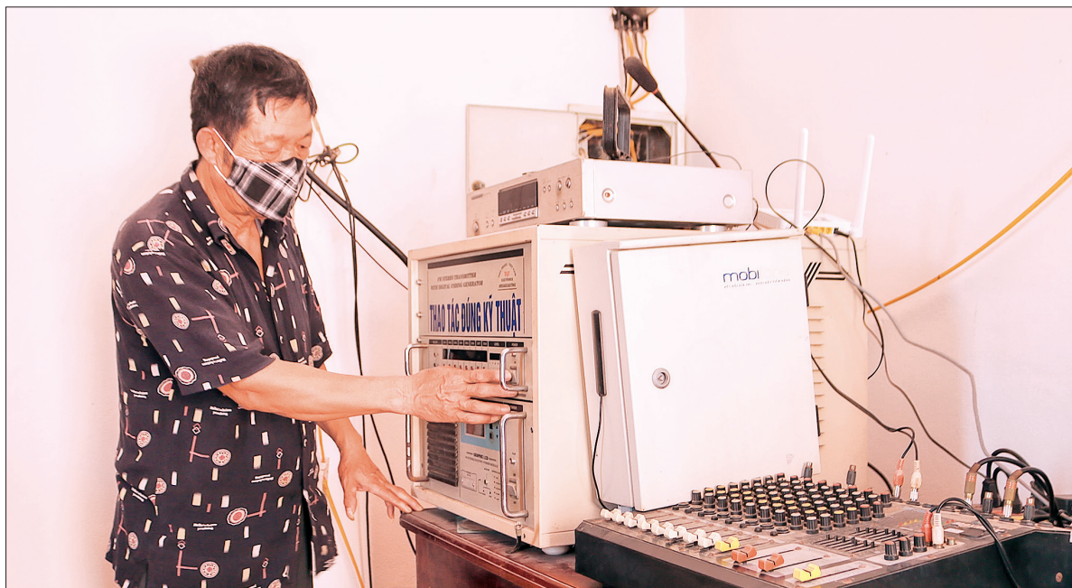
Cán bộ Đài Truyền thanh xã Đông Dương (Đông Hưng) vận hành chương trình phát sóng.

Thay vì phát thanh thông qua sóng FM, ĐTT thông minh thế hệ mới sử dụng công nghệ IP để truyền và nhận bản tin phát thanh qua mạng internet, sóng 3G/4G. Hệ thống thiết bị gọn nhẹ, đơn giản, lắp đặt sử dụng dễ dàng, thuận lợi cho nhân viên điều khiển, nhân sự vận hành cần ít hơn so với ĐTT truyền thống. Đài được tích hợp với hệ thống cũ để hoạt động song song, giúp lưu trữ và quản lý tốt các nội dung đã phát, điều khiển hoàn toàn trên máy tính, thiết bị di động, giúp phổ biến, tuyên truyền thông tin dễ dàng, nhanh gọn. Các cấp có thẩm quyền dễ dàng kiểm soát thông tin, quản lý chương trình, lịch phát thanh với độ bảo mật cao. Việc phát các bản tin linh hoạt, có thể lựa chọn phát tin tới từng cụm loa hoặc từng khu vực, lịch phát thanh được đặt theo giờ, ngày hoặc tuần. Đặc biệt, nhờ tích hợp công nghệ trí tuệ nhân tạo AI có thể tự động nhận dạng và chuyển văn bản sang giọng nói tự động, chuyển tệp tin âm thanh để phát ra hệ thống loa mà không cần phát thanh viên thu âm. Đài không dây, giúp bảo đảm mỹ quan đô thị, cho chất lượng âm thanh tốt, tiếng trong, không có tạp âm, có