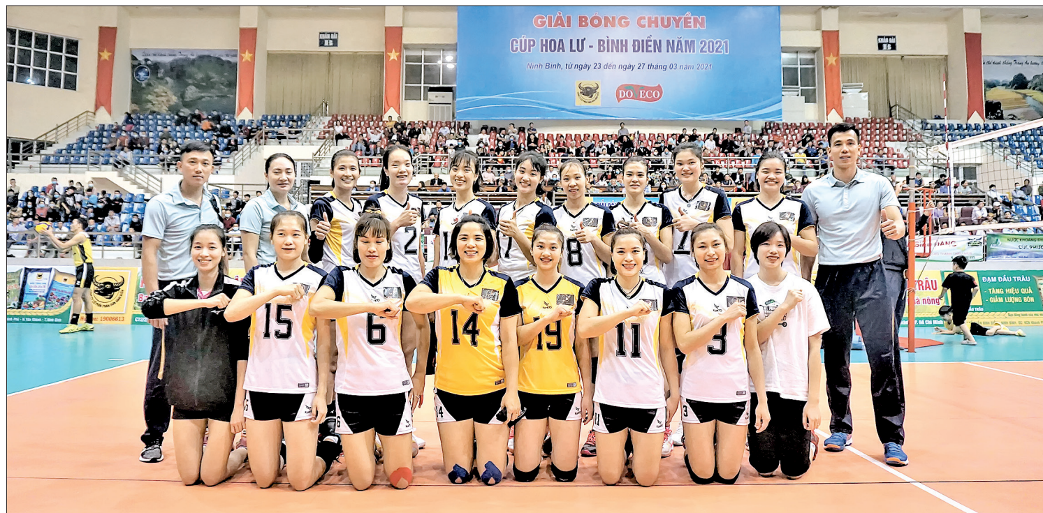
Các thành viên đội tuyển bóng chuyền nữ Thái Bình.

Sau khi Bộ Chính trị ban hành Nghị quyết số 08-NQ/TW, ngày 1/12/2011, Ban Thường vụ Tỉnh ủy đã ban hành Chỉ thị số 11-CT/TU, ngày 29/5/2012 về “Tăng cường sự lãnh đạo của Đảng, tạo bước phát triển mạnh mẽ về thể dục thể thao (TDTT) đến năm 2020”. Qua 10 năm thực hiện Nghị quyết số 08-NQ/TW và Chỉ thị số 11-CT/TU, TDTT Thái Bình đã đạt được nhiều kết quả nổi bật.