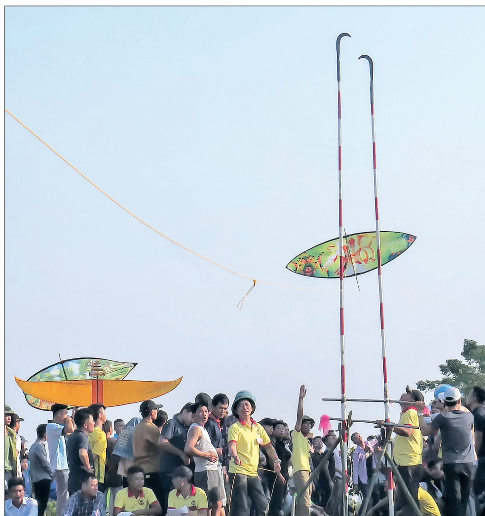
Các câu lạc bộ trong và ngoài tỉnh tham gia hội thi thả diều vượt cầu liêm.

Để tiếp tục triển khai thực hiện tốt Nghị quyết số 08 của Bộ Chính trị và Chỉ thị số 11 của Ban Thường vụ Tỉnh ủy, vấn đề trọng tâm đặt ra cần đổi mới nội dung, hình thức tuyên truyền nâng cao nhận thức của toàn xã hội về vị trí, vai trò quan trọng của TDTT đối với việc nâng cao sức khỏe nhân dân, nâng tầm vóc và thể lực con người Việt Nam trong thời kỳ mới. Nâng cao chất lượng dạy và học giáo dục thể chất chính khóa trong các nhà trường, tăng cường các hoạt động ngoại khóa theo hướng đa dạng các hình thức hoạt động, chú trọng đến nhu cầu tự chọn của học sinh. Tăng cường đầu tư xây dựng cơ sở vật chất, đưa môn bơi vào chương trình ngoại khóa. Tiếp tục đẩy mạnh thực hiện cuộc vận động "Toàn dân rèn luyện thân thể theo gương Bác Hồ vĩ đại"; vận động và thu hút đông đảo nhân dân tham gia tập luyện TDTT; tạo điều kiện thuận lợi để phát triển đa dạng các hình thức tổ chức tập luyện TDTT ở cơ sở; chú trọng duy trì và phát triển các môn thể thao dân tộc, các trò chơi dân gian. Đầu tư có trọng tâm, trọng điểm vào các môn thể thao thể mạnh, truyền thống của tỉnh; tăng cường huy động và tạo điều kiện thuận lợi để mọi tổ chức, cá nhân tham gia đầu tư phát triển TDTT quần chúng, thể thao thành tích cao và thể thao chuyên nghiệp.