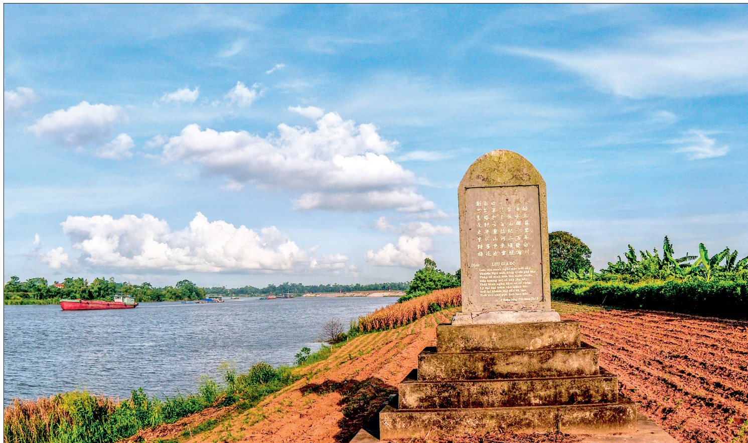
Bến Lưu Gia bên bờ sông Luộc và bia đá khắc bài thơ.

Sử cũ chép: Cuối thời nhà Lý (1010 - 1225), loạn lạc xảy ra khắp nơi, họ Trần ở Lưu Xá (nay thuộc xã Canh Tân, huyện Hưng Hà) cũng tập hợp trai đinh luyện tập võ thuật rồi bỏ tiền vàng sắm thuyền bè, vũ khí... “dấy binh” ở vùng sông Luộc. Năm 1209, tại kinh thành Thăng Long có loạn Quách Bốc, vua nhà Lý lúc ấy là Lý Cao Tông sợ bị hãm hại liền bỏ kinh thành cùng thân quyến chạy lên vùng Quy Hóa (nay là tỉnh Tuyên Quang), còn thái tử Lý Huệ Sảm “theo chân” họ Trần chạy về vùng Hải Ấp bên bờ sông Luộc giữ mình. Anh em họ Trần (Trần Tự Khánh, Trần Thừa, Trần Thủ Độ...) đã “tận dụng” cơ hội “ngàn năm có một” này đón thái tử về nhà họ Trần nuôi dưỡng, bảo vệ.