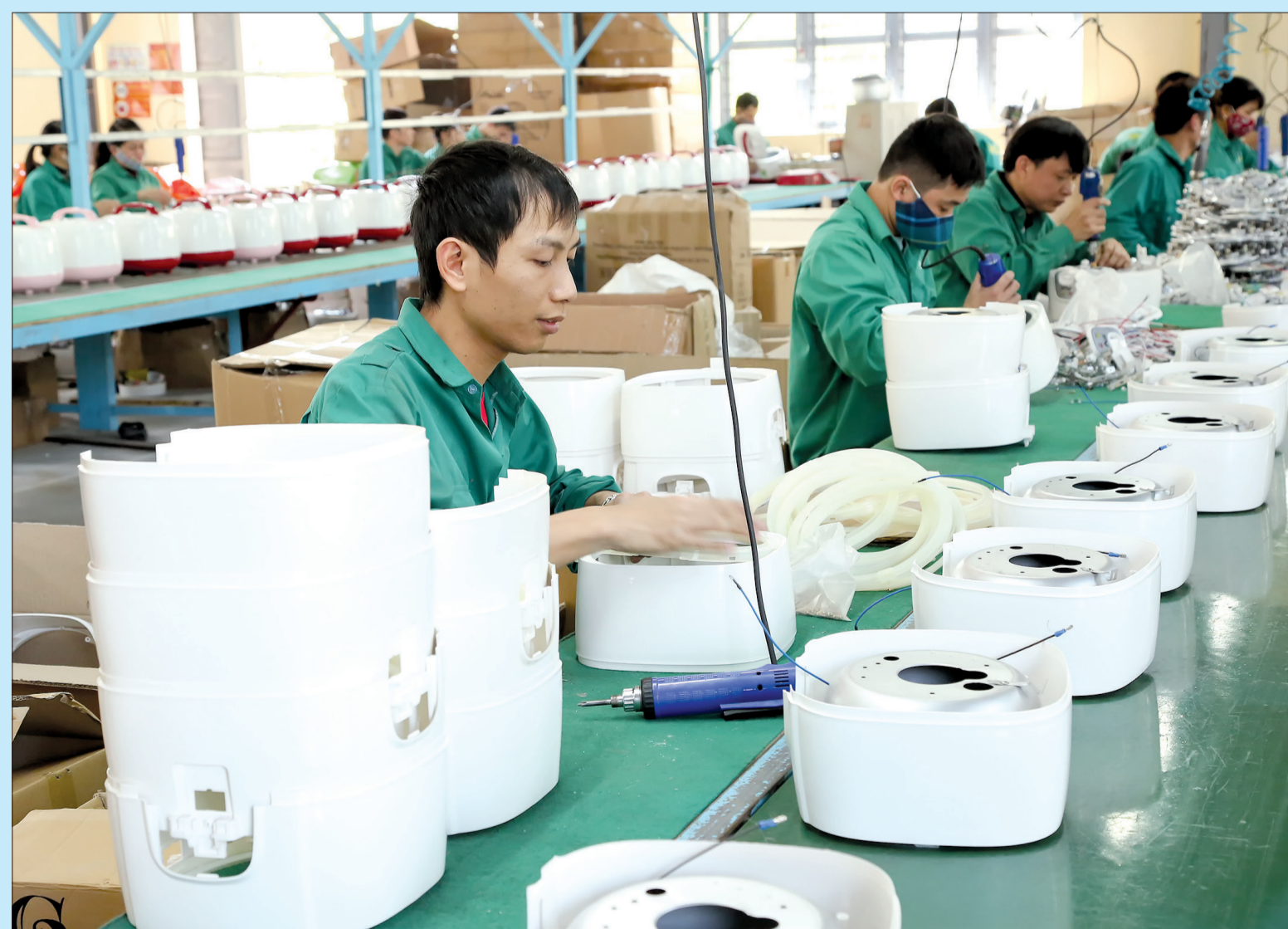
Dây chuyền sản xuất của Công ty Điện cơ AIDI.