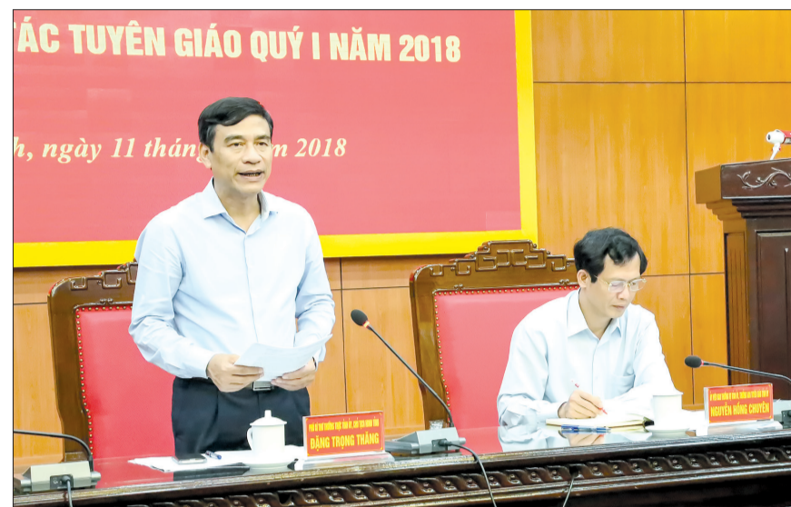
Đồng chí Đặng Trọng Thăng, Phó Bí thư thường trực Tỉnh ủy, Chủ tịch HĐND tỉnh phát biểu tại hội nghị.