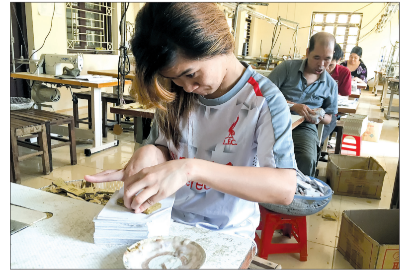
Nạn nhân bị ảnh hưởng gián tiếp bởi chất độc da cam/Đioxin được dạy nghề, tạo việc làm.