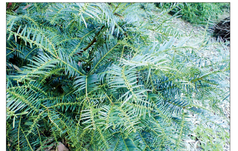
Cây đinh tùng trong tự nhiên.

Trong quá trình nghiên cứu 15 loài cây lá kim ở Tây Nguyên, các nhà khoa học của Bảo tàng thiên nhiên Việt Nam và Viện Hóa học (Viện Hàn lâm khoa học và công nghệ Việt Nam) đã phát hiện hoạt chất mới là Norisoharringtonine từ vỏ cây đinh tùng. Hoạt chất này có khả năng ức chế mạnh lên các dòng tế bào ung thư biểu mô, ung thư gan, ung thư phổi và ung thư vú khi thử nghiệm trong phòng thí nghiệm.