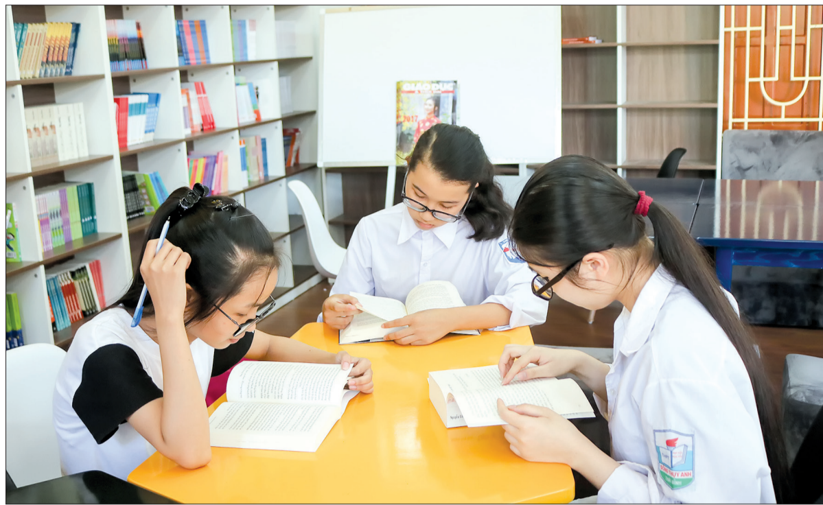
Học sinh Trường THCS Thụy Liên (Thái Thụy) đọc sách trong thư viện nhà trường.

Năm học 2017 - 2018, nhiều chỉ tiêu để ra đã được ngành Giáo dục và Đào tạo hoàn thành với kết quả cao. Tỷ lệ huy động trẻ vào học trường mầm non duy trì ở mức cao trong đó trẻ nhà trẻ có 34.003 cháu, đạt 67,9%; mẫu giáo 88.910 cháu, đạt 99,7%. Trong năm học có 902 lớp mẫu giáo 5 tuổi, tăng 127 lớp so với năm học trước. Cấp tiểu học tiếp tục đổi mới phương pháp dạy học theo hướng tiếp cận và nâng cao năng lực của người học bảo đảm nhẹ nhàng, tự nhiên, phát huy tính tích cực, tự giác, chủ động, sáng tạo, coi trọng tác động tinh cảm, tạo niềm vui, gây hứng thú trong học tập cho học sinh. 295 trường tiểu học đã vận dụng phương pháp "bàn tay nặn bột" vào một số tiết dạy các môn khoa học lớp 4, 5, tự nhiên và xã hội lớp 2, 3. Cấp THPT, THCS tiếp tục đẩy mạnh ứng dụng công nghệ thông tin trong quản lý, tích cực áp dụng hình thức tổ chức hội nghị, hội thảo, tập huấn, trao đổi công tác, chuyên môn giữa cơ quan quản lý giáo dục với nhà trường, giữa nhà trường với giáo viên. Chất lượng giáo dục mũi nhọn được giữ vững. 38 học sinh của Trường THPT Chuyên Thái Bình đạt giải trong kỳ thi chọn học sinh giỏi quốc gia, trong đó có 4 giải nhì, 11 giải ba, 23 giải khuyến khích. Trong kỳ thi chọn