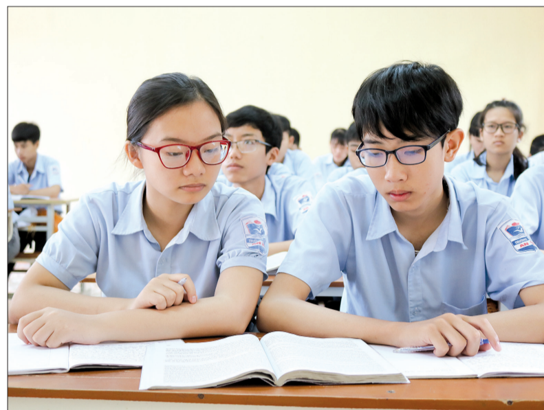
Giờ lên lớp của học sinh Trường THCS AN Vũ (Quyên Phụ).

Năm học 2017 - 2018, nhiều chỉ tiêu để ra đã được ngành Giáo dục và Đào tạo hoàn thành với kết quả cao. Tỷ lệ huy động trẻ vào học trường mầm non duy trì ở mức cao trong đó trẻ nhà trẻ có 34.003 cháu, đạt 67,9%; mẫu giáo 88.910 cháu, đạt 99,7%. Trong năm học có 902 lớp mẫu giáo 5 tuổi, tăng 127 lớp so với năm học trước. Cấp tiểu học tiếp tục đổi mới phương pháp dạy học theo hướng tiếp cận và nâng cao năng lực của người học bảo đảm nhẹ nhàng, tự nhiên, phát huy tính tích cực, tự giác, chủ động, sáng tạo, coi trọng tác động tinh cảm, tạo niềm vui, gây hứng thú trong học tập cho học sinh. 295 trường tiểu học đã vận dụng phương pháp "bàn tay nặn bột" vào một số tiết dạy các môn khoa học lớp 4, 5, tự nhiên và xã hội lớp 2, 3. Cấp THPT, THCS tiếp tục đẩy mạnh ứng dụng công nghệ thông tin trong quản lý, tích cực áp dụng hình thức tổ chức hội nghị, hội thảo, tập huấn, trao đổi công tác, chuyên môn giữa cơ quan quản lý giáo dục với nhà trường, giữa nhà trường với giáo viên. Chất lượng giáo dục mũi nhọn được giữ vững. 38 học sinh của Trường THPT Chuyên Thái Bình đạt giải trong kỳ thi chọn học sinh giỏi quốc gia, trong đó có 4 giải nhì, 11 giải ba, 23 giải khuyến khích. Trong kỳ thi chọn