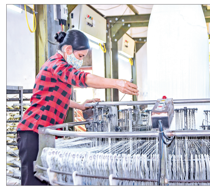
Công ty Cổ phần Tam Kỳ thiếu số lượng lớn lao động.