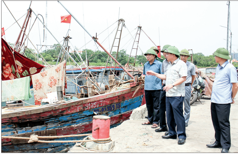
Đổng chí Nguyễn Khắc Thân, Phó Bí thư Tỉnh ủy, Chủ tịch UBND tỉnh kiểm tra công tác kiểm đếm, kêu gọi tàu thuyền vào nơi tránh trú tại cảng cá Tân Sơn (Thái Thụy).