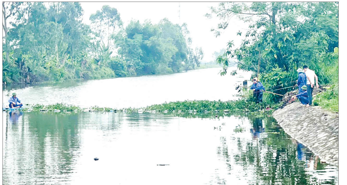
Xí nghiệp Khai thác công trình thủy lợi Hưng Hà tổ chức thu vớt bèo bống gây cản trở dòng chảy.