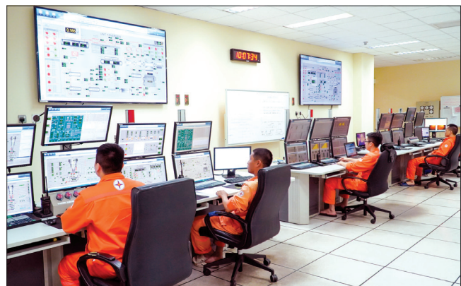
Từ đầu mùa khô đến nay, 2 tổ máy của Nhà máy nhiệt điện Thái Bình luôn chạy hết công suất, phát điện liên tục 24/24 giờ, Công ty phân công lực lượng trực làm việc 3 ca, 5 kíp. Trong ảnh: Các kỹ sư trực vận hành 2 tổ máy phát điện tại phòng điều khiển trung tâm.