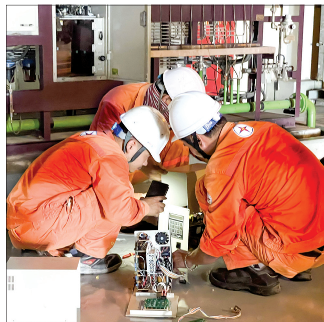
Với nền nhiệt độ 37 - 39°C cộng với sức nóng của lò đốt và máy móc phát ra, các công nhân kỹ thuật người ướt đầm mồ hôi nhưng luôn tập trung cao độ cho công việc sửa chữa, bảo dưỡng thiết bị, bảo đảm hoạt động an toàn, thông suốt.