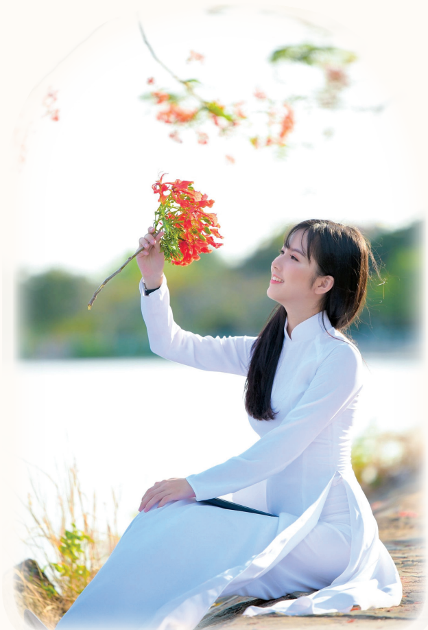
Ảnh khai thác internet

Bước chân hè lướt bên hoa Chập chờn cánh bướm la đà vu vơ Ta về chấp tiếp vần thơ Cùng màu phượng thắm đợi chờ bạn xưa.