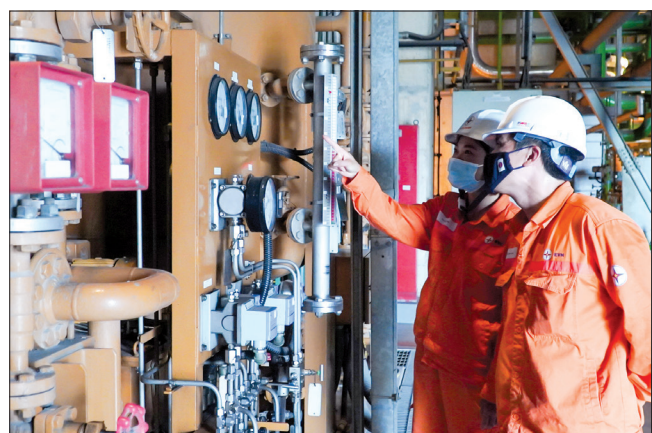
Dù được vận hành tự động và có thiết bị giám sát từ xa nhưng các công nhân phân xưởng vận hành vẫn đi kiểm tra trực tiếp các thiết bị, máy móc. Trong ảnh: Kíp công nhân kiểm tra hoạt động của hệ thống đầu chèn tua bin.