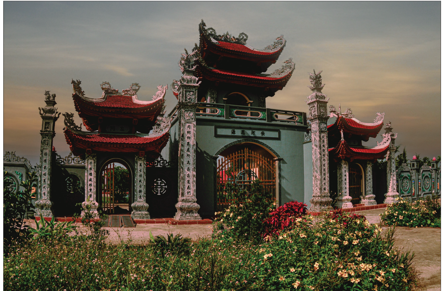
Đền thờ Phan Bá Vành, làng Minh Giám, xã Vũ Bình (Kiến Xương).

Xuất thân trong một gia đình nông dân nghèo, Phan Bá Vành (Ba Vành, Phan Bá Vinh), quê tại làng Minh Giám, huyện Chân Định, phủ Kiến Xương, nay thuộc xã Minh Tân và Vũ Bình, huyện Kiến Xương, tài trí hơn người, ngày đêm phải chứng kiến nỗi thống khổ đến cùng cực của những người nông dân, trong đó có cha mẹ mình bởi ách áp bức, bóc lột tàn bạo của chính quyền phong kiến triều Nguyễn, ông đã đứng lên tập hợp lực lượng, sắm sửa khí giới chiến đấu giành lại quyền sống cho dân nghèo. Chỉ sau thời gian ngắn, ông đã quy tụ được khoảng 5.000 người. Với lực lượng lớn và tài thao lược, Phan Bá Vành chỉ huy nghĩa quân khuyh đảo tinh thần quan quân triều đình nhà Nguyễn.