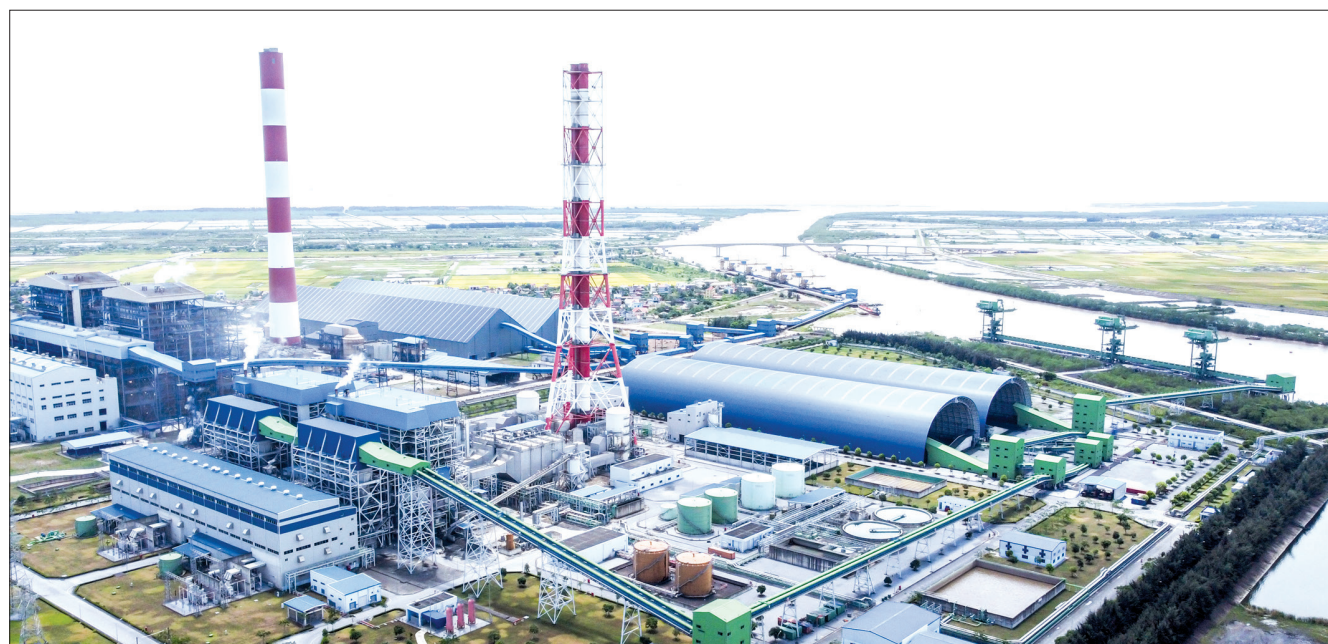
Trung tâm điện lực Thái Bình có 2 dự án nhiệt điện gồm Nhà máy nhiệt điện Thái Bình và Nhà máy nhiệt điện Thái Bình 2 với tổng công suất 1.800MW đáp ứng nhu cầu sinh hoạt, sản xuất của người dân, doanh nghiệp không chỉ tỉnh Thái Bình, các tỉnh đồng bằng sông Hồng mà còn hỗ trợ cung cấp điện cho các tỉnh miền Nam qua đường dây 500kV.

nóng, áp lực công việc cao nhưng mỗi cán bộ, công nhân Công ty Nhiệt điện Thái Bình vẫn nỗ lực cố gắng hoàn thành nhiệm vụ được giao. Mọi hoạt động chưa cần thiết đều được hoãn lại, ưu tiên số một của Công ty lúc này là vận hành sản xuất, cung ứng điện phục vụ sản xuất, kinh doanh của doanh nghiệp và ổn định đời sống nhân dân.