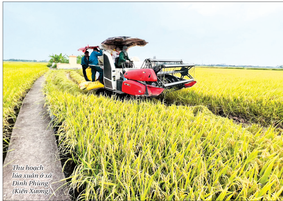
Thu hoạch lúa xuân ở xã Đình Phùng (Kiến Xương).

Phóng viên: Xin trân trọng cảm ơn đồng chí!