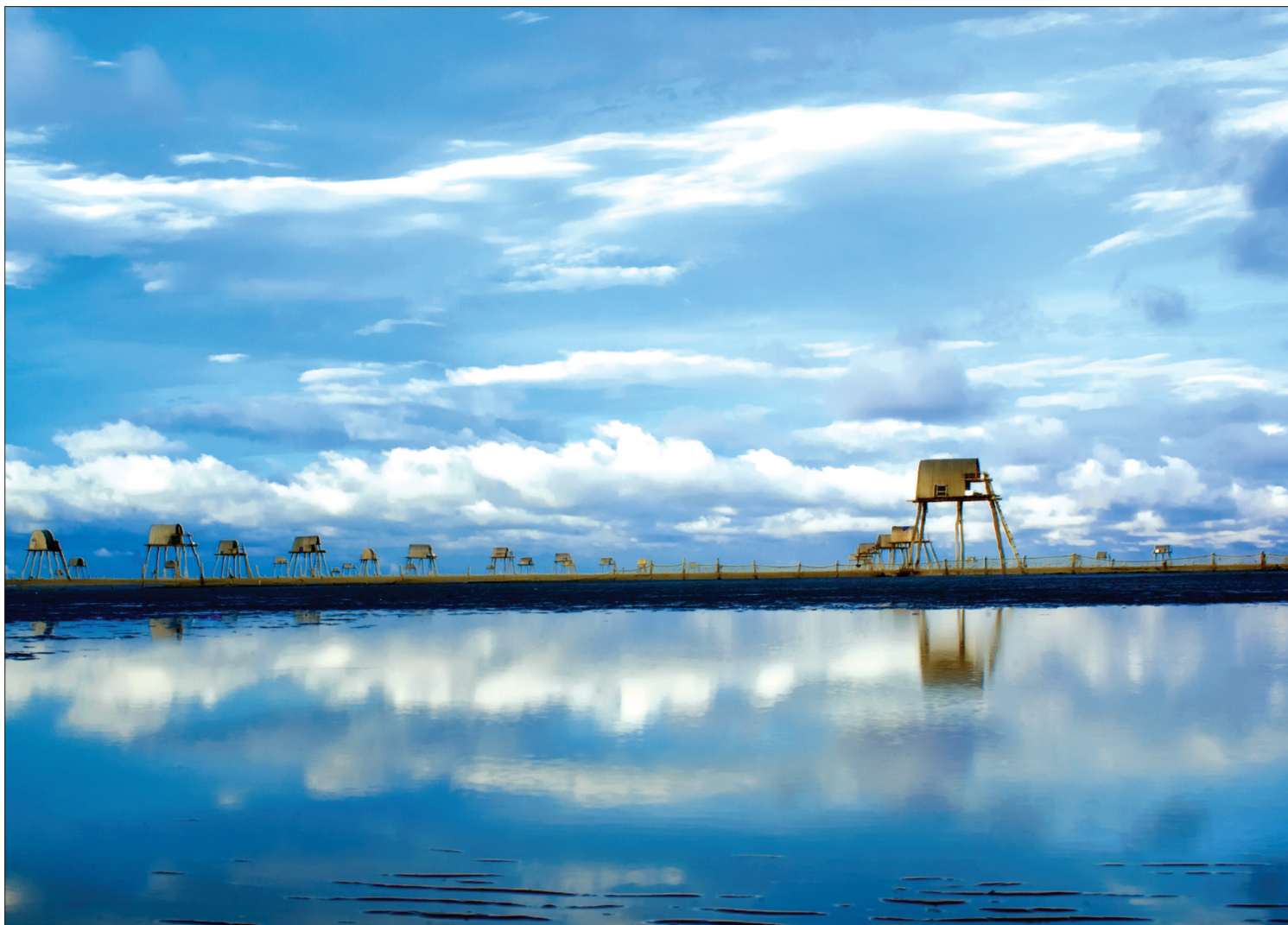
Bãi biển Đông Châu, xã Đông Minh (Tiên Hải).

Hẳn là, trên chặng đường mới, Tiên Hải sẽ từ điểm tựa của truyền thống mà lập thêm những kỳ công mới để ngày thêm thật xứng với tên mình.