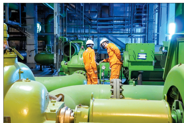
Được đầu tư máy móc, công nghệ hiện đại và thực hiện tốt công tác kiểm tra, bảo dưỡng, sửa chữa, đại tu đúng định kỳ nên hệ thống máy móc của Nhà máy nhiệt điện Thái Bình luôn hoạt động ổn định.