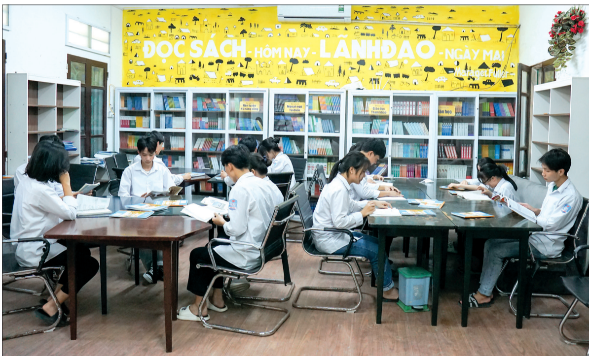
Thư viện Trường THPT Thái Phúc thu hút học sinh.

động trải nghiệm thực tế. Với quan điểm giáo dục toàn diện, học sinh khi đến lớp bên cạnh việc được thầy cô trang bị kiến thức còn được khuyến khích tham gia các hoạt động văn hóa văn nghệ, thể dục thể thao, góp phần nâng cao kiến thức và hình thành những phẩm chất, năng lực, định hướng và giáo dục chiều sâu cho học sinh.