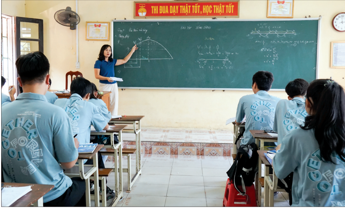
Cô và trò Trường THPT Thái Phúc.

Về thăm Trường THPT Thái Phúc giữa những ngày cuối thu, khi cái nắng vàng ươm với những sợi mỏng manh như tơ trời vương trên những dãy hành lang đã nhuộm màu thời gian, bước chân trên đám lá vàng khô xào xạc mới thấy khung cảnh dưới mái trường nơi đây đã là niềm thương, nỗi nhớ của biết bao thế hệ học trò về lứa tuổi "nhất quỷ, nhì ma". Thời gian thấm thoắt trôi đi nhưng những thầy cô giảng dạy khóa đầu tiên của Trường đến nay vẫn luôn nhớ những năm tháng khởi đầu của ngôi trường có bề dày truyền thống.