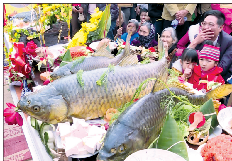
Nét đẹp văn hóa dân gian thì cổ cả với ý nghĩa bày tỏ lòng thành kính của nhân dân với các vị tổ tiên nhà Trần.

Đã thành thông lệ, hàng năm, cứ đến ngày 13 tháng Giêng, lễ hội đền Trần được tổ chức. Nhân dân trong tỉnh, đồng bào, du khách trong và ngoài nước lại tề tựu về mảnh đất linh thiêng để thấp nén nhang thơm tưởng nhớ và tri ân công lao to lớn của các vị vua triều Trần, Thống quốc Thái sư Trần Thủ Độ, Linh từ Quốc mẫu Trần Thị Dung, Quốc công Tiết chế Hưng