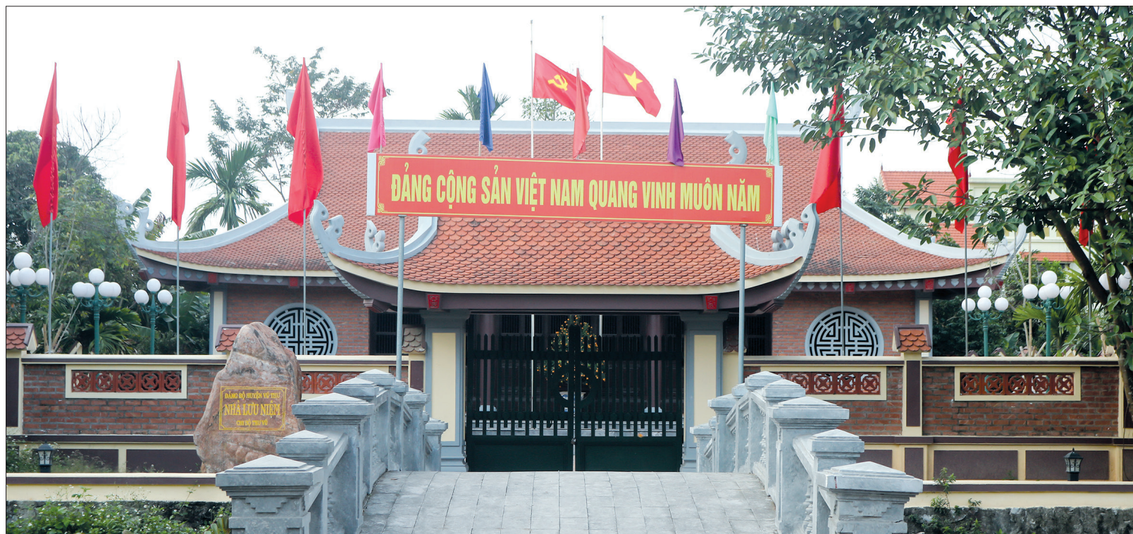
Nhà lưu niệm Chi bộ Thư Vũ, thôn Hưng Nhượng, xã Vũ Hội (Vũ Thư).

Cuối tháng 6/1929, tại số nhà 9, ngõ 1, phố Duyn-pích-kê, thị xã Thái Bình (nay là phố Vọng Cung, thành phố Thái Bình), Đảng bộ Đông Dương Cộng sản Đảng tỉnh Thái Bình được thành lập. Ngọn lửa của tinh thần yêu nước và lý tưởng cách mạng ấy đã thắp lên ánh sáng diệu kỳ, soi sáng con đường đưa nhân dân Thái Bình bước qua đêm trường nô lệ giành lại độc lập, tự do.