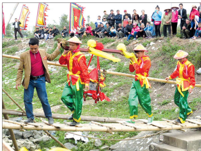
Lễ rước nước là nghi thức quan trọng mở màn cho chuỗi các hoạt động tại lễ hội đền Trần.

Tiếp tục khẳng định giá trị di sản văn hóa nhà Trần ở Thái Bình, tri ân công lao to lớn của các bậc tiền nhân trong sự nghiệp xây dựng và bảo vệ đất nước, ngày 30/5/2019, Ban Thường vụ Tỉnh ủy có thông báo Kết luận số 693-TB/TU về chủ trương tổ chức một số lễ hội quy mô cấp tỉnh, trong đó có lễ hội đền Trần. UBND tỉnh là đơn vị chủ trì, chỉ đạo các ngành, địa phương liên quan phối hợp tổ chức. Từ tháng 12/2019, kế hoạch tổ chức lễ hội đền Trần năm 2020 đã được xây dựng cụ thể. Ban tổ chức lễ hội được thành lập do đồng chí Phó Chủ tịch UBND tỉnh phụ trách làm Ban Thường ban. Tham mưu, giúp việc Ban tổ chức có 4 tiểu ban: nội dung; tuyên truyền; hậu cần, khánh tiết; an ninh trật tự do các đồng chí lãnh đạo các ngành, huyện Hưng Hà làm trưởng tiểu ban. Đến nay, các tiểu ban đã xây dựng kế hoạch chi tiết cho việc tổ chức lễ hội. Bà Trương