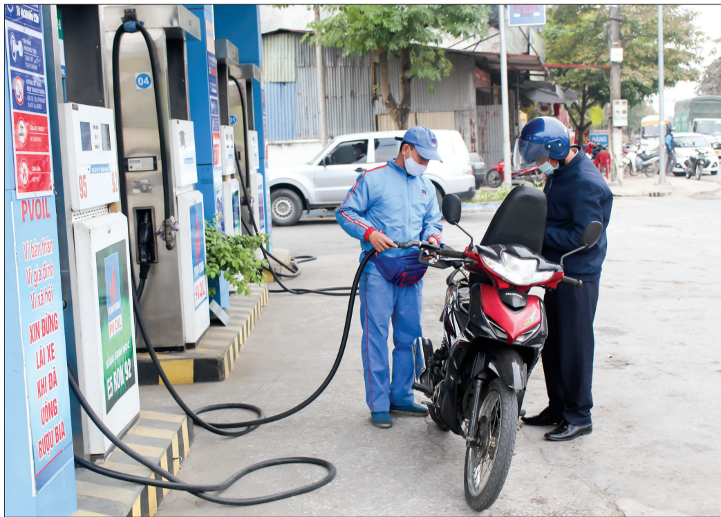
Công ty Cổ phần Xăng dầu Thái Bình luôn thực hiện tốt nghĩa vụ thuế đối với nhà nước.

T rong tổng thu ngân sách thì tổng thu từ thuế, phí sau khi trừ tiền sử dụng đất đạt hơn 1.509 tỷ đồng, đạt 26,3% dự toán, tăng 12,6% so với cùng kỳ năm 2021; trong đó nhiều chỉ tiêu cơ sở thu đạt cao so với dự toán như: thu tiền sử dụng đất đạt 47,5% dự toán với số thu hơn 712 tỷ đồng, thu từ hoạt động xổ số đạt 36,5% dự toán với số thu hơn 20 tỷ đồng, thuế thu nhập cá nhân đạt 49,7% dự toán với số thu hơn 134 tỷ đồng, thu các loại phí, lệ phí đạt 37,1% dự toán với số thu hơn 31 tỷ đồng, thu từ khu vực đầu tư nước ngoài đạt 32,7% dự toán với số thu hơn 39 tỷ đồng... Ông Hà Nhật Quang, Phó Cục trưởng Cục Thuế tỉnh cho biết: Ngay từ đầu năm, ngành thuế đã tổ chức ký giao ước thi đua và phát động sâu rộng phong trào thi đua trong toàn ngành nhằm phấn đấu hoàn thành xuất sắc nhiệm vụ thu ngân sách năm 2022. Bên cạnh đó, ngành thuế chủ động tham mưu cho Ban Chỉ đạo thu ngân sách nhà nước tỉnh chỉ đạo thực hiện các giải pháp về thu ngân sách, kịp thời tháo gỡ những khó khăn, vướng mắc liên quan