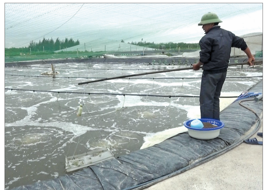
Nuôi tôm công nghệ cao tại xã Nam Thịnh (Tiên Hải).