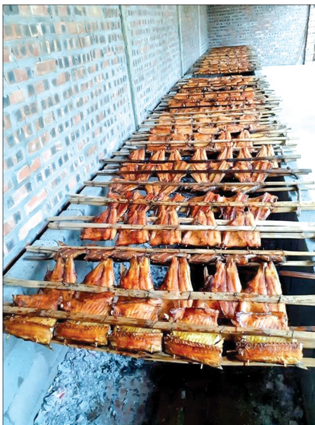
Cá nướng Thái Xuyên (Thái Thụy).

Quê tôi có quan niệm nhiều thịt thì mới gọi là cỗ to. Cỗ cưới phải có từ 5 - 7 món chính, ngày xưa nghèo khó nên cỗ sắp không được đầy đặn; giờ đây đời sống được nâng lên, nguồn thực phẩm dồi dào nên nhà nào ít thì sắp 6 món, nhiều thì 7 món, không kể các món phụ.