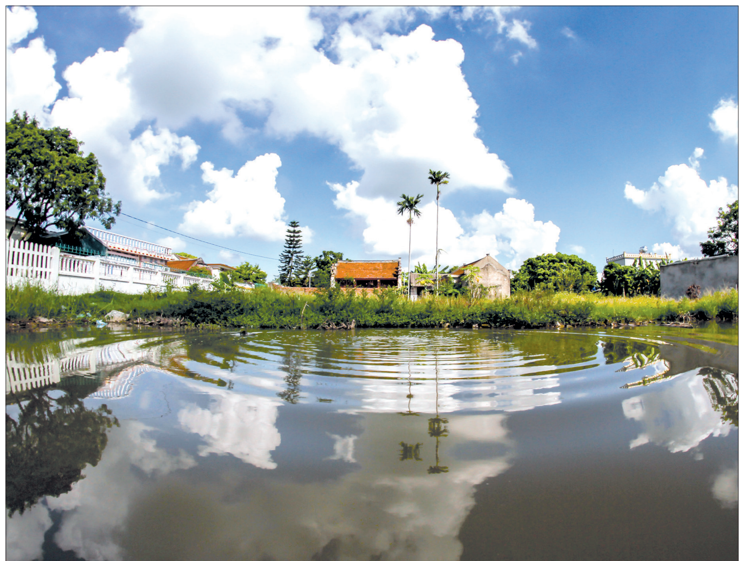
Cụm di tích đình, đền thôn Đắc Chúng Nam, xã Quốc Tuấn (Kiến Xương) - nơi có nhiều dấu tích cổ của người Việt Mường thời đại các Vua Hùng.

Nhiều nhà nghiên cứu văn hóa cho rằng Thái Bình có sự thiếu hụt về di tích nhưng loại hình văn hóa phi vật thể, dã sử về phong tục, đời sống tâm linh của cư dân truyền ngôn lại qua sự tích các phúc thần có nguồn gốc từ thuở vua Hùng mở nước còn đang được thờ phụng tại các làng quê lại rất phong phú. Phúc thần thời Hùng Vương được thờ nhiều như Hồng Thức, Hùng Lược, Cao Sơn, Quý Minh, Cao Các, Nam Hải... trùng khớp với dấu tích gốm Đường Cổ.