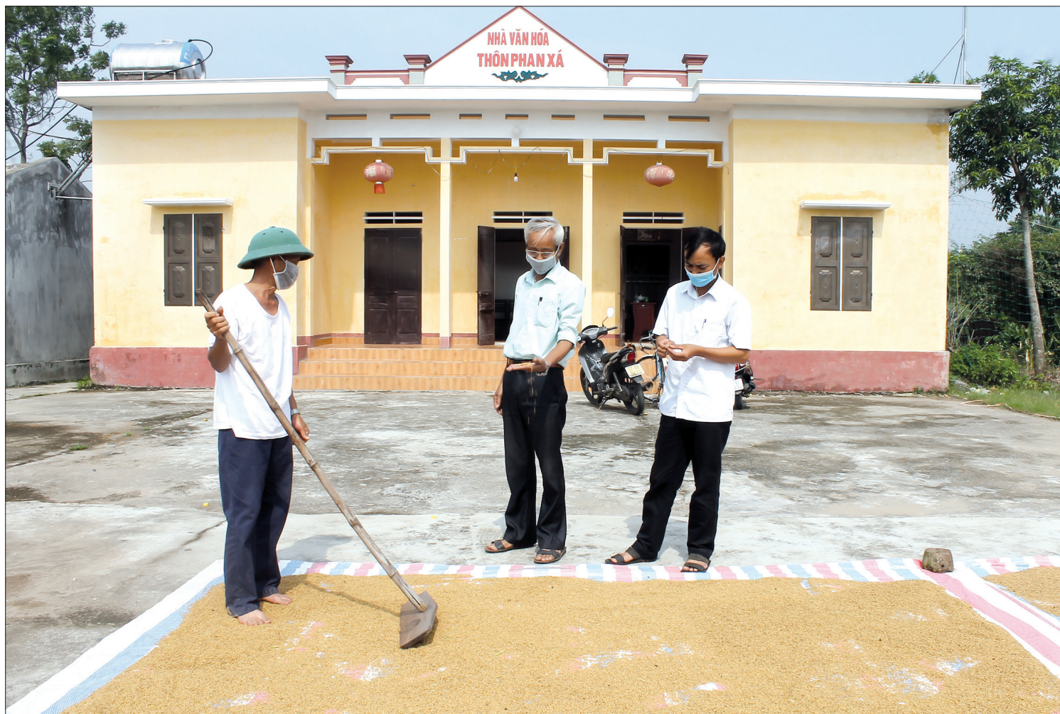
Cán bộ thôn Phan Xá trao đổi, nắm bắt tình hình sản xuất của nhân dân.

Phan Xá là 1 trong 9 thôn của xã Hồng Phong (Vũ Thư). Mặc dù gặp nhiều khó khăn nhưng những năm qua cán bộ, nhân dân thôn Phan Xá luôn đoàn kết, sáng tạo, giúp nhau phát triển kinh tế, nâng cao đời sống tinh thần, đặc biệt có nhiều phong trào thi đua sôi nổi. Nhiều năm qua, Phan Xá được đánh giá là thôn văn hóa tiêu biểu của huyện.