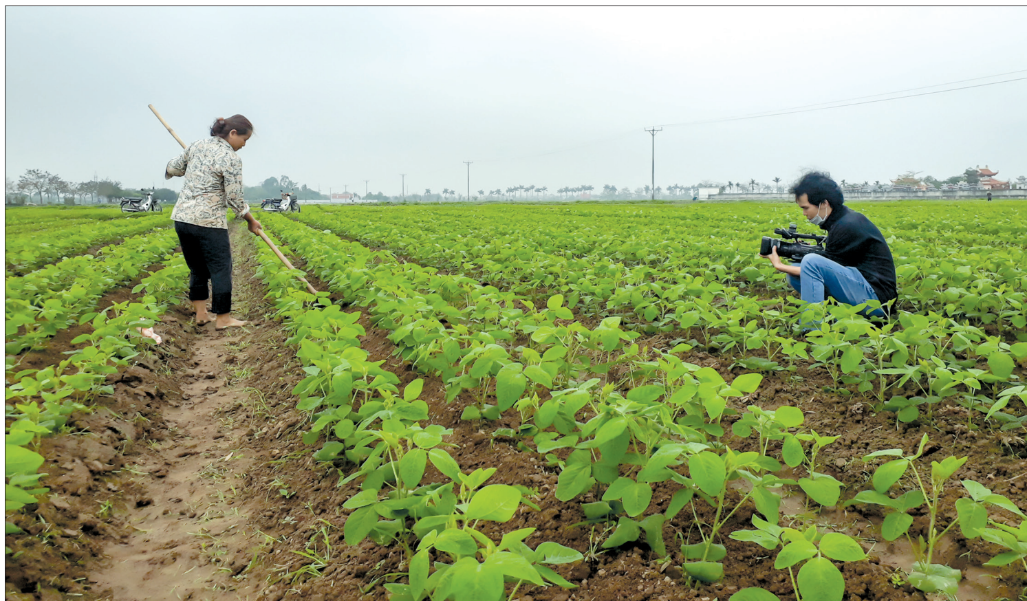
Báo Thái Bình đa dạng hình thức thể hiện để chuyển tải chính xác, dễ hiểu các khoa học kỹ thuật mới trong sản xuất đến nông dân.

Nông nghiệp, nông dân, nông thôn (tam nông) là nội dung trọng tâm trong phát triển kinh tế đất nước mà Nghị quyết số 26-NQ/TW, ngày 5/8/2008 của Ban Chấp hành Trung ương Đảng khóa X về nông nghiệp, nông dân, nông thôn đã chỉ ra. Sau hơn 10 năm thực hiện Nghị quyết, nông thôn Thái Bình đã có những bước chuyển mình mạnh mẽ. Song hành cùng của Đảng bộ và nhân dân tỉnh nhà, trở lại cùng nông dân thời hội nhập, những người làm báo ở Báo Thái Bình thực sự trách nhiệm trong tìm tòi, phát hiện để tài, phản ánh một cách đa dạng, toàn diện cuộc cách mạng nông thôn, sự đổi thay trong tư duy và cách làm của người nông dân.