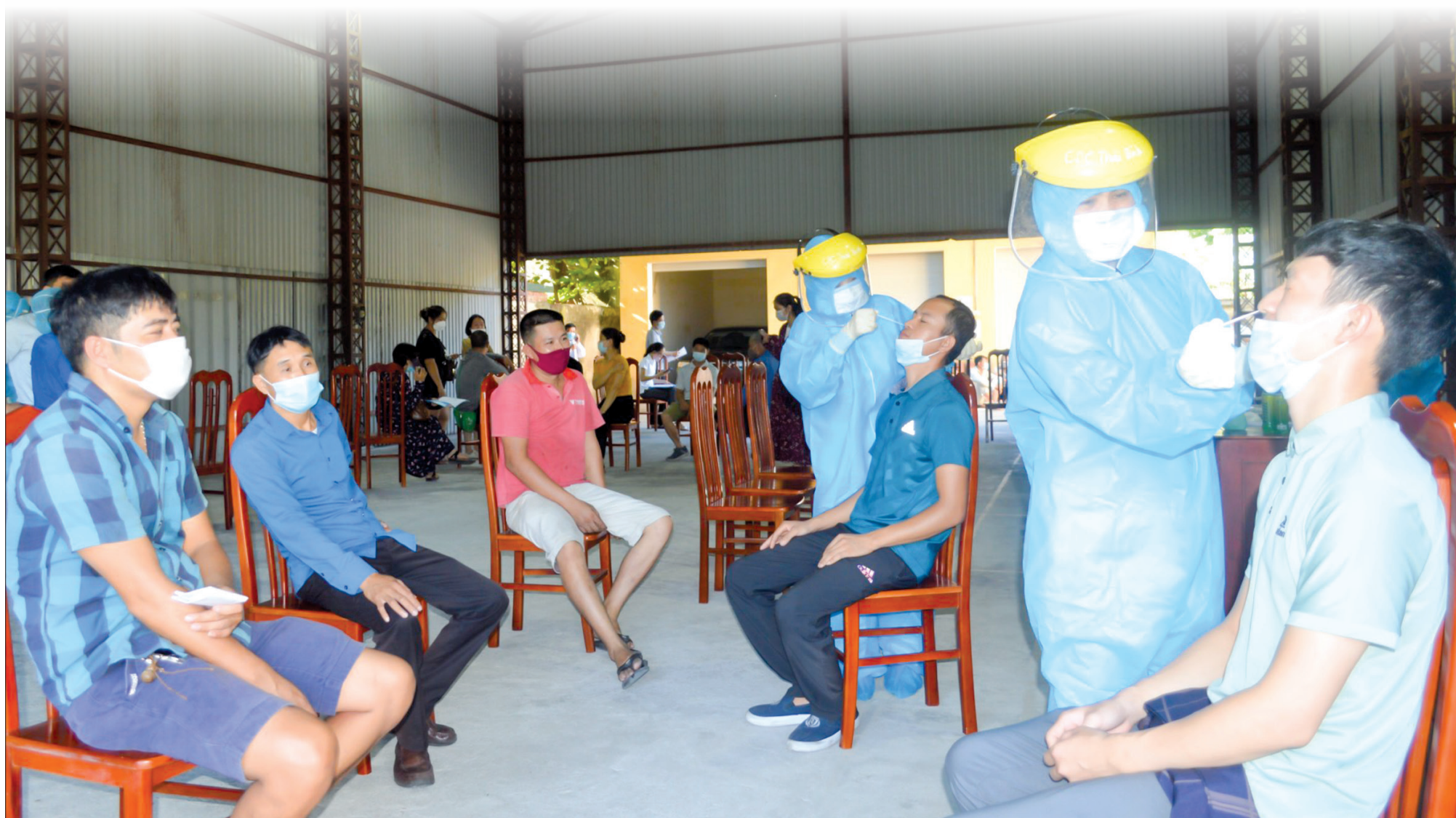
Xét nghiệm sàng lọc Covid-19 tại doanh nghiệp.

Trên tinh thần phòng, chống dịch là nhiệm vụ trọng tâm, trên hết, trước hết, các cấp, ngành, địa phương trong tỉnh đã chủ động đưa ra các giải pháp để thích ứng an toàn, linh hoạt, kiểm soát hiệu quả dịch Covid-19. Cuộc sống trong trạng thái bình thường mới mang đến niềm vui cho người dân khi các hoạt động dần được mở lại. Song để có thể bảo vệ, giữ vững thành quả ấy, vai trò của người dân rất quan trọng, nhất là khi dịch vẫn đang diễn biến phức tạp, một số địa phương giáp Thái Bình đã ghi nhận có ca nhiễm Covid-19 trong cộng đồng và chưa tìm thấy nguồn lây.