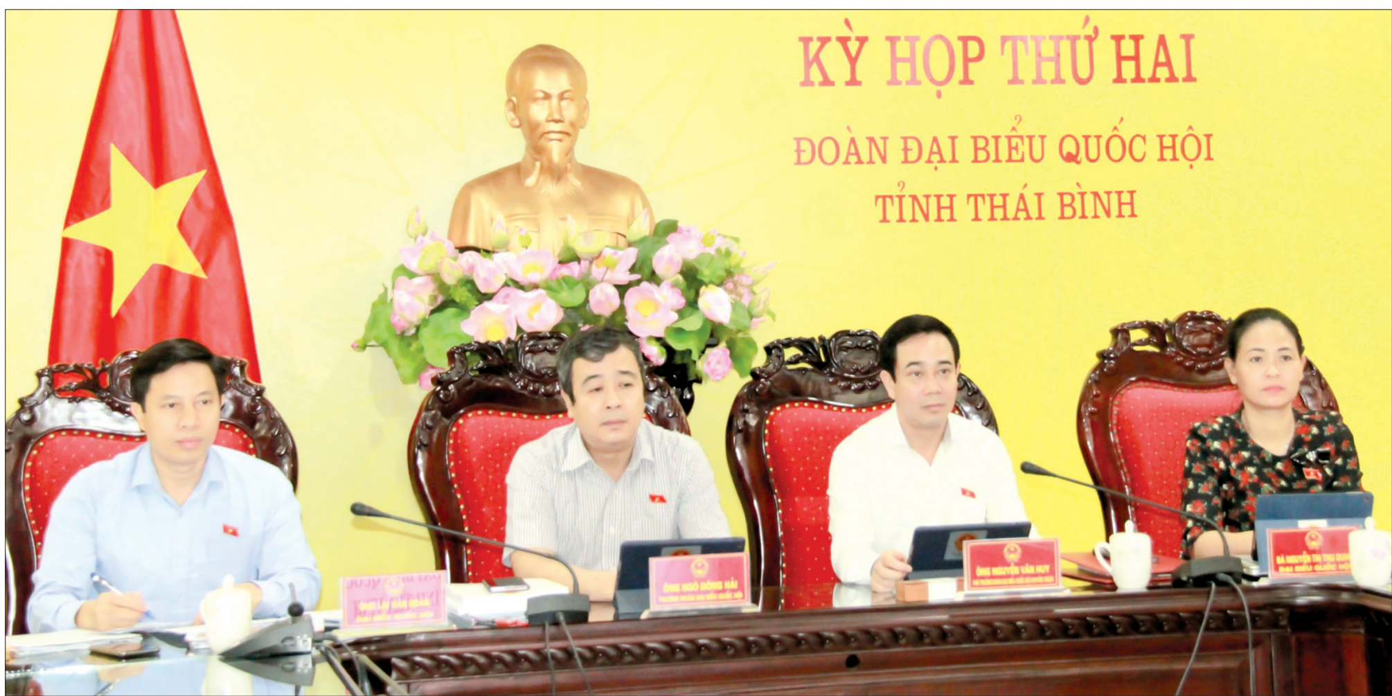
Các đại biểu Quốc hội tỉnh dự họp tại điểm cầu Thái Bình.