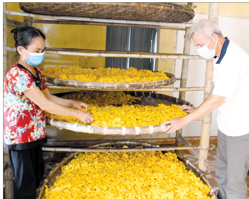
Nhân dân thôn Phan Xá đoàn kết, giúp đỡ, hỗ trợ nhau trong chuyển đổi cơ cấu cây trồng, vật nuôi để nâng cao thu nhập.