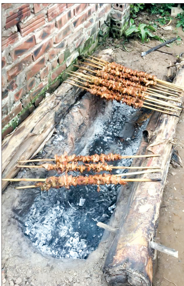
Thịt nướng, còn gọi là “thịt đốt”.

Cỗ cưới ở miền Bắc về cơ bản giống nhau, tuy vậy có một số món có hương vị đặc trưng riêng của vùng quê. Nói đến cỗ cưới làng tôi thì không thể thiếu được món thịt nướng, còn gọi là “thịt đốt”. Nếu thiếu món này thì không còn gọi là cỗ làng tôi. Thịt được tẩm ướp (riêng, sả, mè...) từ ba mươi phút đến một tiếng, xiên bằng que tre tươi, đặc biệt là trước khi nướng phải “đào hố” xuống đất, rồi đốt củi cho than hoa vào hố để nướng. Làm vậy để không bị mất nhiệt, thịt chín đỏ đều không bị cháy, quện được mùi khói của than củi nên luôn có vị khác biệt. Chẳng biết món này có từ bao giờ nhưng đến nay vẫn không thể thiếu trên mỗi mâm cỗ.