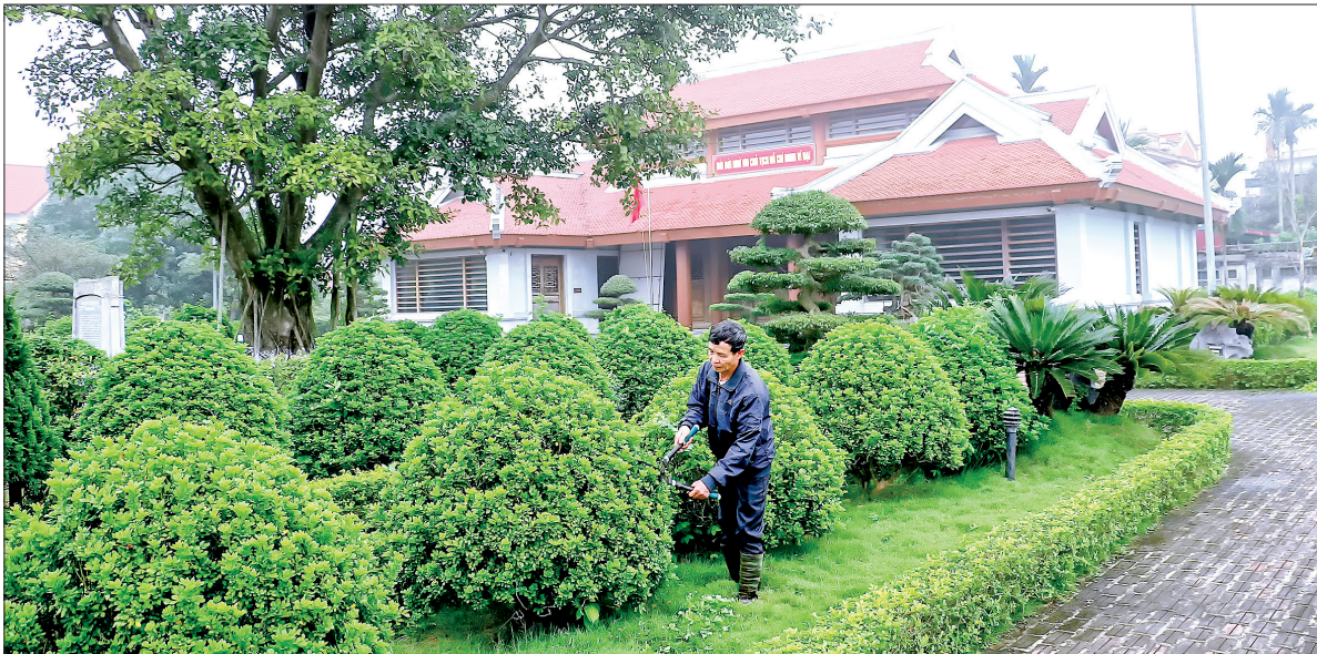
Khu lưu niệm Bác Hồ tại xã Tân Hòa (Vũ Thư) - nơi Chủ tịch Hồ Chí Minh đã làm việc với Ban Thường vụ Tỉnh ủy Thái Bình và nghỉ lại một đêm ngày 31/12/1966.

Cuộc thi tìm hiểu “Bác Hồ với Thái Bình - Thái Bình thực hiện Di chúc của Bác” và cuộc thi viết về “Người Thái Bình, đất Thái Bình” do Ban Thường vụ Tỉnh ủy tổ chức đã thành công tốt đẹp. Gần 210.000 bài dự thi và 222 tác phẩm được gửi về ban tổ chức cuộc thi các cấp đã minh chứng đây thực sự là đợt sinh hoạt chính trị sâu rộng, có ý nghĩa thiết thực, thu hút sự quan tâm, tham gia của đông đảo cán bộ, đảng viên và các tầng lớp nhân dân. Đây cũng là hoạt động thiết thực kỷ niệm 50 năm thực hiện Di chúc của Chủ tịch Hồ Chí Minh (1969 - 2019), 90 năm ngày thành lập Đảng Cộng sản Việt Nam (3/2/1930 - 3/2/2020), 130 năm ngày thành lập tỉnh (21/3/1890 - 21/3/2020) và 130 năm ngày sinh Chủ tịch Hồ Chí Minh (19/5/1890 - 19/5/2020).