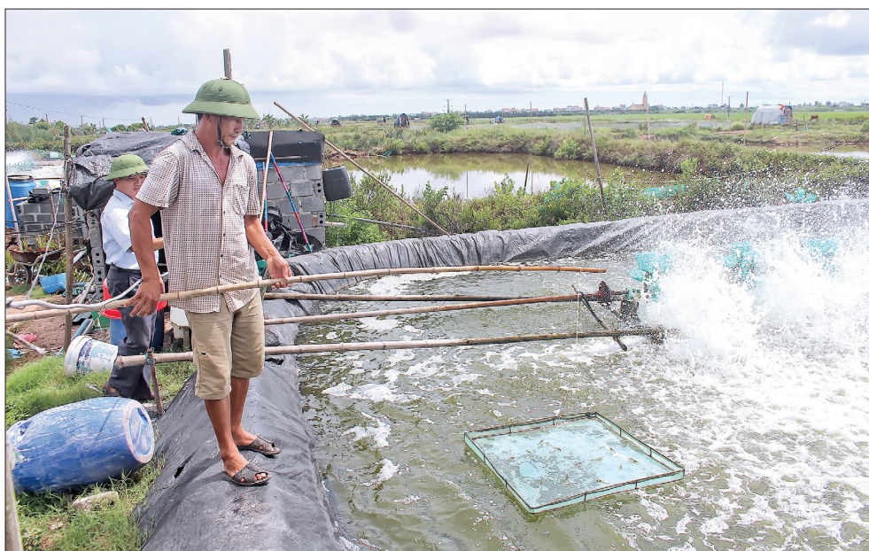
Thâm canh tôm thẻ chân trắng với 4 - 5 vụ/năm, cho năng suất 30 - 40 tấn/ha.

Làm theo lời Bác dạy, sau 62 năm, nông nghiệp Thái Bình tiếp tục phát triển khá toàn diện, luôn là “trụ đỡ” trong lĩnh vực kinh tế. Sự tăng trưởng của ngành Nông nghiệp đã có tác động rất lớn tới việc bảo đảm an sinh xã hội. Sản xuất nông nghiệp đã chuyển từ lượng sang chất, tích cực đưa các giống lúa chất lượng cao vào sản xuất, hướng tới xây dựng nền kinh tế nông nghiệp bền vững. Đáng chú ý, lĩnh vực nông nghiệp đã phát triển theo hướng khai thác tốt tiềm năng và lợi thế của từng địa phương; đồng thời tập trung nâng cao chất lượng, hiệu quả sản xuất theo quy mô lớn, ứng dụng kỹ thuật, công nghệ mới vào sản xuất; chuyển đổi cơ cấu cây trồng, vật nuôi phù hợp với điều kiện từng vùng cũng như nhu cầu của thị trường. Mô hình sản xuất theo chuỗi giá trị bước đầu được hình thành và nhân ra diện rộng, thúc đẩy kinh tế nông nghiệp