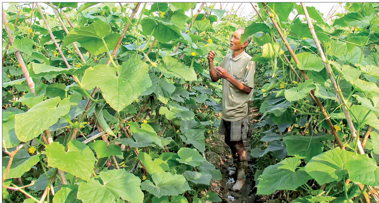
Nông dân huyện Quỳnh Phụ phát triển nhiều mô hình sản xuất cho giá trị kinh tế cao.

Là tỉnh thuần nông có xuất phát điểm thấp, hệ thống cơ sở hạ tầng nông thôn còn thiếu và chưa đồng bộ, năm 2010, toàn tỉnh có 267 xã trong diện xây dựng NTM. Trong đó, số tiêu chí đạt chuẩn bình quân là 5 tiêu chí/xã; toàn tỉnh chưa có xã nào đạt từ 15 - 19 tiêu chí; có 24 xã đạt từ 10 - 14 tiêu chí; 123 xã đạt từ 5 - 9 tiêu chí; 120 xã đạt dưới 5 tiêu chí. Điều kiện kinh tế của người dân còn nhiều khó khăn, tỷ lệ hộ nghèo cao với 9,91%; thu nhập bình quân đầu người còn thấp với 13,55 triệu đồng/người/năm. Hướng ứng phong trào thi đua cả nước chung sức xây dựng NTM, tỉnh Thái Bình đã ban hành các quyết định, cơ chế, chính sách, kế hoạch tổ chức thực hiện phù hợp với tình hình thực tiễn và yêu cầu xây dựng NTM của từng giai đoạn; tập trung chỉ đạo các cấp, các ngành, các địa phương trong tỉnh phát huy sức mạnh của cả hệ thống chính trị, khơi dậy tinh thần thi đua yêu nước của các tầng lớp nhân dân và huy động nguồn lực tham gia xây dựng NTM của các thành phần kinh tế. Bám sát sự chỉ đạo của cấp trên, các địa phương trong tỉnh đã phát huy tính chủ động, sáng tạo, cụ thể hóa chủ trương, chính sách của cấp ủy, chính quyền các cấp thành các đề án, chương trình hành động, tập trung triển khai thực hiện các giải pháp mang tính đột phá.