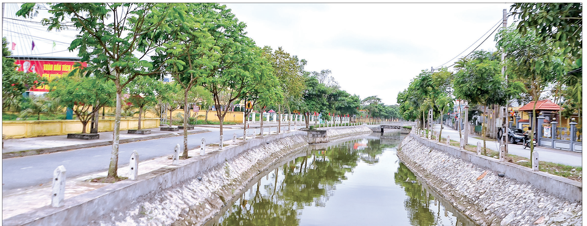
Diện mạo nông thôn mới nâng cao xã Đông Phương (Đông Hưng).

Phát huy kết quả đã đạt được, trong thời gian tới, mỗi cán bộ, đảng viên và người dân Thái Bình tiếp tục vận dụng tốt bài học về tinh thần đoàn kết, quyết tâm xây dựng Thái Bình trở thành tỉnh gương mẫu về mọi mặt như Bác Hồ hằng mong.