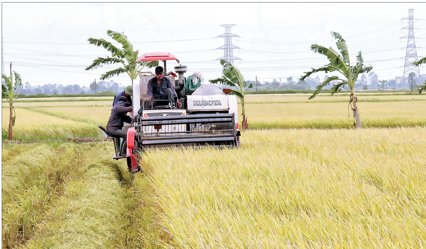
Năng suất lúa của Thái Bình ổn định 132 tạ/ha/năm.

Bác Hồ từng căn dặn: “Các chiến sĩ ở ngoài mặt trận phải có đủ vũ khí, phải nắm vững chiến thuật để đánh thắng giặc Mỹ xâm lược. Trên mặt trận sản xuất, cán bộ và xã viên phải nắm vững kỹ thuật canh tác để thâm canh tăng năng suất. Muốn tăng năng suất, trước hết phải làm tốt thủy lợi, phải nhiều phân bón. Phân bón thì có thứ phân bón sẵn có, chỉ cần ta xúc lấy là được, như bùn, nước phù sa. Nhưng phân chuồng vẫn là loại phân bón tốt nhất. Muốn có nhiều phân chuồng thì phải chăn nuôi tốt, nhất là nuôi lợn. Có đủ nước, nhiều phân rồi, lại còn phải chọn giống tốt, phải phòng, trừ sâu bệnh thì mới thu hoạch được nhiều”. Lời dạy của Bác chính là động lực để nông dân Thái Bình phấn đấu thi đua lao động sản xuất, vượt qua mọi khó khăn, gian khổ, thiên tai, địch họa, giành thắng lợi toàn diện trên mặt trận nông nghiệp khi ghi bảng vàng năng suất lúa 5 tấn thóc/ha (năm 1966), đánh dấu mốc lịch sử về năng suất lúa của miền Bắc, được Bác gửi thư khen.