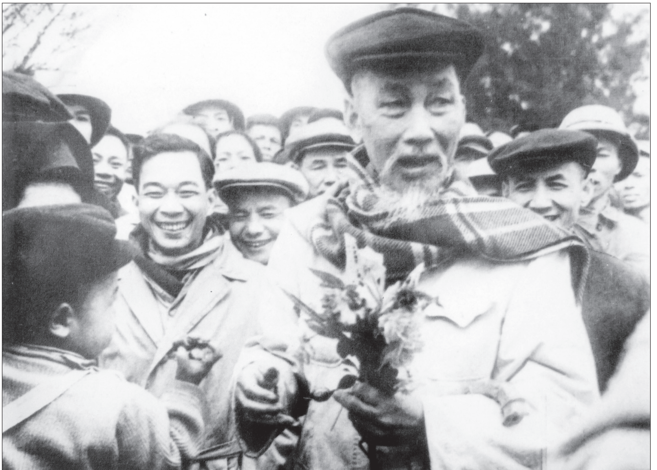
Đồng bào, cán bộ Thái Bình phấn khởi chào đón Chủ tịch Hồ Chí Minh về thăm và chúc Tết đầu năm, ngày 1/1/1967.

đức, phong cách Hồ Chí Minh; tích cực tham gia các hoạt động giáo dục truyền thống yêu nước, cách mạng, khơi gọi tinh thần yêu nước trong thanh thiếu niên, nhi đồng, đồng viên thế hệ trẻ cố gắng học tập, trau dồi kiến thức, đóng góp công sức, trí tuệ xây dựng và bảo vệ vững chắc Tổ quốc Việt Nam xã hội chủ nghĩa.