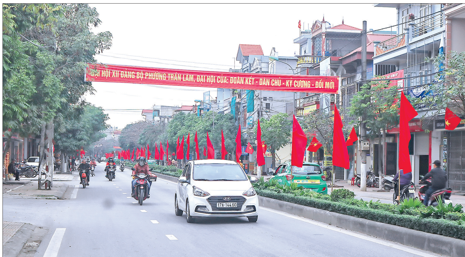
Không khí chào mừng đại hội điểm cấp cơ sở của thành phố Thái Bình.

Thời gian qua, các cấp ủy trong tỉnh đã tập trung lãnh đạo, chỉ đạo khẩn trương tổ chức đại hội đảng bộ cấp cơ sở nhiệm kỳ 2020 - 2025, tiến tới Đại hội đại biểu Đảng bộ tỉnh lần thứ XX bảo đảm đúng quy trình, quy định, mang tinh thần đổi mới, nghiêm túc, dân chủ và trí tuệ.