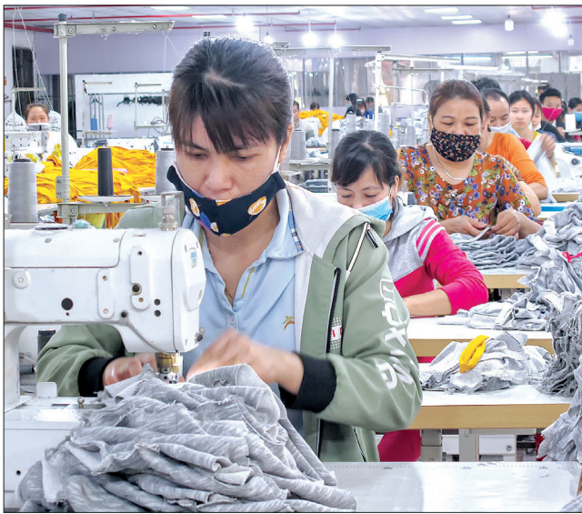
Công ty TNHH May công nghiệp Khánh Duy (cụm công nghiệp Quỳnh Giao, Quỳnh Phụ) tạo việc làm cho nhiều lao động địa phương.

Sinh thời, Chủ tịch Hồ Chí Minh từng khẳng định: “Đoàn kết, đoàn kết, đại đoàn kết - Thành công, thành công, đại thành công”. Đoàn kết cũng là tư tưởng xuyên suốt trong quá trình hoạt động cách mạng của Người. Thấm nhuần tư tưởng đoàn kết của Chủ tịch Hồ Chí Minh, trong những năm qua, Đảng bộ và nhân dân Thái Bình đã phát huy sức mạnh khối đại đoàn kết toàn dân nỗ lực vượt qua mọi khó khăn, thách thức và đạt được những thành tựu rất đáng tự hào.