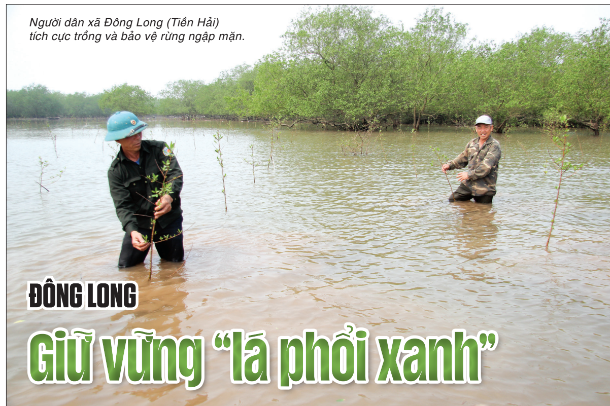
Người dân xã Đông Long (Tiền Hải) tích cực trồng và bảo vệ rừng ngập mặn.