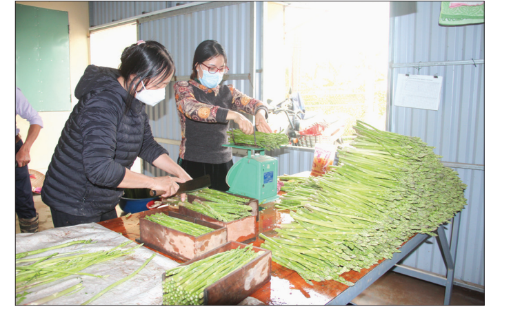
Sản phẩm măng tây của HTX nông nghiệp hữu cơ Quỳnh Phú được công nhận sản phẩm OCOP 3 sao năm 2021.