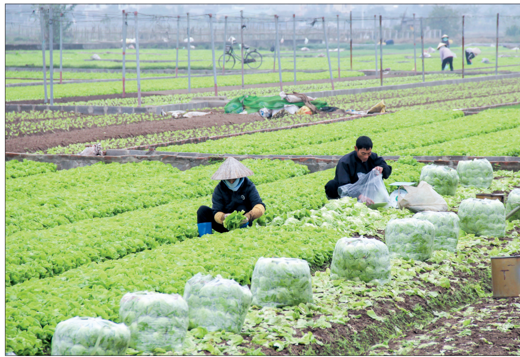
Vùng trồng rau xà lách xoăn - sản phẩm OCOP 3 sao của HTX SXKD nông nghiệp xanh xã Trung An (Vũ Thư).

Sản phẩm gạo sạch của Công ty Cổ phần Vi sinh Michiannai có thương hiệu “gạo sạch Thái Bình 3T”. Đây là sản phẩm OCOP 4 sao của tỉnh được tiêu thụ ở nhiều tỉnh, thành phố như Hà Nội, Quảng Ninh... và có mặt ở các siêu thị lớn với sản lượng đạt trên 200 tấn/năm, qua đó giúp nhiều lao động địa phương có việc làm và thu nhập ổn định. Để viết lên CCSP ý nghĩa, chủ thể sản phẩm đã khéo léo dẫn dắt khách hàng đến với Thái Bình qua hình ảnh “quê hương 5 tấn” để từ đó bộc bạch tâm ý của mình đối