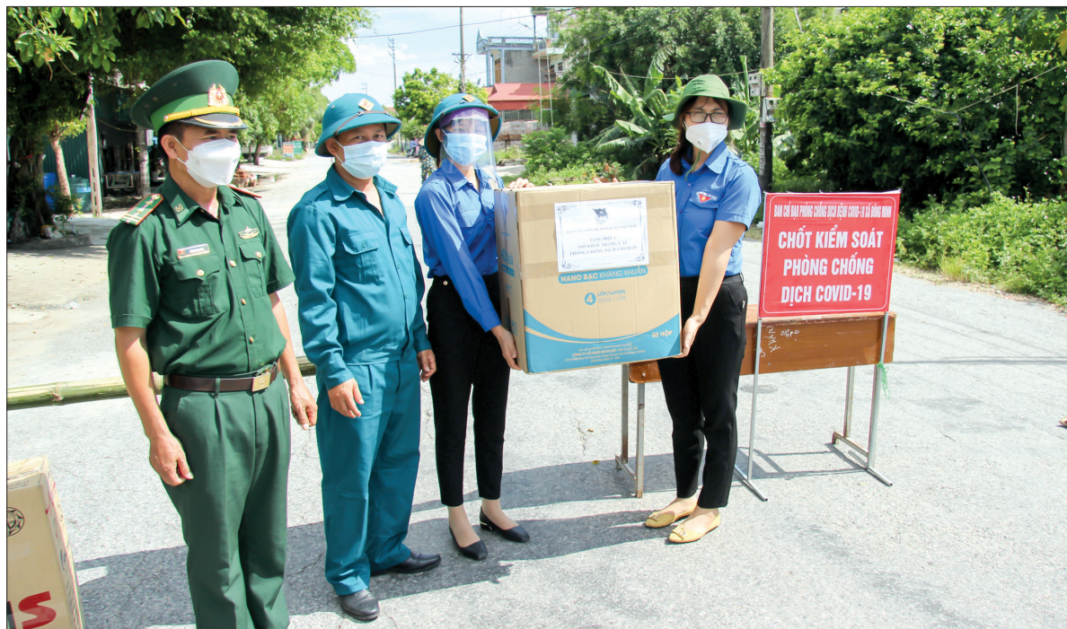
Đoàn Thanh niên huyện Tiên Hải tặng thiết bị y tế cho khu vực cách ly tại thôn Thanh Lâm, xã Đông Minh.

Những ngày qua, để bảo đảm an ninh trật tự và sản xuất nông nghiệp cho 47 hộ dân thôn Thanh Lâm, xã Đông Minh thực hiện cách ly y tế phòng, chống dịch Covid-19, huyện Tiên Hải đã chỉ đạo cấp ủy, chính quyền, các đoàn thể hỗ trợ người dân trong quá trình sản xuất, bảo đảm cuộc sống diễn ra bình thường.