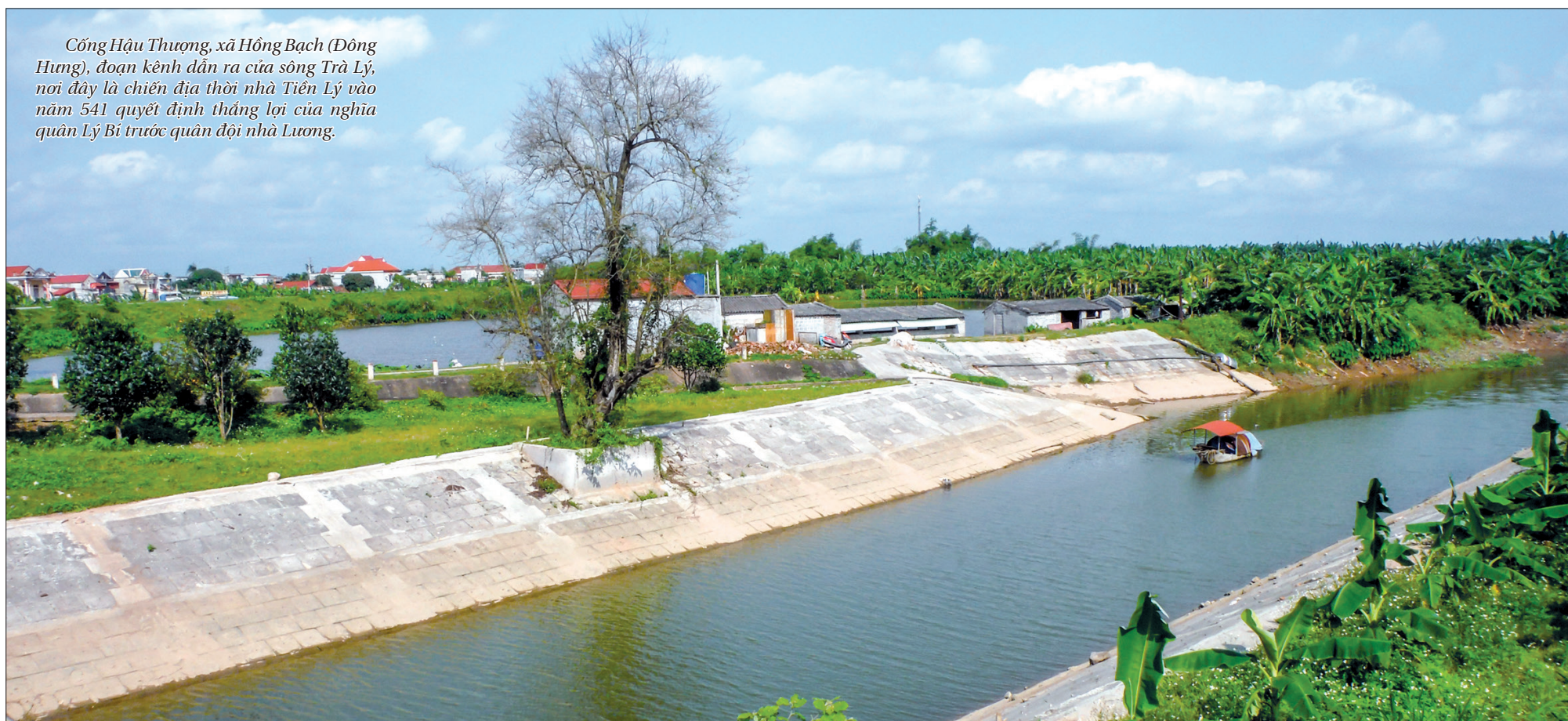
Cống Hậu Thượng, xã Hồng Bạch (Đông Hưng), đoạn kênh dẫn ra cửa sông Trà Lý, nơi đây là chiến địa thời nhà Tiên Lý vào năm 541 quyết định thắng lợi của nghĩa quân Lý Bí trước quân đội nhà Lương.