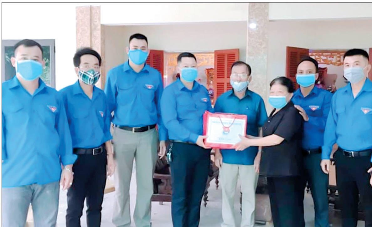
Thành đoàn Thái Bình trao quà cho cựu thanh niên xung phong phường Hoàng Diệu.

Phát huy đạo lý truyền thống “Uống nước nhớ nguồn”, những năm qua, các cấp ủy đảng, chính quyền, các ban, ngành, đoàn thể thành phố Thái Bình đã nỗ lực làm tốt công tác chăm lo đời sống người có công.