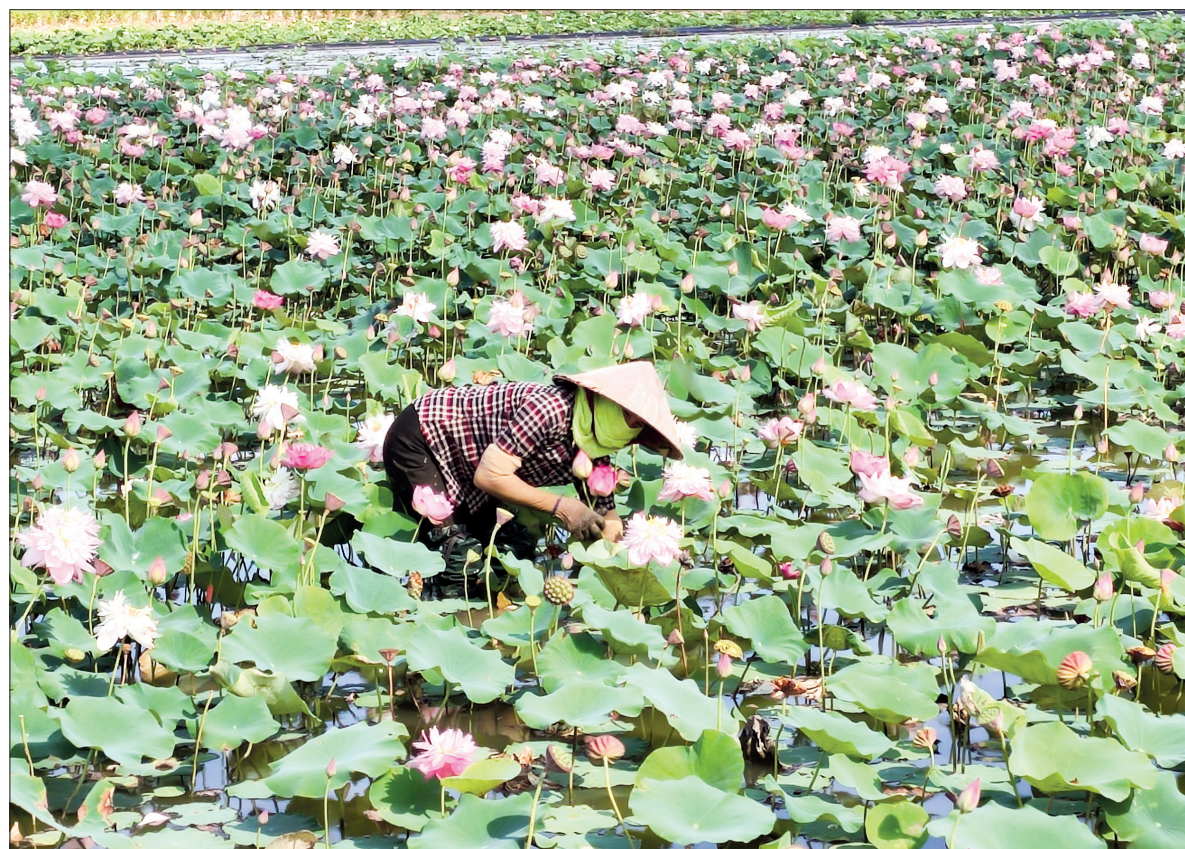
Thu hoạch hoa.

Với hướng đi đúng và áp dụng tiến bộ khoa học công nghệ vào sản xuất, tin rằng mô hình chuyển đổi đất trũng sản xuất kém hiệu quả sang trồng sen của HTX Hoa sen Vân Đài sẽ ngày càng mang lại hiệu quả cao, đóng góp và sự phát triển chung của xã hội.