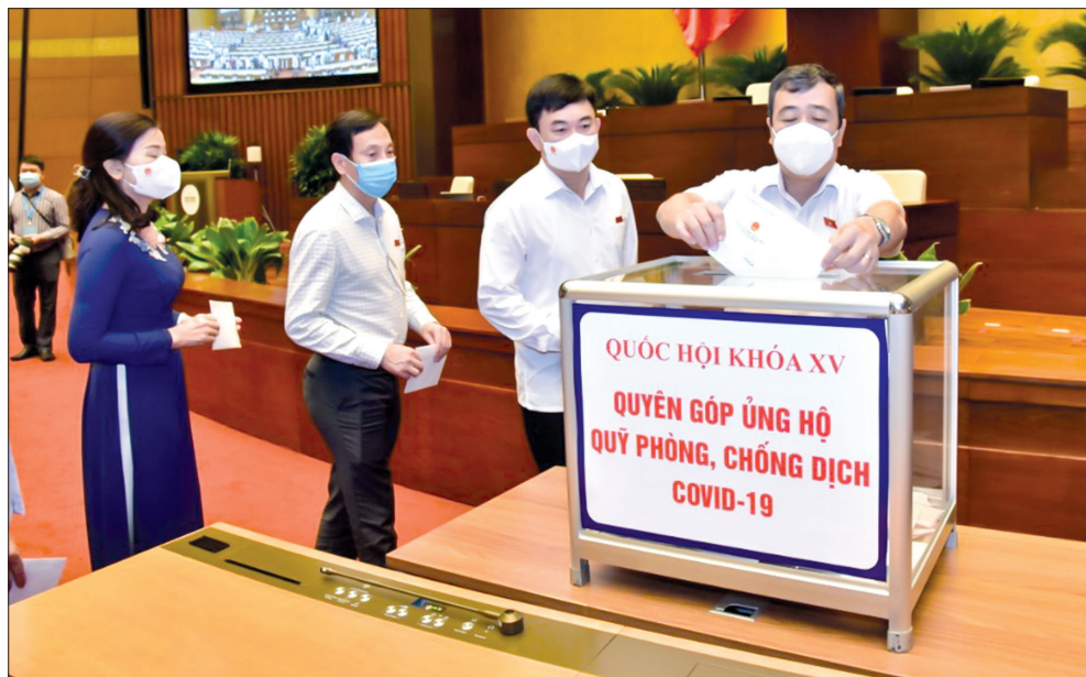
Các vị đại biểu Quốc hội quyền góp ủng hộ Quỹ phòng, chống dịch Covid-19.

● Phát động quyền góp ủng hộ Quỹ phòng, chống dịch Covid-19