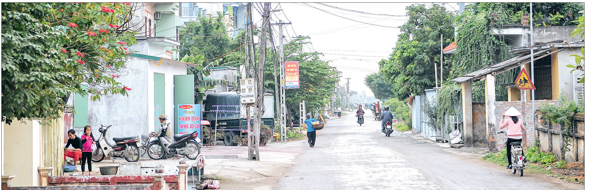
Làng quê Vũ Hội.