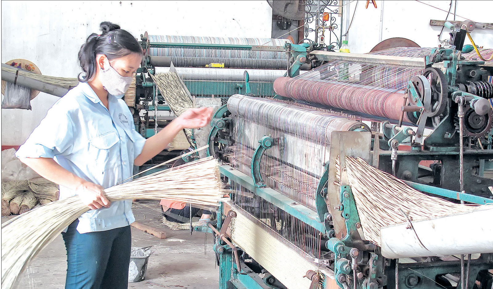
Nghề dệt chiếu cói ở xã An Vũ (Quỳnh Phụ).

Những năm qua, Đảng bộ tỉnh đã thực hiện nhiều giải pháp nâng cao năng lực lãnh đạo, sức chiến đấu của tổ chức cơ sở đảng (TCCSD). Với cách làm quyết liệt, bám sát cơ sở, rõ người, rõ việc đã tạo chuyển biến mạnh mẽ trong công tác xây dựng Đảng, thúc đẩy kinh tế - xã hội phát triển.