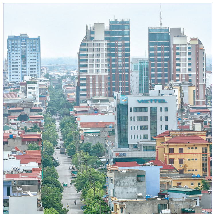
Thành phố Thái Bình.

Mỗi dịp kỷ niệm Cách mạng Tháng Tám thành công và Quốc khánh 2/9 là cơ hội để cán bộ, chiến sĩ biên phòng cùng nhau ôn lại truyền thống cách mạng hào hùng của dân tộc. Chúng tôi tự hào là người lính quân hàm xanh tiếp nối thế hệ cha anh đi trước làm nhiệm vụ bảo vệ vững chắc, toàn vẹn chủ quyền an ninh biên giới quốc gia hôm nay và mai sau. Chúng tôi tự nhắc nhở bản thân phải luôn cố gắng, nỗ lực hoàn thành xuất sắc nhiệm vụ được Đảng, Nhà nước và nhân dân giao phó, phát huy truyền thống của bộ đội biên phòng, xứng đáng với vai trò là lực lượng nòng cốt, xung kích trong thực hiện nhiệm vụ bảo vệ chủ quyền, an ninh biên giới quốc gia, góp phần xây dựng khu vực biên giới nói chung, khu vực biên giới biển của tỉnh nói riêng ngày càng giàu đẹp, xây dựng nền biên phòng toàn dân ngày càng vững mạnh.