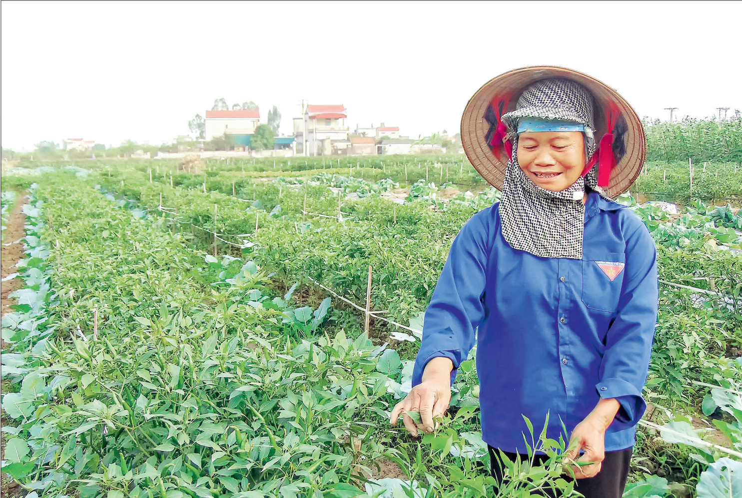
Nông dân xã An Quý (Quỳnh Phụ) nâng cao thu nhập nhờ trồng cây màu.

Thời gian qua, công tác dân vận của cơ quan nhà nước các cấp trên địa bàn tỉnh có nhiều đổi mới, qua đó góp phần tạo chuyển biến trong nhận thức và hành động của cán bộ, công chức, viên chức trong quá trình thực thi nhiệm vụ, phục vụ nhân dân ngày càng tốt hơn.