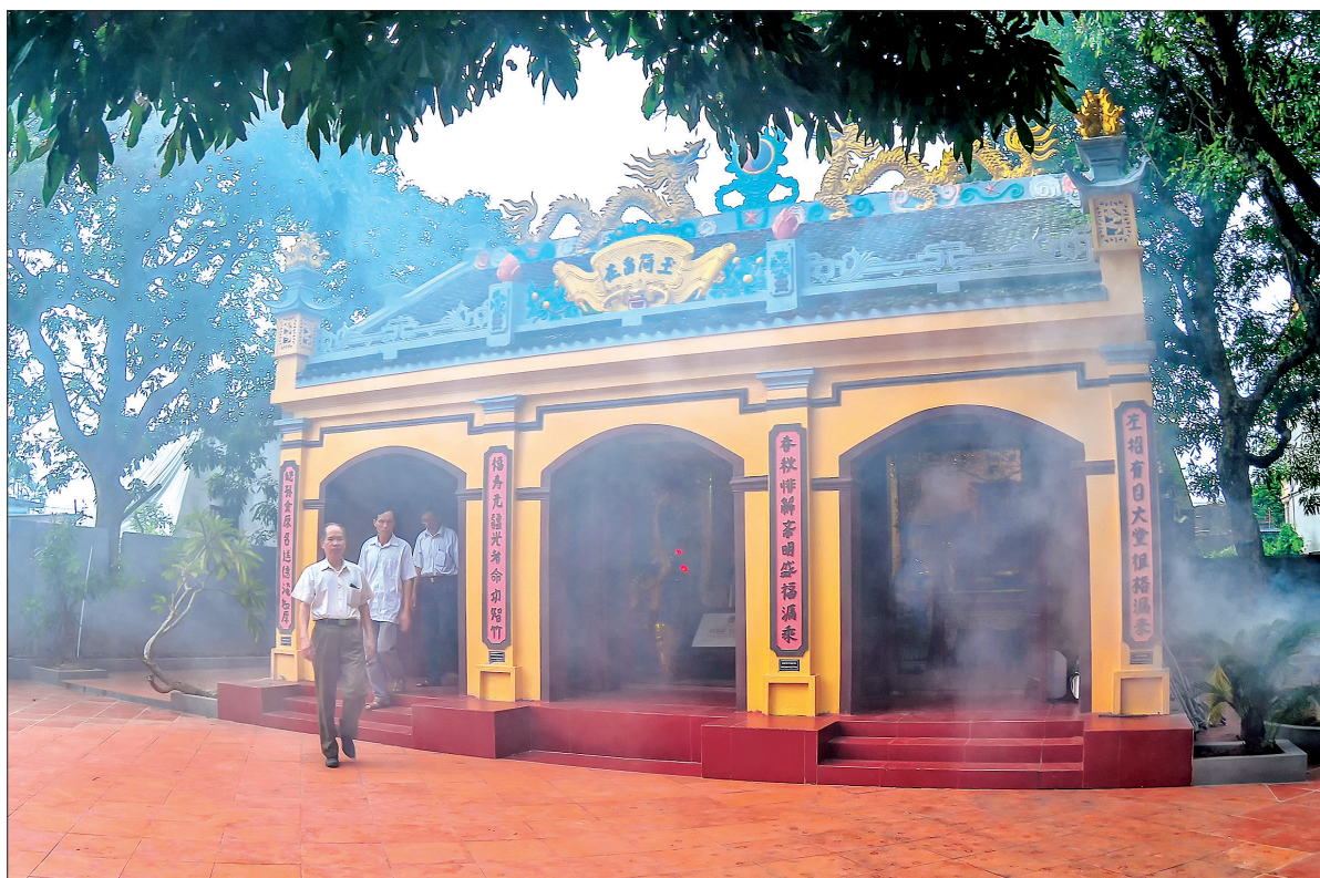
Từ đường chi họ Phạm làng Thư Điền, xã Tây Giang, huyện Tiên Hải có đắp nổi 4 chữ "Hội thống tôn Nguyên".