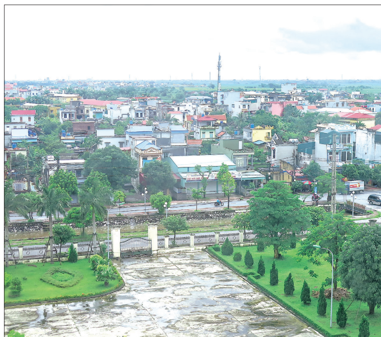
Một góc thị trấn Thanh Nê (Kiến Xương).