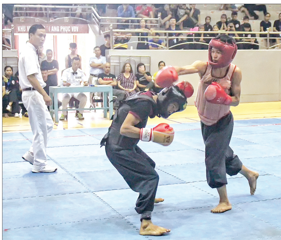
Giải thi đấu võ thuật năm 2018.

Lời kêu gọi của Bác là nguồn động viên to lớn đối với phong trào TDTT nước ta. Để sau hơn 70 năm xây dựng và trưởng thành, TDTT nước ta ngày càng đạt được nhiều thành tích to lớn, góp phần quan trọng thực hiện thắng lợi các nhiệm vụ của đất nước. Không nằm ngoài guồng quay phát triển của TDTT cả nước, qua từng giai đoạn, TDTT Thái Bình đã có sự chuyển mình mạnh mẽ, vươn lên bứt phá với những thành tích nổi bật. Tổ chức bộ máy TDTT tỉnh sớm được thành lập ngay sau khi cuộc kháng chiến chống thực dân Pháp kết thúc, miền Bắc đi lên xây dựng chủ nghĩa xã hội. Tiếp đó, năm 1960, Ban Thể dục Thể thao tỉnh ra đời. Đến năm 1982, Sở Thể dục Thể thao được thành lập, có bộ máy từ tỉnh, huyện đến cấp xã và chính thức sáp nhập với Sở Văn hóa Thông tin vào năm 1992. Sự ra đời và phát triển của hệ thống tổ chức đã tạo đòn bẩy