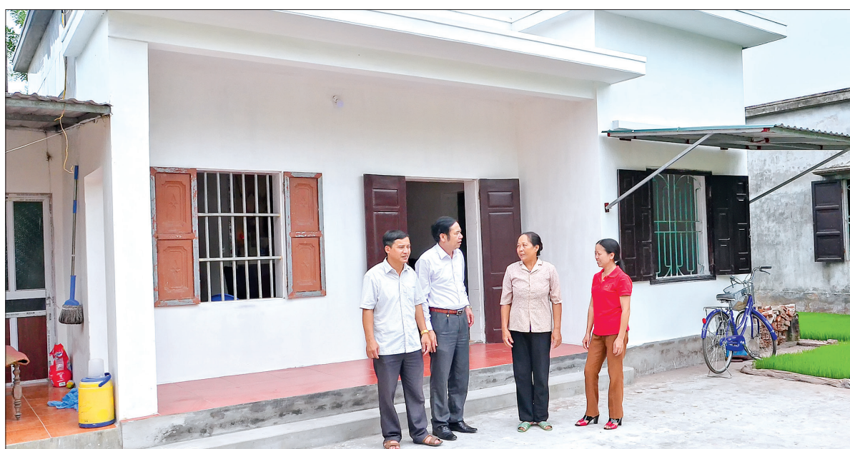
Nhiều gia đình người có công được quan tâm hỗ trợ cải thiện nhà ở, nâng cao chất lượng cuộc sống.

Trong những năm qua, hầu hết người có công đã được hưởng đúng, đầy đủ các chính sách ưu đãi của Nhà nước; phạm vi, đối tượng thuộc diện hưởng chính sách ngày càng được mở rộng; chế độ trợ cấp, phụ cấp ưu đãi từng bước được cải thiện. Các phong trào “Đền ơn đáp nghĩa”, “Phụng dưỡng Bà mẹ Việt Nam anh hùng”, “Xã, phường, thị trấn làm tốt công tác thương binh, liệt sĩ”... được phát triển sâu rộng ở các địa phương, nhằm phát huy mọi nguồn lực trong xã hội, cộng đồng, cùng Nhà nước chăm sóc tốt hơn đời sống vật chất, tinh thần của người có công với cách mạng. Việc rà soát thực hiện chính sách ưu đãi người có công với cách mạng được tiến hành thường xuyên nhằm bảo đảm chính xác, công bằng giữa các đối tượng thụ hưởng. Tính đến nay, toàn tỉnh có gần 40 vạn người được xác nhận và giải quyết chính sách, có trên 70.000 người có công và thân nhân người có công đang hưởng trợ cấp ưu đãi thường xuyên. Trong việc giải quyết hồ sơ người có công xác lập mới, 5 năm (2012 - 2017) thực hiện Pháp lệnh Ưu đãi người có công với cách mạng, toàn tỉnh đã xác nhận và giải quyết trên 15.000