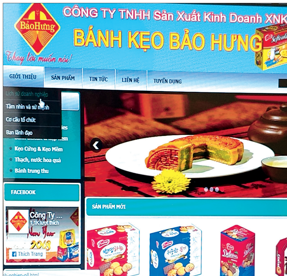
Công ty TNHH Sản xuất kinh doanh xuất nhập khẩu bánh kẹo Bảo Hưng tích cực ứng dụng thương mại điện tử vào hoạt động của doanh nghiệp.

Để thúc đẩy TMĐT phát triển, thời gian qua, Phòng Xuất nhập khẩu (Sở Công Thương) phối hợp với các cơ quan chức năng đẩy mạnh công tác tuyên truyền, phổ biến, giáo dục pháp luật với nhiều hình thức. Năm 2017 và 8 tháng đầu năm 2018, đơn vị đã tổ chức 6 hội nghị tuyên truyền pháp luật về TMĐT cho trên 1.200 doanh nghiệp, cơ sở sản xuất, kinh doanh, chủ cửa hàng; phát hành sổ tay TMĐT nhằm thông tin tới doanh nghiệp vai trò, lợi ích của TMĐT. Mở 4 khóa tập huấn về