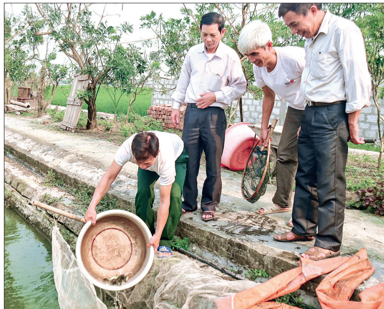
Mô hình nuôi cá giống nước ngọt của hội viên cựu chiến binh xã An Ninh (Quỳnh Phụ).

Không chỉ gương mẫu phát triển kinh tế, hội viên hội CCB từ tỉnh tới cơ sở luôn chấp hành tốt mọi chủ trương của Đảng, chính sách, pháp luật của Nhà nước. Các cấp hội CCB trong