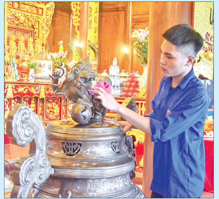
Lau dọn trong Đền thờ Liệt sĩ tỉnh.