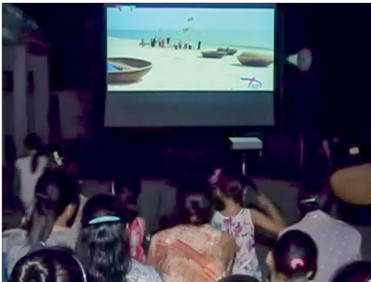
Người dân nông thôn xem chiếu phim lưu động.

Đổi mới, nâng cao chất lượng để có được chỗ đứng trong khán giả, thời gian tới, cùng với việc tổ chức thường xuyên các đợt chiếu phim lưu động, duy trì 12 buổi chiếu/tháng, Trung tâm Phát hành phim và Chiếu bóng sẽ tăng cường hơn nữa số lượng buổi chiếu phim vào các ngày kỷ niệm, ngày lễ của đất nước đồng thời lựa chọn công chiếu những bộ phim mới, đặc sắc để đáp ứng kịp thời nhu cầu giải trí của người dân.