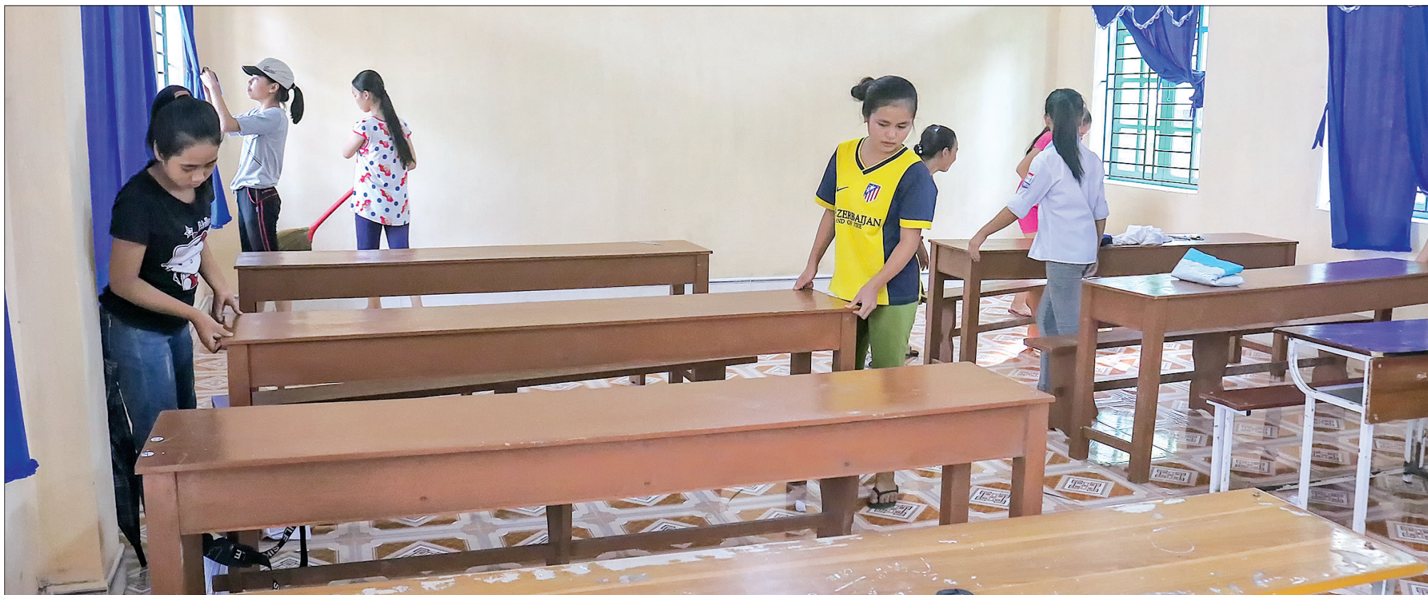
Học sinh Trường THCS Phương Công (Tiên Hải) vệ sinh trường lớp.

Đến thời điểm này, công tác chuẩn bị cơ sở vật chất, trang thiết bị phục vụ giảng dạy và học tập trên địa bàn tỉnh đã được chuẩn bị chu đáo, sẵn sàng đón năm học mới với quyết tâm và nỗ lực cao nhất.