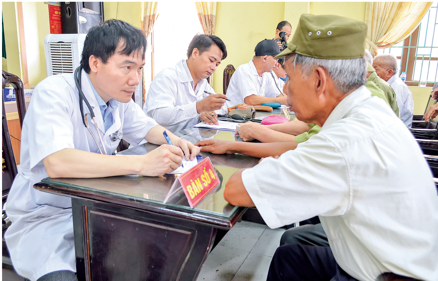
Hội Đông y huyện Đông Hưng khám bệnh cho đối tượng chính sách xã Đông Quang.