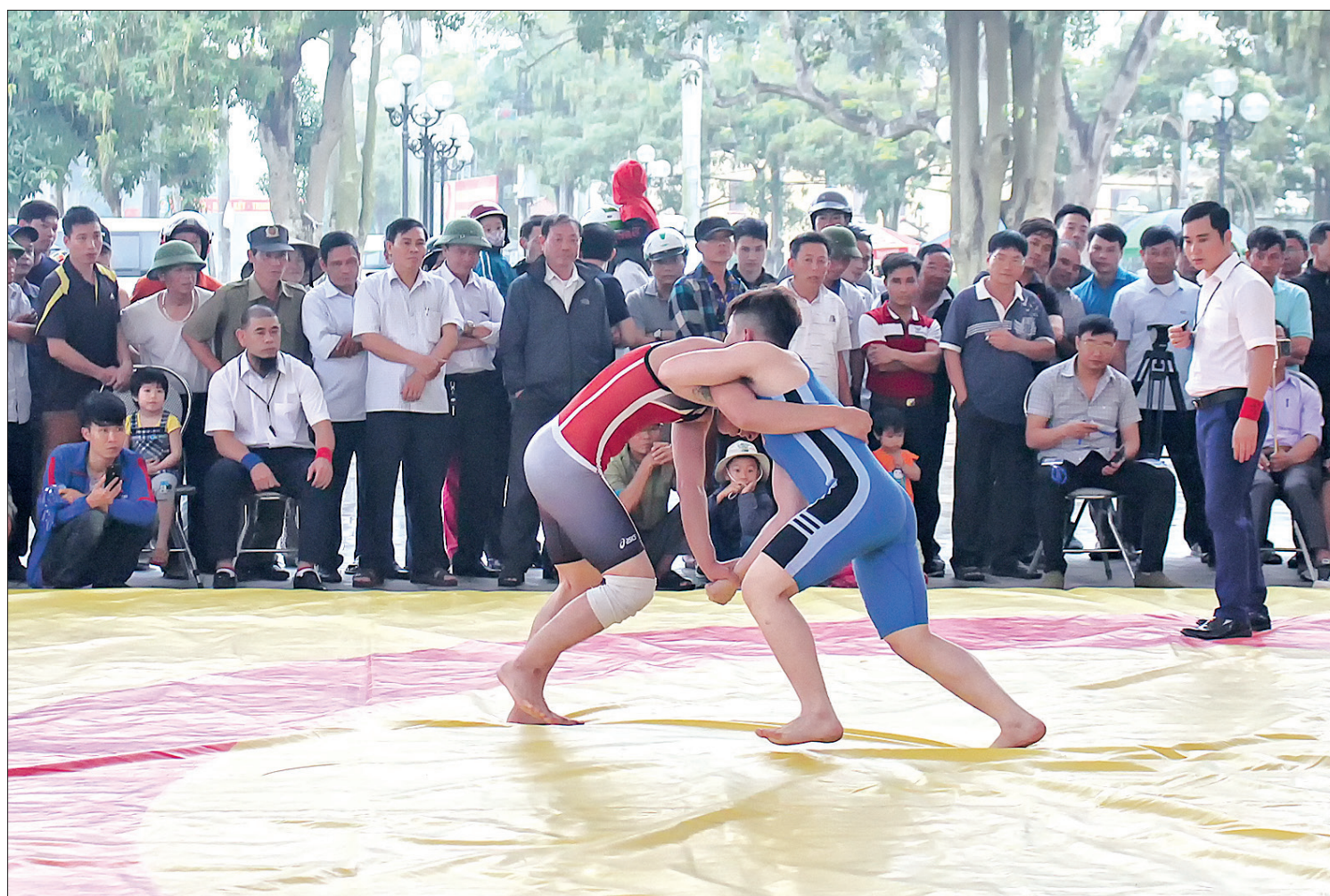
Các vận động viên tham gia giải vật tự do năm 2018.

Cách mạng Tháng Tám thành công, sau nhiệm vụ cấp bách diệt giặc đói, giặc dốt, giặc ngoại xâm, Chủ tịch Hồ Chí Minh dành sự quan tâm tới phong trào thể dục thể thao (TDTT), rèn luyện sức khỏe cho nhân dân. Không chỉ kêu gọi toàn dân luyện tập, Bác còn gương mẫu thực hiện trước. Đến nay, mỗi lời nói, hành động của Bác đã trở thành kim chỉ nam soi đường chỉ lối cho phong trào TDTT cả nước nói chung, Thái Bình nói riêng.