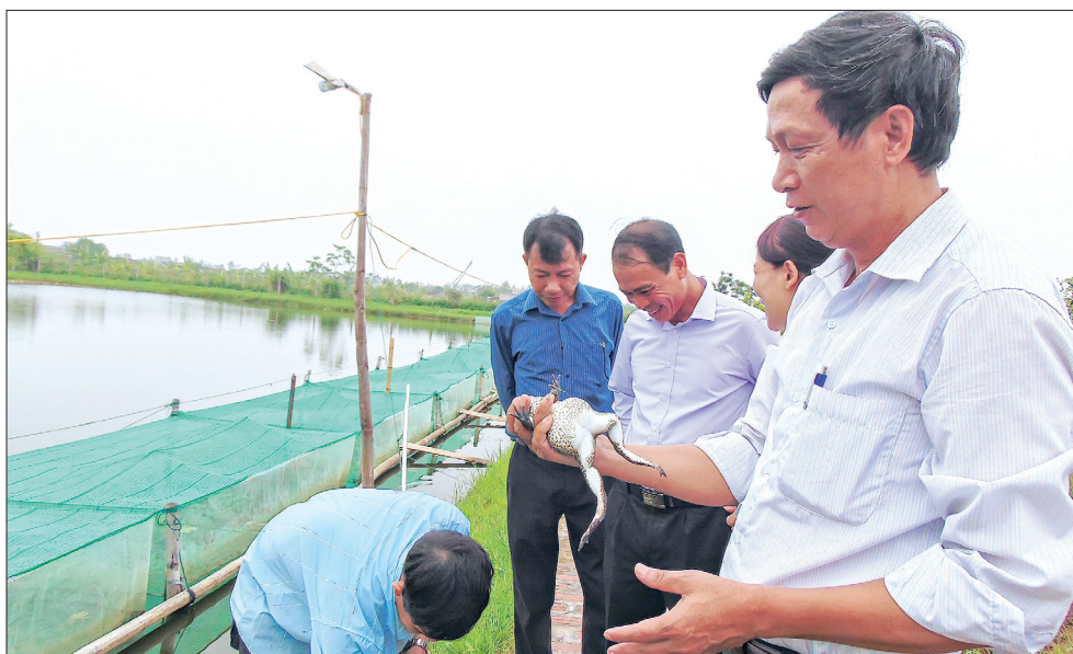
Lãnh đạo xã Đông Hoàng (Tiền Hải) thường xuyên thăm hỏi, động viên nhân dân phát triển kinh tế.