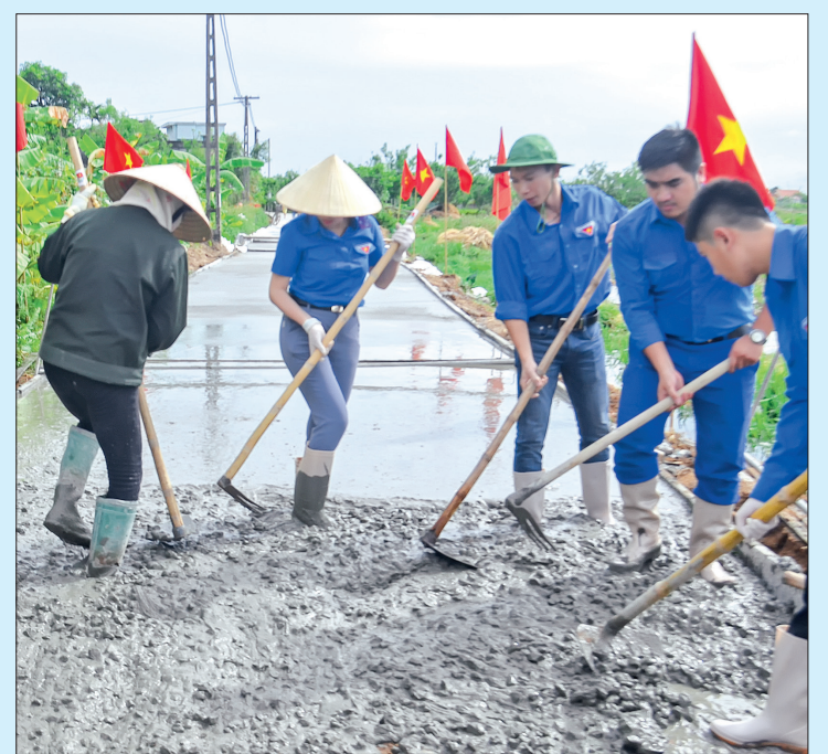
Tham gia bê tông hóa đoạn đường thanh niên thuộc xã Thái Dương (Thái Thụy).