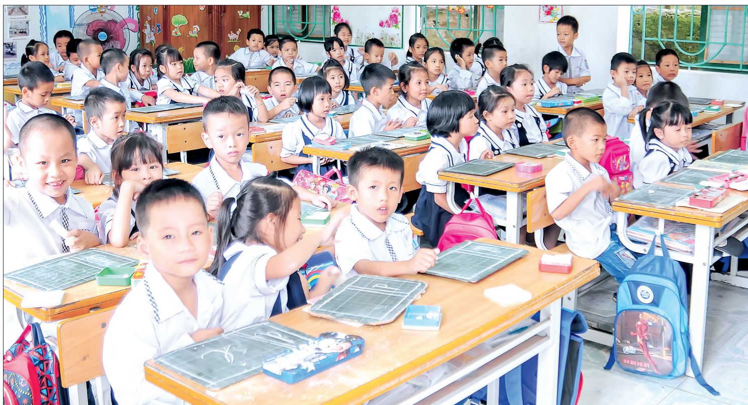
Học sinh Trường Tiểu học Trần Lâm (thành phố Thái Bình).

Kỳ nghỉ hè khép lại, cán bộ, giáo viên, học sinh toàn tỉnh náo nức bước vào năm học 2018 - 2019. Các địa phương đang gấp rút hoàn thành xây dựng, sửa chữa trường lớp... để chuẩn bị đón ngày khai giảng.