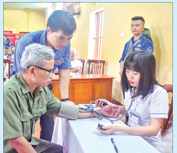
Khám bệnh miễn phí cho đối tượng chính sách xã Trạng Quan (Đông Hưng).