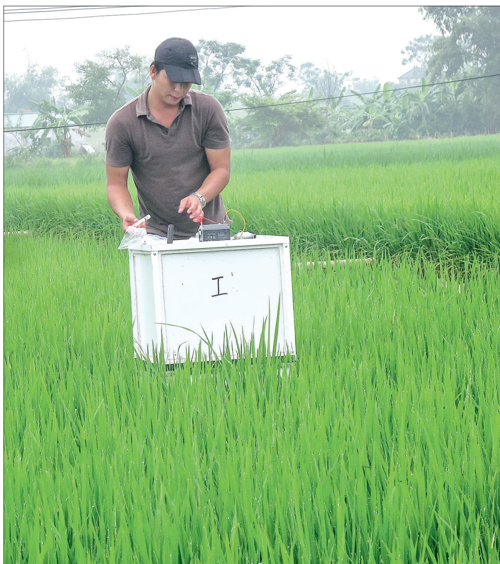
Cơ quan kiểm định độc lập đo lượng khí phát thải tại một điểm tham gia dự án.