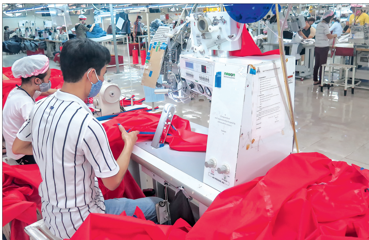
Nhiều doanh nghiệp may lớn hoạt động trên địa bàn huyện.

Là địa phương có bề dày lịch sử, văn hóa, truyền thống yêu nước, cách mạng, Kiến Xương hôm nay đang chuyển mình mạnh mẽ, đạt được nhiều thành tựu trên các lĩnh vực.