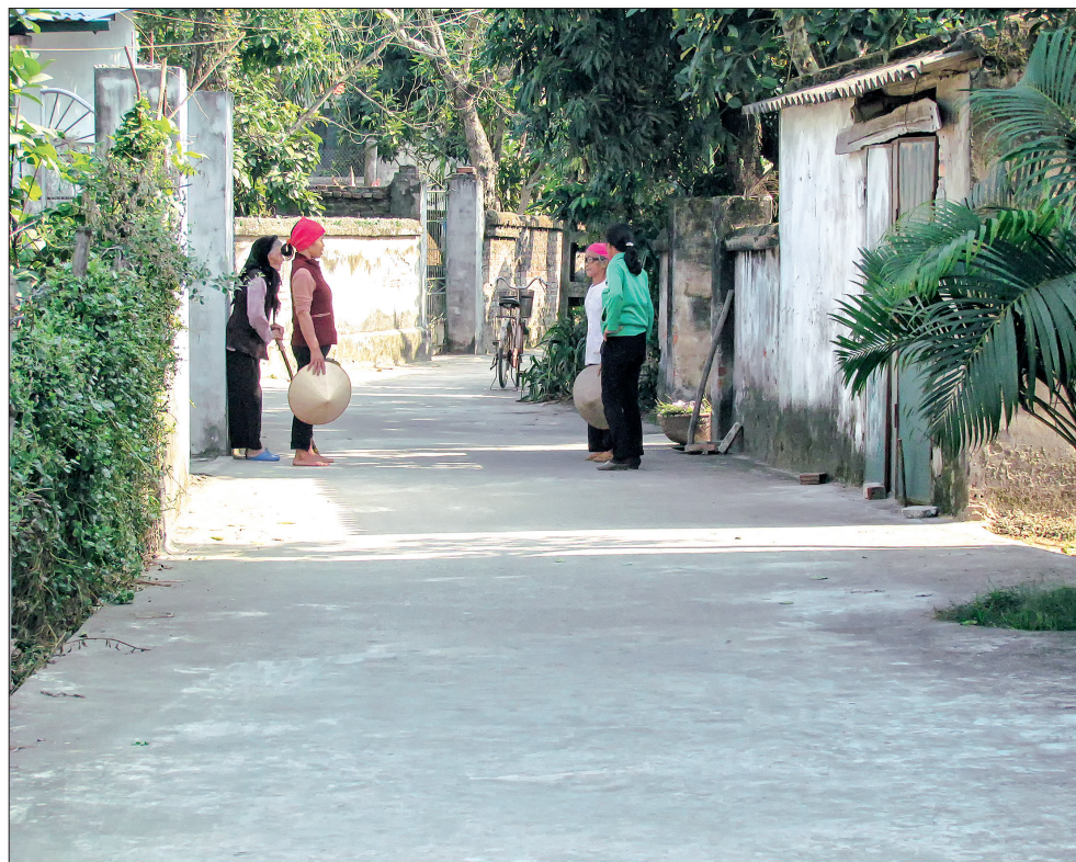
Đường nông thôn mới sạch, đẹp.

Với sự đồng lòng, quyết tâm của nhân dân trong huyện cùng với sự quan tâm của đảng bộ, chính quyền các cấp, nhất định Hưng Hà sẽ ngày càng phát triển và ghi thêm những mốc son mới.