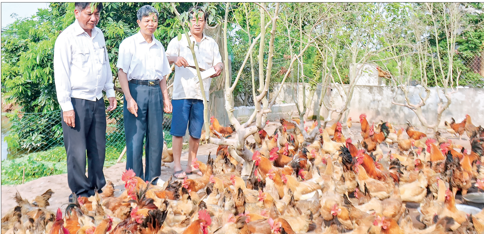
Mô hình chăn nuôi gà thương phẩm của hội viên cựu chiến binh xã Bình Định (Kiến Xương) đem lại hiệu quả kinh tế cao.

tỉnh nêu cao vai trò, trách nhiệm tham mưu cho cấp ủy, chính quyền địa phương triển khai, thực hiện tốt nhiệm vụ xây dựng nông thôn mới. Toàn hội có 1.964 cán bộ hội tham gia các tổ công tác đồn điền đổi thửa, tổ giám sát xây dựng công trình phúc lợi tại địa phương; 42.932 hộ tham gia đồn điền đổi thửa, chỉnh trang đồng ruộng đạt 99,6% tổng số hội viên tham gia sản xuất nông nghiệp. Do làm tốt công tác tuyên truyền, vận động ở các cấp hội, đến nay toàn tỉnh có 393 công trình phúc lợi tại cơ sở do CCB đóng góp xây dựng với tổng số tiền gần 40 tỷ đồng, chủ yếu là làm đường giao thông nông thôn, giao thông nội đồng... Ngoài ra, các cấp hội CCB đã vận động hơn 19.000 hội viên đóng góp hơn 83,4 tỷ đồng tiền mặt xây dựng nông thôn mới.