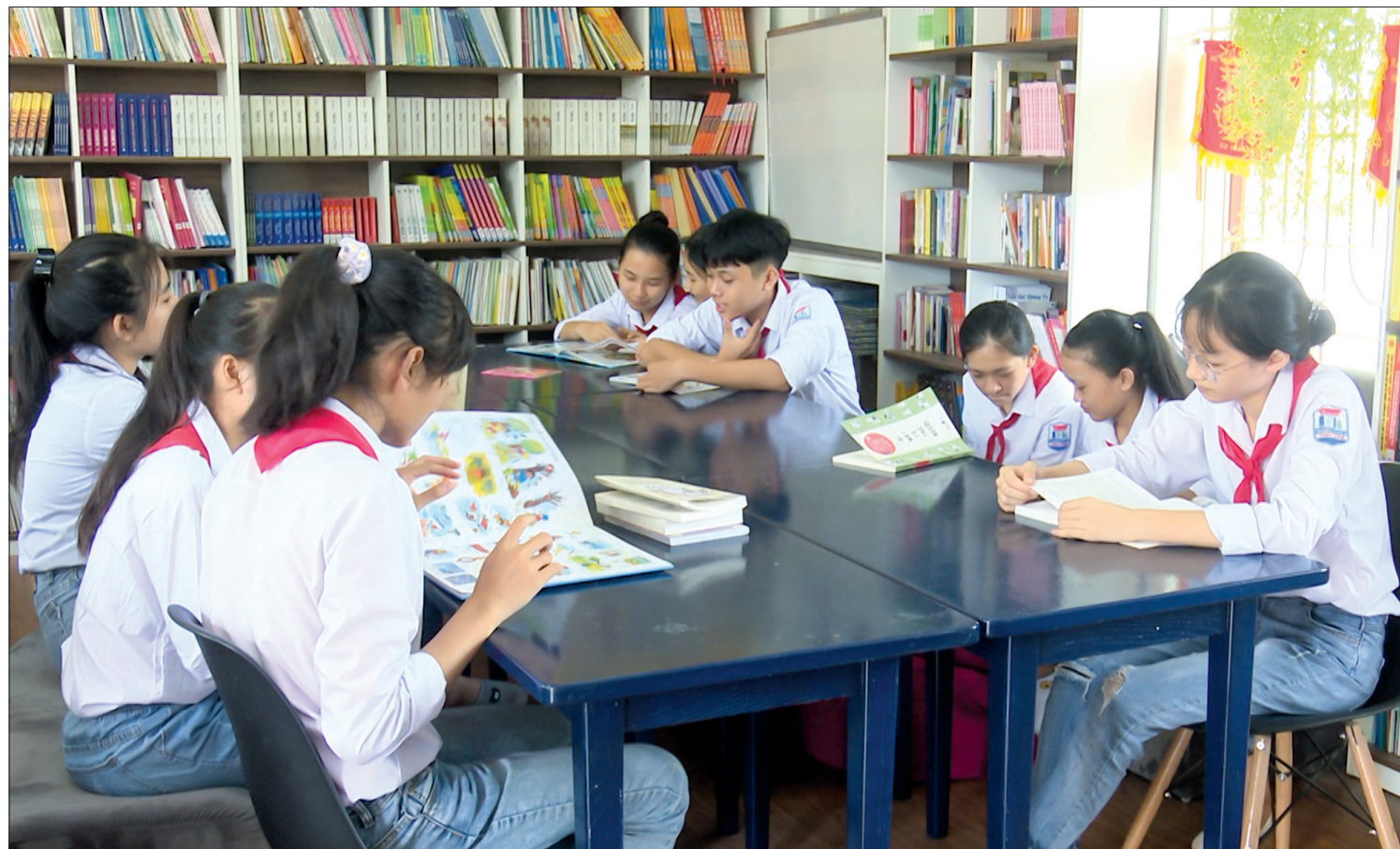
Học sinh Trường THCS Thụy Liên (Thái Thụy) hào hứng đọc sách tại thư viện mở - hiện đại - thân thiện.

Thư viện mở - hiện đại - thân thiện tại Trường Tiểu học Tân Phong (Vũ Thư) thời