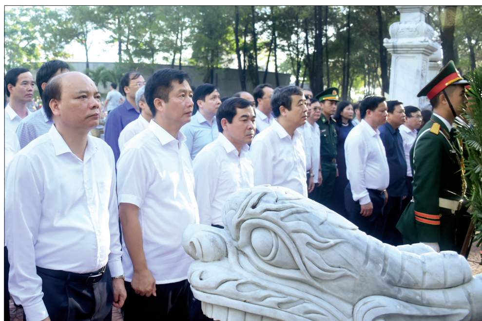
Các đồng chí lãnh đạo tỉnh dâng hương tại Nhà tưởng niệm liệt sĩ tỉnh Thái Bình nằm trong khuôn viên Nghĩa trang Liệt sĩ quốc gia Đường 9.