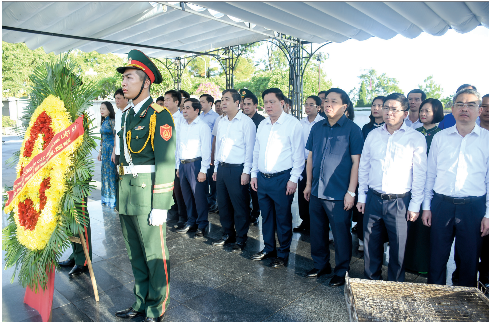
Các đồng chí lãnh đạo tỉnh dâng hương tại Đài tưởng niệm các anh hùng liệt sĩ Nghĩa trang Liệt sĩ quốc gia Đường 9.