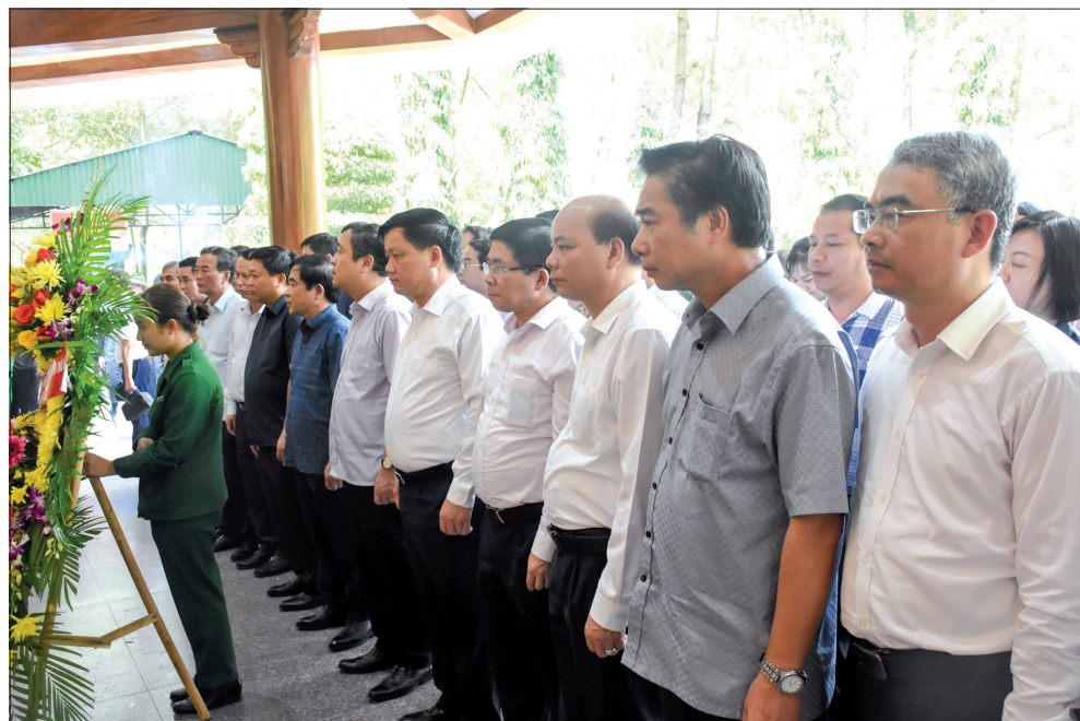
Các đồng chí lãnh đạo tỉnh dâng hương tưởng niệm liệt sĩ thanh niên xung phong toàn quốc và các liệt sĩ đã hy sinh tại Ngã ba Đồng Lộc.