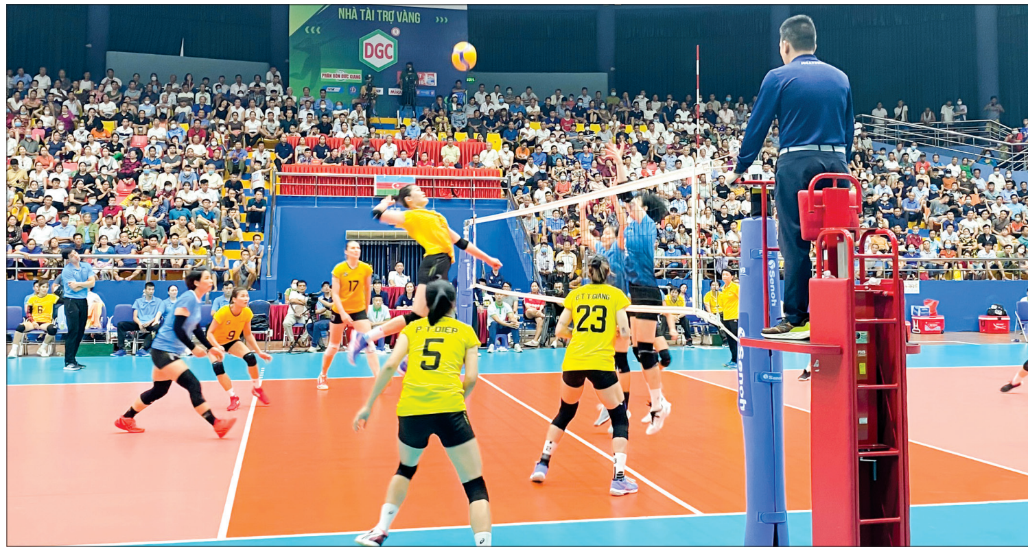
Các cô gái Geleximco Thái Bình đã có màn thể hiện xuất sắc để giành chiến thắng thuyết phục trước đội bóng giàu thành tích VTV Bình Điền Long An.