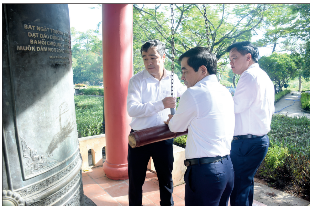
Các đồng chí lãnh đạo tỉnh thực hiện nghi thức thắp hương tại Nghĩa trang Liệt sĩ quốc gia Trường Sơn.