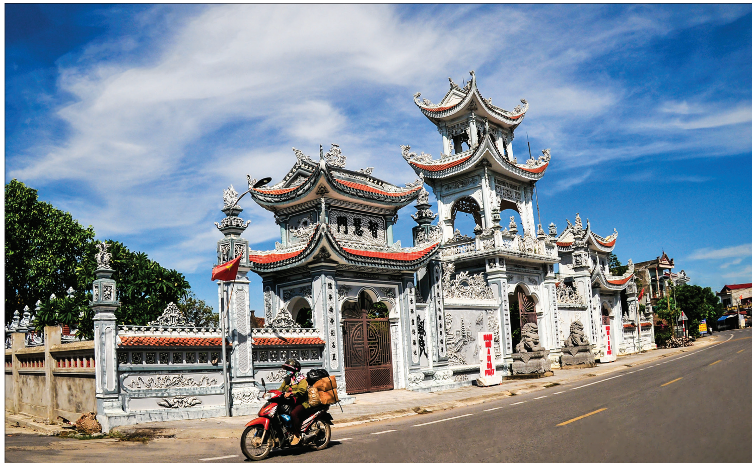
Khu vực chùa Tây Linh, xã Thụy Liên (Thái Thụy) xưa kia từng là nơi hoạt động của nghĩa quân Tạ Hiện chống Pháp thời gian cuối thế kỷ XIX.

Sau tiếng súng của đế quốc Pháp năm 1858 tại Đà Nẵng nã vào thành trì phong kiến nước ta, đến năm 1883 chúng kiểm soát toàn bộ đất nước, trong đó địa danh Thái Bình (ngày nay) được coi là một vùng trọng yếu. Thời điểm lúc bấy giờ, tên đất Thái Bình chưa xuất hiện, chỉ được coi là “ven bờ, cuối bãi” giáp ranh giữa Nam Định và Hưng Yên. Người Pháp đặt tên là An Định. Bị áp bức, tất dẫn đến đấu tranh, vốn xưa kia nơi đây là căn cứ địa của Lý Nam Đế sau đến sự nương nhờ của Đình Tiên Hoàng và là đất “quan hà” của nhà Lý, vùng đất hưng nghiệp phát tích của nhà Trần... người An Định vốn không chịu khuất phục trước thiên tai, giặc dã đã bắt đầu tập hợp lại dưới ngọn cờ của các văn thân yêu nước, cùng nhau chiến đấu chống lại ách áp bức, bóc lột của thực dân Pháp.