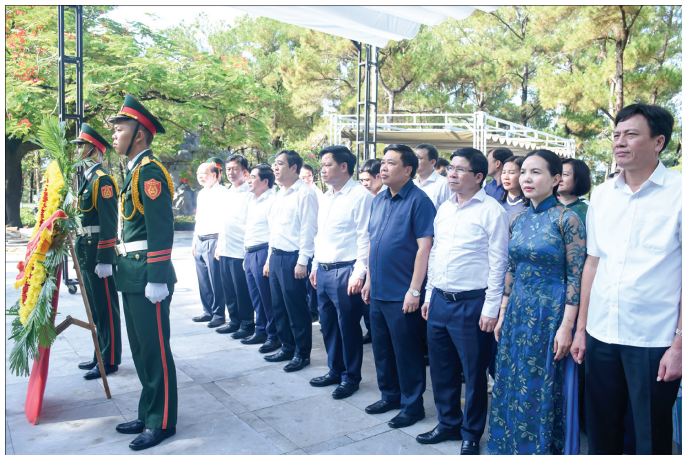
Các đồng chí lãnh đạo tỉnh dâng hương tại Đài tưởng niệm các anh hùng liệt sĩ Nghĩa trang Liệt sĩ quốc gia Trường Sơn.