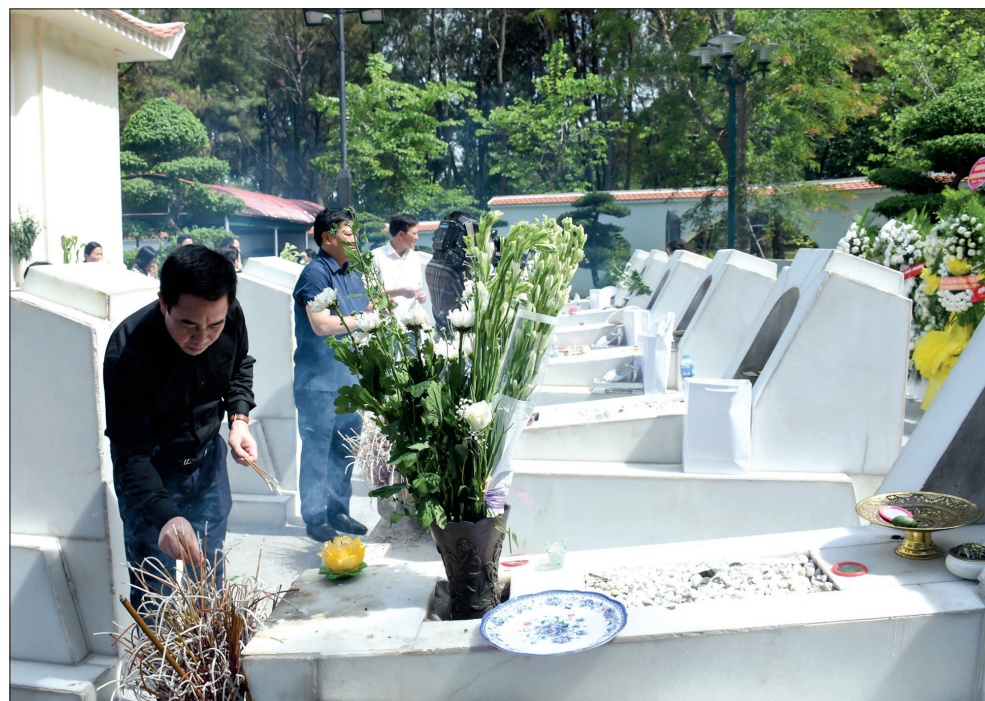
Thắp hương tưởng niệm 10 liệt sĩ nữ thanh niên xung phong Ngã ba Đồng Lộc.

Trước anh linh các anh hùng liệt sĩ, đoàn đại biểu tỉnh Thái Bình kính cẩn nghiêng mình, dành phút mặc niệm để bày tỏ lòng biết ơn vô hạn đối với công lao to lớn của các thế hệ cha anh vì sự nghiệp đấu tranh giải phóng dân tộc và thống nhất đất nước.