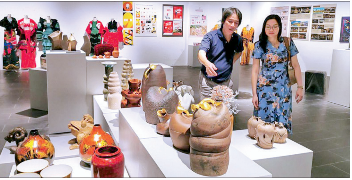
Ban tổ chức kiểm tra công tác trưng bày các tác phẩm tại triển lãm.

(nhandan.vn) Cuộc thi và triển lãm mỹ thuật ứng dụng toàn quốc lần thứ 5 sẽ là dịp để công chúng chiêm ngưỡng sự đa dạng của các chất liệu, sự phong phú trong tạo hình, thiết kế sản phẩm, là dịp để các nhà thiết kế, nghệ sĩ, nghệ nhân kết nối với các doanh nghiệp, thúc đẩy sản xuất, tiêu thụ sản phẩm mỹ thuật ứng dụng trong nước và quốc tế.