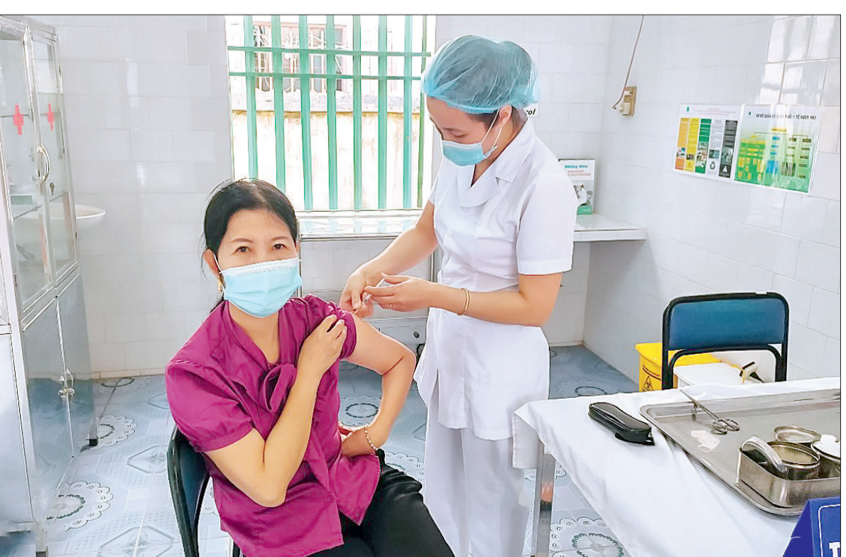
Cán bộ y tế tiêm vắc-xin phòng Covid-19 cho người dân.

tác tuyên truyền để người dân tiếp tục nâng cao ý thức trách nhiệm phòng, chống dịch bệnh. Bên cạnh đó, lãnh đạo, cán bộ của huyện được phân công theo dõi đơn vị, địa phương yêu cầu thường xuyên về cơ sở để kiểm tra, đôn đốc, chỉ đạo trực tiếp việc tiêm chủng một cách quyết liệt, góp phần bảo vệ, nâng cao sức khỏe của người dân. NGUYỄN CƯỜNG