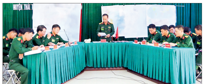
Diễn tập chuyển trạng thái sẵn sàng chiến đấu.

Trong 2 ngày 14 - 15/10, Ban CHQS huyện Thái Thụy tổ chức diễn tập chỉ huy cơ quan 1 bên, 1 cấp trên bản đồ và ngoài thực địa.