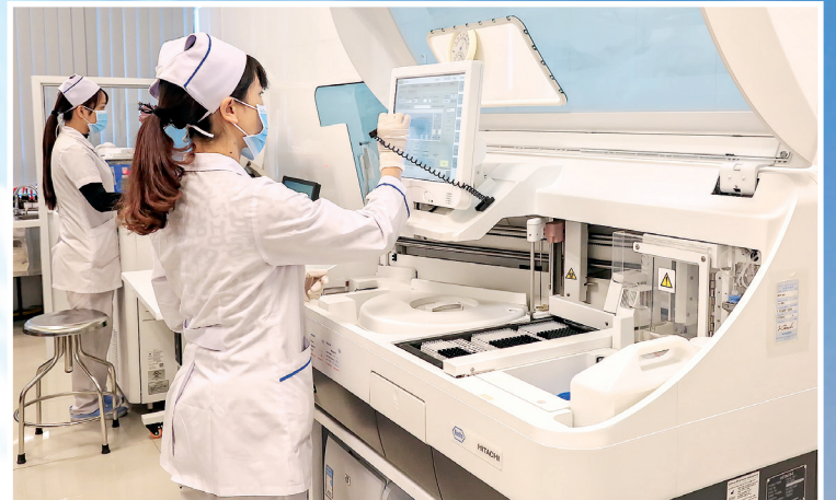
Trung tâm xét nghiệm công nghệ cao.