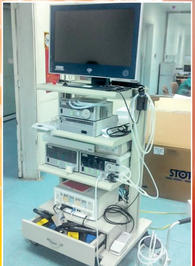
Hệ thống nội soi dạ dày, đại tràng hỗ trợ chẩn đoán ung thư sớm của Karl stort (Đức)