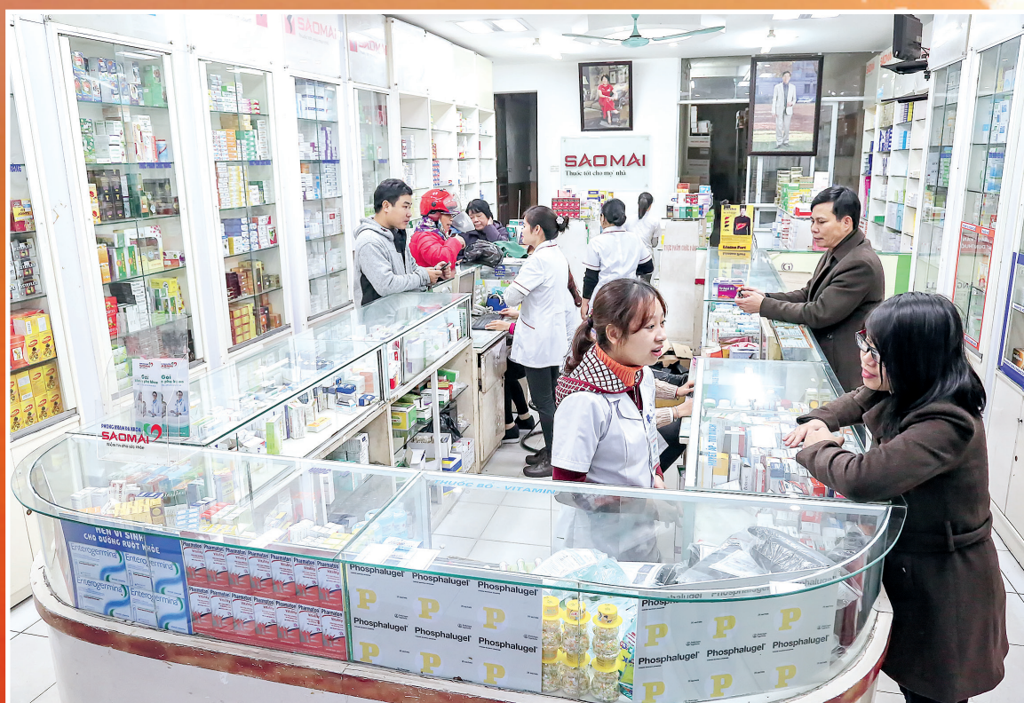
Hệ thống cửa hàng bán lẻ.