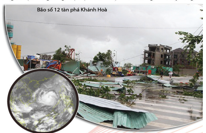
Bão số 12 tàn phá Khánh Hoà

Đây là cơn bão mạnh nhất trong nhiều năm qua, bất ngờ đổ bộ vào khu vực Nam Trung bộ, gây hậu quả đặc biệt nghiêm trọng về người và tài sản. Năm qua, Việt Nam phải hứng chịu 16 cơn bão với những thiệt hại nặng nề về người và tài sản (375 người chết và mất tích, 636 người bị thương, tổng thiệt hại về cơ sở vật chất khoảng 51.590 tỷ đồng).