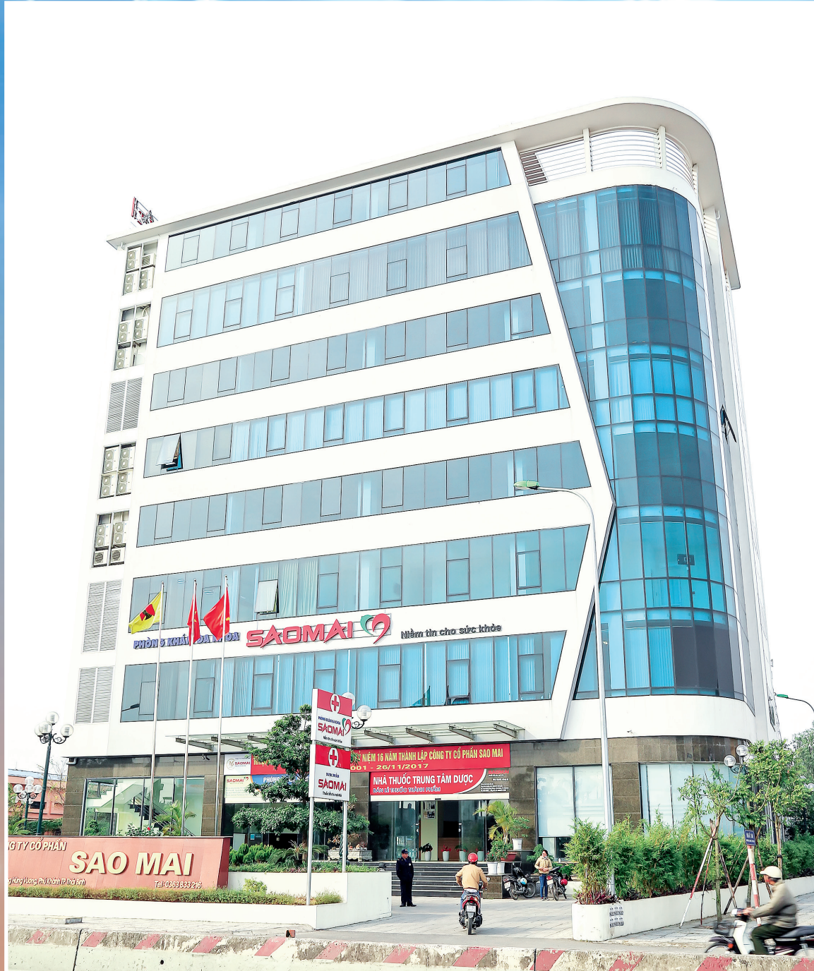
Trụ sở Công ty.