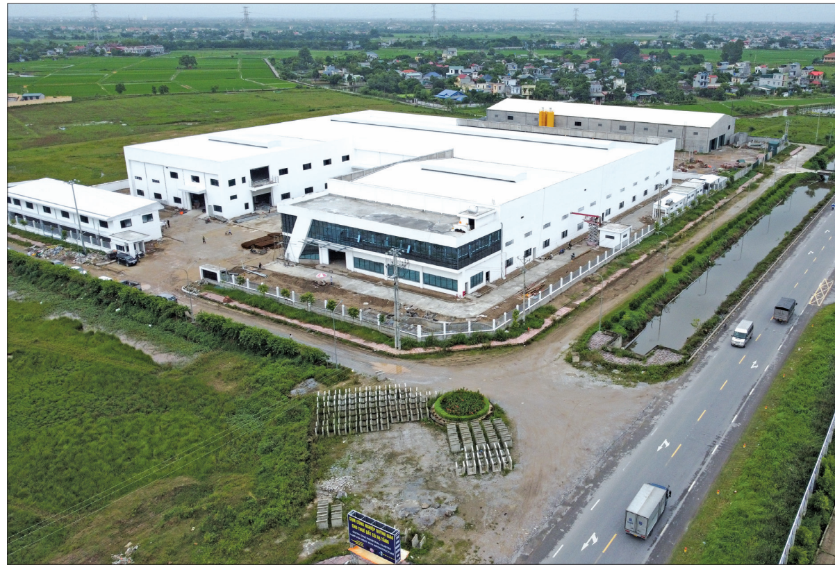
Cụm công nghiệp Quỳnh Giao hấp dẫn nhà đầu tư thủ cấp vì có vị trí thuận lợi, giao thông kết nối, hạ tầng kỹ thuật đồng bộ.

Chỉ trong thời gian ngắn, cụm công nghiệp Quỳnh Giao (Quỳnh Phụ) đã thu hút được nhiều dự án thủ cấp chất lượng cao vào hoạt động, sớm lấp đầy diện tích đất công nghiệp, hứa hẹn sẽ mang đến sự bứt phá cho kinh tế địa phương.