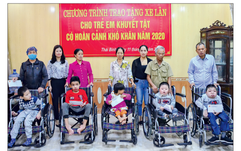
Đại diện Quỹ Bảo trợ trẻ em tỉnh trao xe lăn cho trẻ khuyết tật.

Sáng ngày 11/10, Quỹ Bảo trợ trẻ em tỉnh tổ chức trao xe lăn cho trẻ em khuyết tật có hoàn cảnh khó khăn trong tỉnh. 30 trẻ em bị khuyết tật có hoàn cảnh khó khăn tại các huyện, thành phố được Quỹ Bảo trợ trẻ em tỉnh trao 30 chiếc xe lăn cùng 30 suất quà, mỗi suất trị giá 300.000 đồng. Đây là những món quà có ý nghĩa thiết thực thể hiện sự quan tâm của các cấp, các ngành và toàn xã hội với những mảnh đời kém may mắn trong cuộc sống, giúp các em có phương tiện đi lại thuận lợi; đồng thời khích lệ các em cố thêm nghị lực vượt qua mặc cảm, vươn lên hòa nhập cộng đồng.