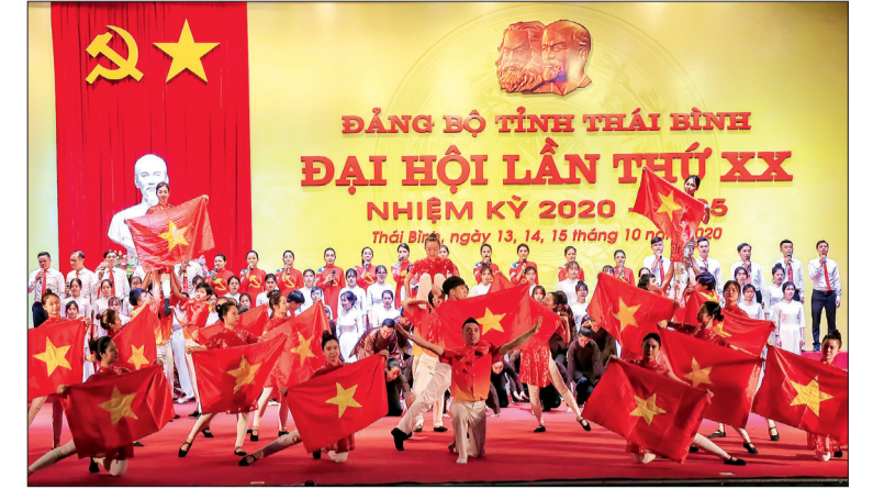
Một tiết mục tại buổi tổng duyệt chương trình nghệ thuật chào mừng Đại hội đại biểu Đảng bộ tỉnh lần thứ XX.