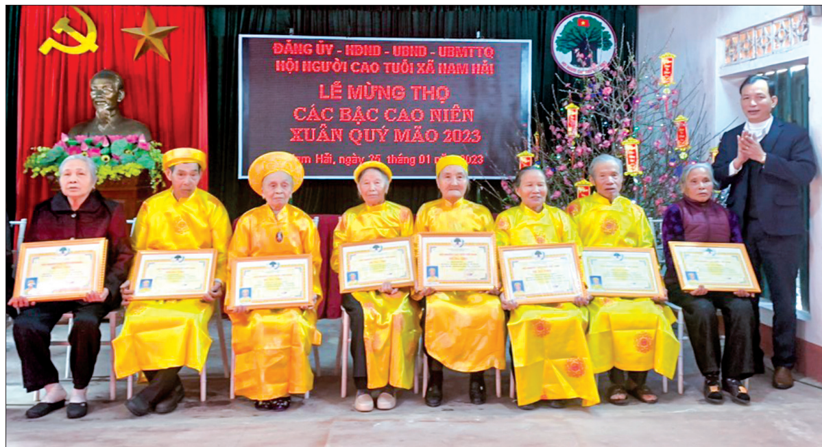
Người cao tuổi xã Nam Hải (Tiền Hải) được mừng thọ, chúc thọ.

"Tuổi già như bách như tùng/Như cây thiên tuế sống cùng nước non/Đa đê sống mãi sắc son/Rủ che bóng mát cháu con đi về". Những câu thơ dành tặng các cụ cao niên trong ngày đầu xuân năm mới thay cho lời chúc thọ, mừng thọ của các con, các cháu trong gia đình đã góp phần làm cho không khí buổi lễ mừng thọ, chúc thọ trở nên ấm áp và đủ đầy hơn.