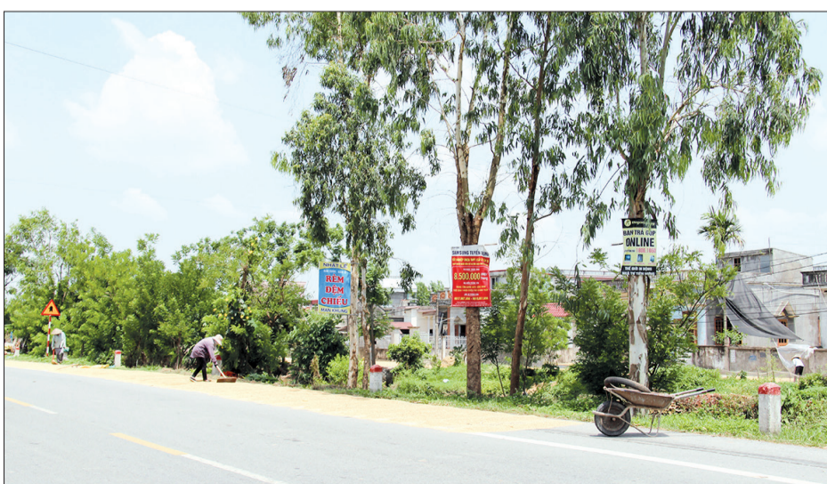
Người dân bất chấp nguy hiểm đứng trên đường phơi thóc.