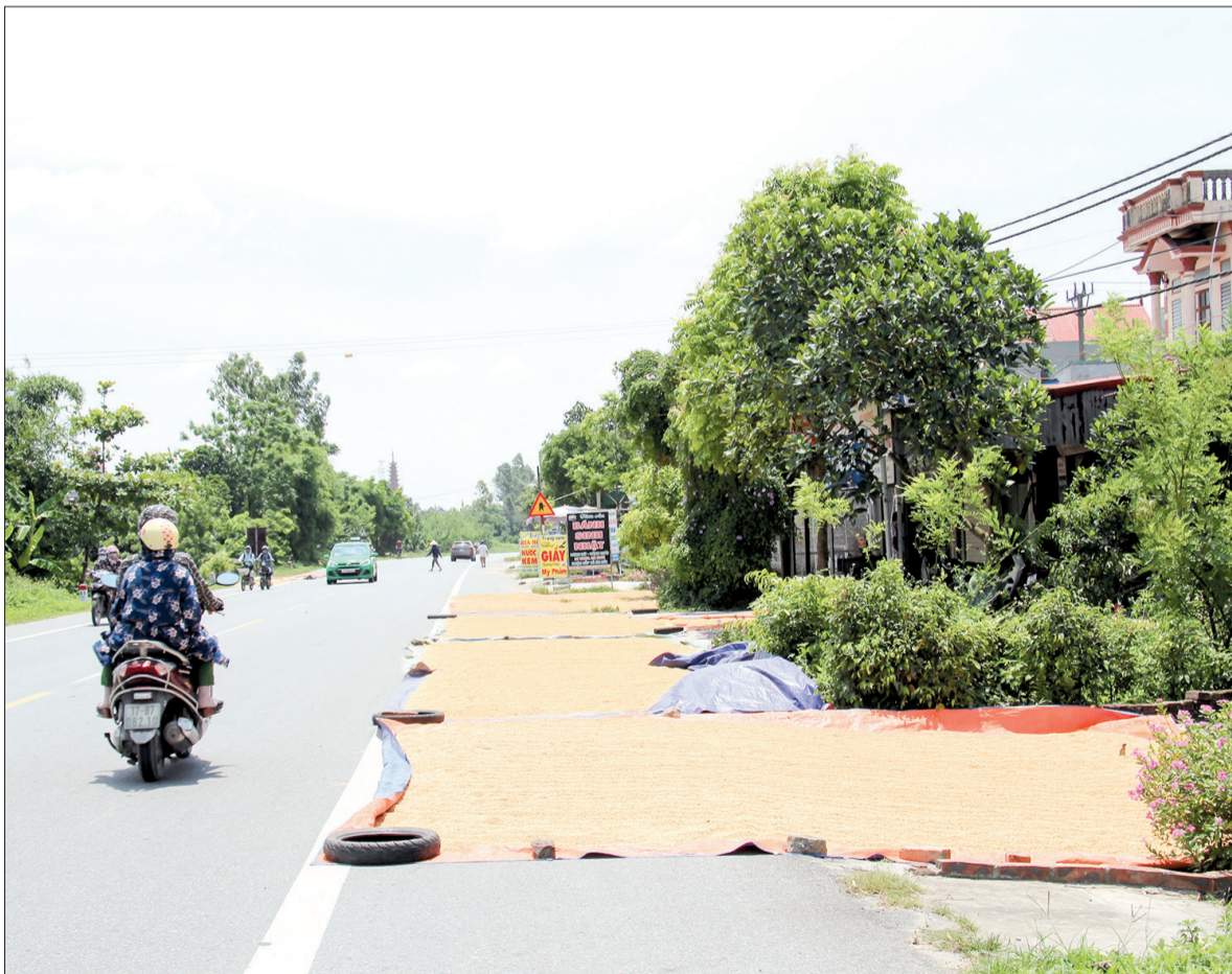
Người dân phố Tăng (xã Phú Châu) dùng gạch, lớp cao su để chắn thóc phơi trên quốc lộ 39.