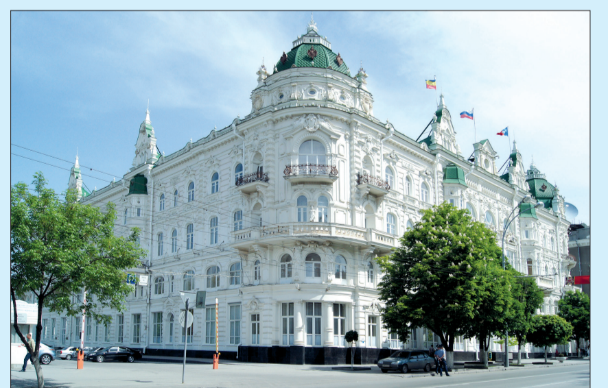
Rostov-on-Don là thành phố lớn nhất ở miền Nam nước Nga, nằm bên bờ sông Đông.