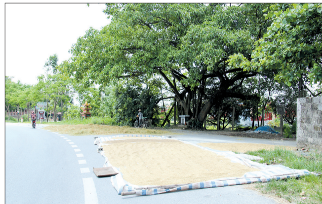
Không chỉ phơi thóc, nông dân xã Hoa Lu còn phơi cả rơm trên quốc lộ 39.