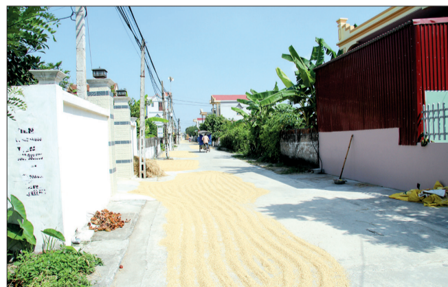
Đường liên thôn ở xã Hoa Nam thành sân phơi thóc.