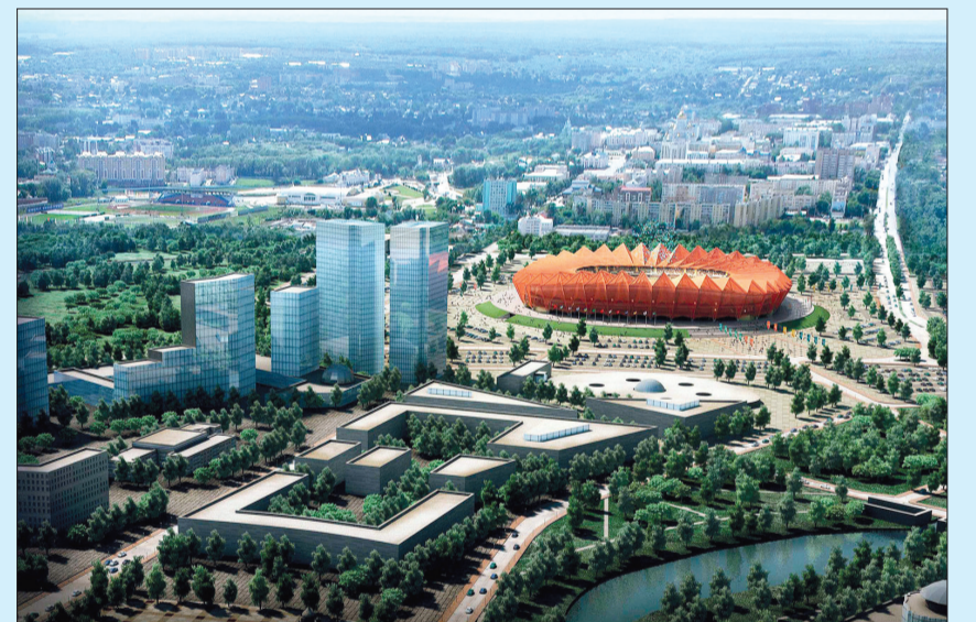
Saransk là thành phố nhỏ nhất trong số những nơi diễn ra World Cup 2018.