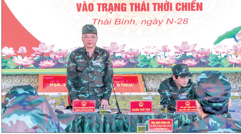
Luyện tập nội dung: HDND tỉnh khóa XVII, nhiệm kỳ 2021 - 2026 tổ chức kỳ họp chuyên đề ra Nghị quyết lãnh đạo chuyển địa phương vào trạng thái thời chiến.