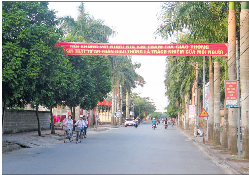
Diện mạo nông thôn mới nâng cao xã Thanh Tân (Kiến Xương).

Xác định tầm quan trọng của cuộc vận động (CVD) "Toàn dân đoàn kết xây dựng nông thôn mới, đô thị văn minh", những năm qua, ủy ban MTTQ các cấp huyện Kiến Xương đã phát huy vai trò nòng cốt, tích cực tuyên truyền, vận động các tầng lớp nhân dân đoàn kết thực hiện CVD đạt được những kết quả tích cực, góp phần