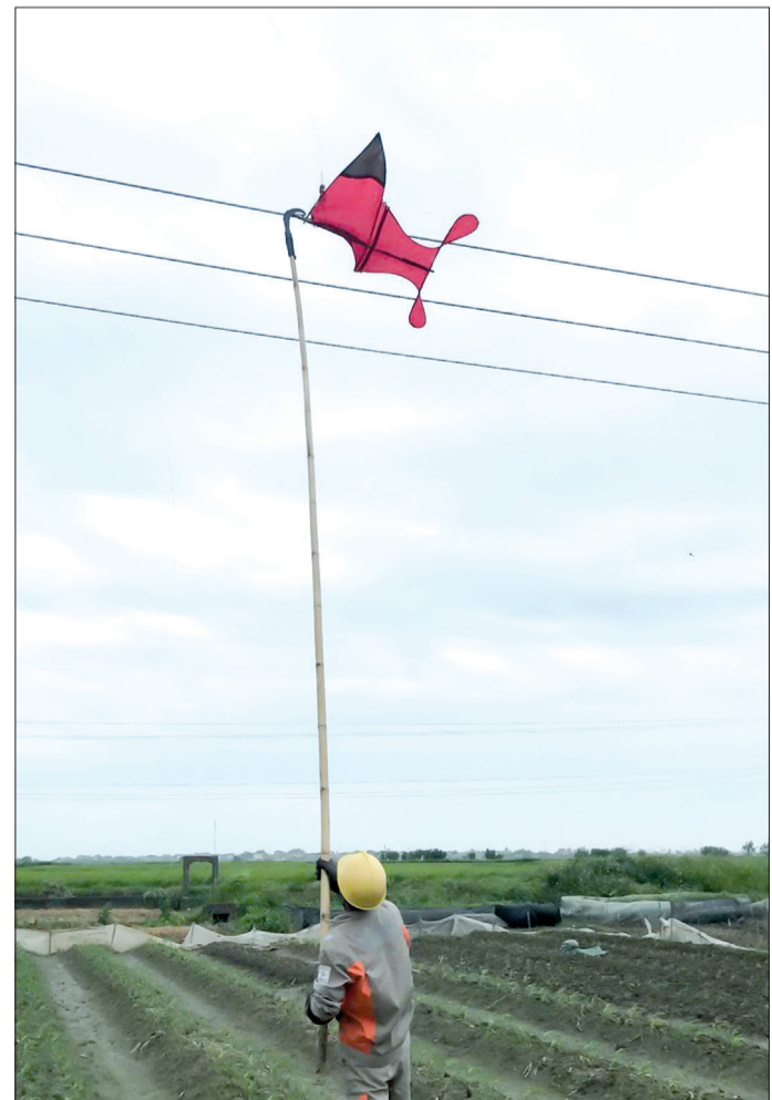
Công nhân Điện lực Quỳnh Phụ khắc phục sự cố diều mắc vào đường dây điện.

Người dân tăng cường hợp tác với cơ quan chức năng cung cấp thông tin về những người thả diều gây sự cố để kiên quyết xử lý theo quy định của pháp luật. Đồng Tiến là xã có địa bàn rộng, dân số đông và có cụm công nghiệp Đập Neo hoạt động, từng chịu ảnh hưởng và thiệt hại do người dân xã khác thả diều gây sự cố lưới điện. Do đó, công tác tuyên truyền, nâng cao ý thức của người dân trong việc bảo đảm an toàn