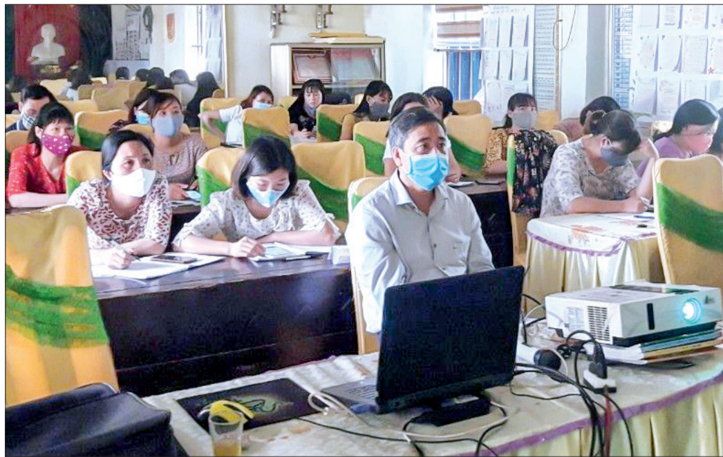
Cán bộ, giáo viên Trường Tiểu học Diệp Nông (Hưng Hà) tham gia tập huấn chương trình giáo dục phổ thông mới.

Chỉ còn ít ngày nữa là chính thức bước vào năm học 2021 - 2022; những ngày này, các địa phương đang khẩn trương hoàn thiện cơ sở vật chất, sẵn sàng đón học sinh tựu trường.