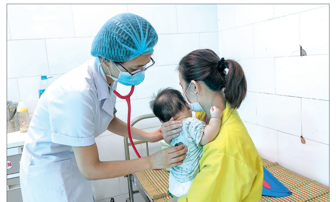
Bệnh nhân 6 tháng tuổi được điều trị tại Khoa Tiêu hóa, Bệnh viện Nhi Thái Bình.