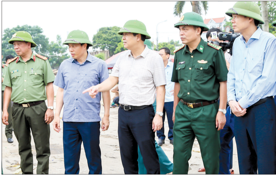
Đồng chí Ngô Đồng Hải, Ủy viên Ban Chấp hành Trung ương Đảng, Bí thư Tỉnh ủy cùng các đồng chí lãnh đạo tỉnh kiểm tra, chỉ đạo công tác ứng phó với bão số 3 tại cảng cá Tân Sơn (Thái Thụy).