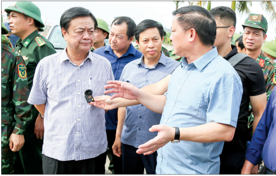
Bộ trưởng Bộ Nông nghiệp và Phát triển nông thôn Lê Minh Hoan cùng các đồng chí lãnh đạo tỉnh kiểm tra, chỉ đạo công tác ứng phó với bão số 3 tại cảng cá Tân Sơn (Thái Thụy).