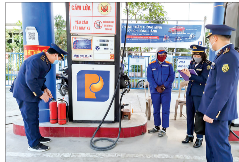
Lực lượng chức năng kiểm tra, giám sát hoạt động kinh doanh xăng dầu tại cửa hàng xăng dầu trên đường Hai Bà Trưng (thành phố Thái Bình).

xăng dầu, lực lượng chức năng giám sát về giá bán, kiểm tra thiết bị cút bơm và đánh giá về đo lường, đồng thời yêu cầu các chủ cửa hàng thực hiện nghiêm các quy định về kinh doanh xăng dầu, các nội dung đã ký cam kết với Cục Quản lý thị trường tỉnh. Theo lãnh đạo Cục Quản lý thị trường tỉnh, hiện nay trên địa bàn tỉnh có 238 cửa hàng xăng dầu đủ điều kiện hoạt động kinh doanh, qua công tác kiểm tra, giám sát từ đầu tháng 1 đến nay chưa phát hiện trường hợp đầu cơ tích trữ, đóng cửa không bán, găm hàng chờ xăng lên giá.