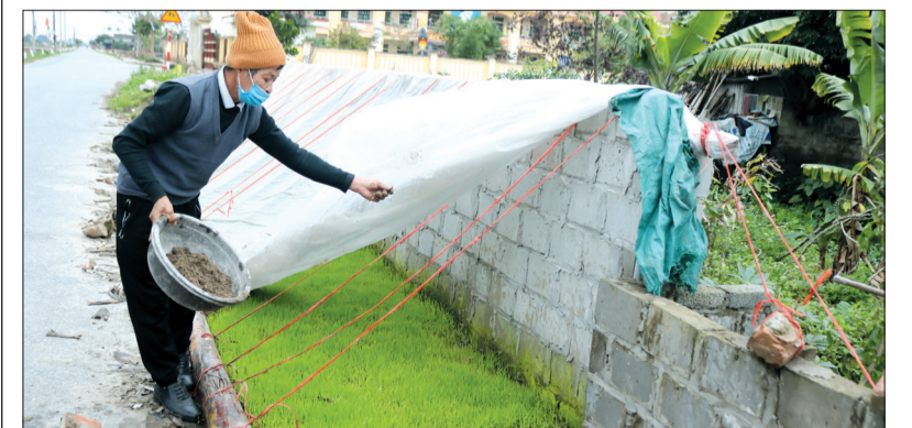
Nông dân xã Quỳnh Hồng (Quỳnh Phụ) che phủ nilon và rắc cát để chống rét cho mạ.

Vụ xuân năm 2022, huyện Quỳnh Phụ phấn đấu gieo cấy 11.140ha. Theo báo cáo của Phòng Nông nghiệp và Phát triển nông thôn huyện, tính đến ngày 23/2, toàn huyện đã gieo cấy được khoảng 5.000ha lúa xuân, trong đó có gần 2.000ha lúa gieo vãi. Trước diễn biến thời tiết rét đậm, rét hại trong những ngày qua, UBND huyện đã triển khai các biện pháp chống rét bảo vệ lúa xuân tới các địa phương.