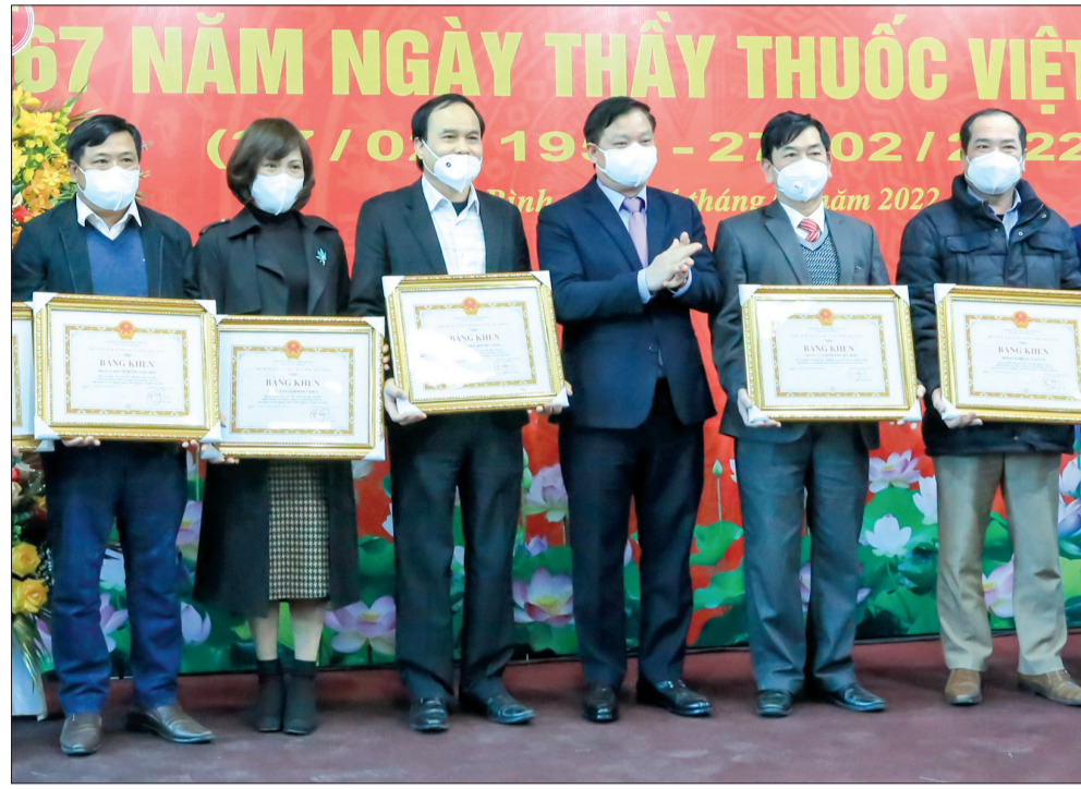
Đổng chí Nguyễn Khắc Thịnh, Phó Bí thư Tỉnh ủy, Chủ tịch UBND tỉnh trao bằng khen cho các tập thể có thành tích xuất sắc.

Chiều ngày 24/2, Sở Y tế tổ chức trực tuyến lễ kỷ niệm 67 năm ngày Thầy thuốc Việt Nam (27/2/1955 - 27/2/2022) và phát động phong trào thi đua năm 2022 với gần 280 điểm cầu tại các huyện, thành phố, xã, phường, thị trấn và các đơn vị y tế trong tỉnh.