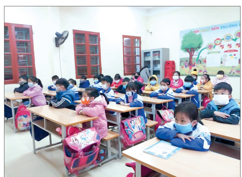
Trường Tiểu học Tân Tiến (Hưng Hà) khuyến khích học sinh đeo khẩu trang trong trường học.

Trong hai ngày 1 - 2/2, nhiều trường học trên địa bàn tỉnh đã tiến hành tổng vệ sinh toàn trường, phối hợp với lực lượng y tế phun thuốc khử khuẩn, chủ động phòng, chống dịch bệnh viêm đường hô hấp cấp do chủng mới của virus corona (nCoV) gây ra. Tại Trường Mầm non Hoa Phượng (thành phố Thái Bình), sáng ngày 1/2, nhà trường đã cho toàn bộ học sinh nghỉ học; tổ chức cho 100% cán bộ, giáo viên vệ sinh các khu vực trong trường, đồ dùng, đồ chơi và trang thiết bị nhà bếp; đồng thời, phối hợp với lực lượng y tế tiến hành phun thuốc khử trùng. Trường cũng đã thông báo các văn bản chỉ đạo của ngành, yêu cầu giáo viên chủ nhiệm phổ biến đến toàn thể phụ huynh hướng dẫn của Bộ Y tế, Bộ Giáo dục và Đào tạo, Sở Giáo dục và Đào tạo các biện pháp phòng, chống dịch bệnh do nCoV gây ra. Bên cạnh đó, hướng dẫn các bé tự chăm sóc, bảo vệ thân thể thông qua các biện pháp đơn giản như: rửa tay bằng xà phòng sát khuẩn trước và sau