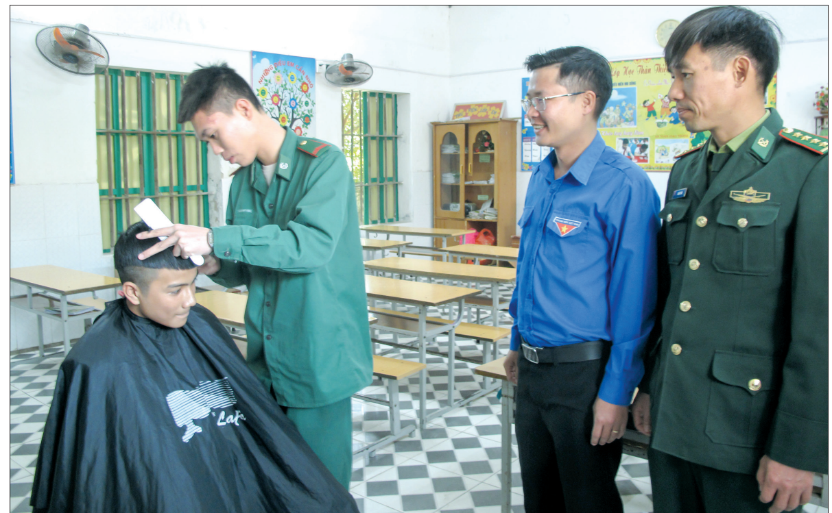
Hơn 60 học sinh của Trường Tiểu học và THCS Tây Tiến (Tiên Hải) được cắt tóc miễn phí trong ngày hội cắt tóc tình nguyện.

nghiên cứu khoa học trong thanh thiếu niên. Chương trình "Tiếp sức đến trường" cho học sinh có hoàn cảnh khó khăn được các cơ sở đoàn tổ chức tốt với nhiều mô hình, cách làm hay như: tổ chức tặng 2.500 đèn chống cận; tặng quần áo, sách vở, đồ dùng học tập; nhận đỡ đầu các em có hoàn cảnh khó khăn; vận động quyên góp cho học sinh nghèo vượt khó; duy trì các đội tình nguyện dạy tiếng Anh miễn phí cho học sinh... Trong phong trào đồng hành với thanh niên lập thân, lập nghiệp, Ban Thường vụ Huyện đoàn đã chỉ đạo các đơn vị tìm hiểu, đồng hành và giúp đỡ, khuyến khích thanh niên làm kinh tế; nhân rộng và duy trì hoạt động của câu lạc bộ thanh niên làm kinh tế giỏi tại các đơn vị... Qua đó, phát triển và nhân rộng các mô hình làm kinh tế, tạo môi trường cho ĐVTN học hỏi và trao đổi kinh nghiệm làm giàu. Ngoài ra, Huyện đoàn còn có nhiều hình thức hỗ trợ thanh niên trong phát triển kinh tế về kiến thức, kỹ thuật chăn nuôi, trồng trọt, hỗ trợ vốn vay để phát triển sản xuất, kinh doanh... Bên cạnh đó, các cấp bộ đoàn trong toàn huyện còn phối hợp tổ chức nhiều hoạt động tư vấn hướng nghiệp, định hướng việc làm cho ĐVTN. Tiếp tục đẩy mạnh học tập và làm theo gương Bác, thời gian tới, các cấp bộ đoàn trên địa bàn huyện Tiên Hải sẽ có nhiều hoạt động cụ thể, thiết thực hơn nữa, phù hợp với mọi đối tượng thanh niên, góp phần xây dựng thể hệ trẻ có lối sống tích cực, có trách nhiệm với cộng đồng, đóng góp tích cực vào sự phát triển chung của huyện.