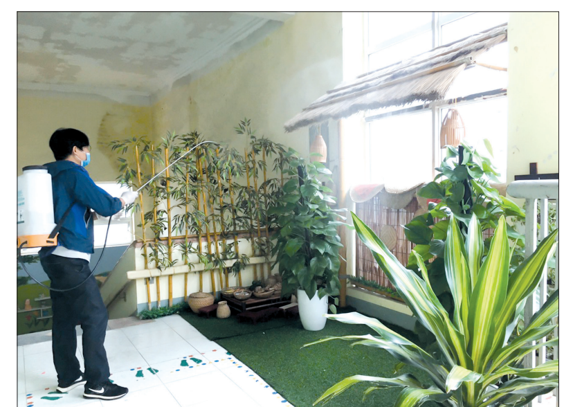
Nhân viên y tế phun thuốc khử khuẩn tại Trường Mầm non Hoa Hồng (thành phố Thái Bình).

chạnh đó, xây dựng các phương án dự phòng hợp lý; giáo viên chủ nhiệm mỗi lớp được giao nhiệm vụ khảo sát xem trong tết các em học sinh đã đi du lịch ở đâu để dự báo khả năng nguy cơ có thể lây nhiễm bệnh nhằm lên kế hoạch phòng, chống kịp thời. Ông Đỗ Trường Sơn nhấn mạnh: Bên cạnh việc thực hiện sự chỉ đạo của các cấp, chúng tôi cũng đề nghị các trường học đặc biệt lưu ý cảnh giác trước một số trang mạng xã hội đăng tải nhiều thông tin thiếu chính xác, cần chọn lọc những thông tin chính thống để tuyên truyền cho các bộ, nhân viên, học sinh