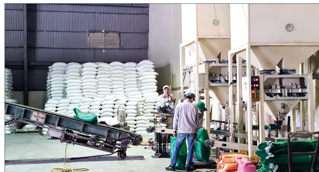
Hoạt động sản xuất ở Công ty TNHH Hưng Cúc.

chức năng tạo ra những lực đẩy lớn để làm thay đổi nhanh quy mô, chất lượng của nền kinh tế. Bởi trong quý I/2023 hoạt động sản xuất, kinh doanh của các doanh nghiệp gặp nhiều khó khăn do phải cạnh tranh khốc liệt về giá bán, thị trường, gặp khó trong tiếp cận tín dụng đầu tư cho phát triển sản xuất... dẫn tới kim ngạch xuất khẩu có dấu hiệu chững lại; vi phạm pháp luật về đất