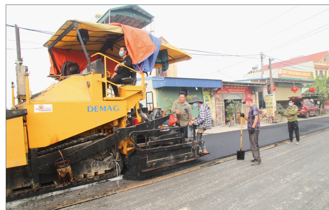
Đẩy nhanh tiến độ thi công các tuyến đường đã hoàn thành giải phóng mặt bằng.