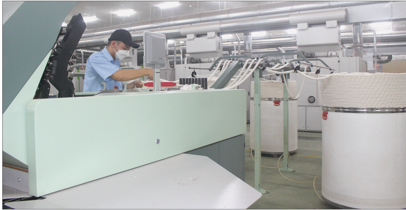
Sản xuất tại Công ty TNHH Thương mại dệt may An Nam (cụm công nghiệp Tây An, huyện Tiên Hải).

Trong bối cảnh còn nhiều khó khăn, kết thúc quý I/2023 kinh tế của tỉnh vẫn giữ được đà tăng trưởng (8,26%), cao hơn cùng kỳ năm 2022 (7,44%), xếp thứ 11 cả nước và thứ 4 vùng đồng bằng sông Hồng (sau Hải Phòng, Ninh Bình, Hải Dương).